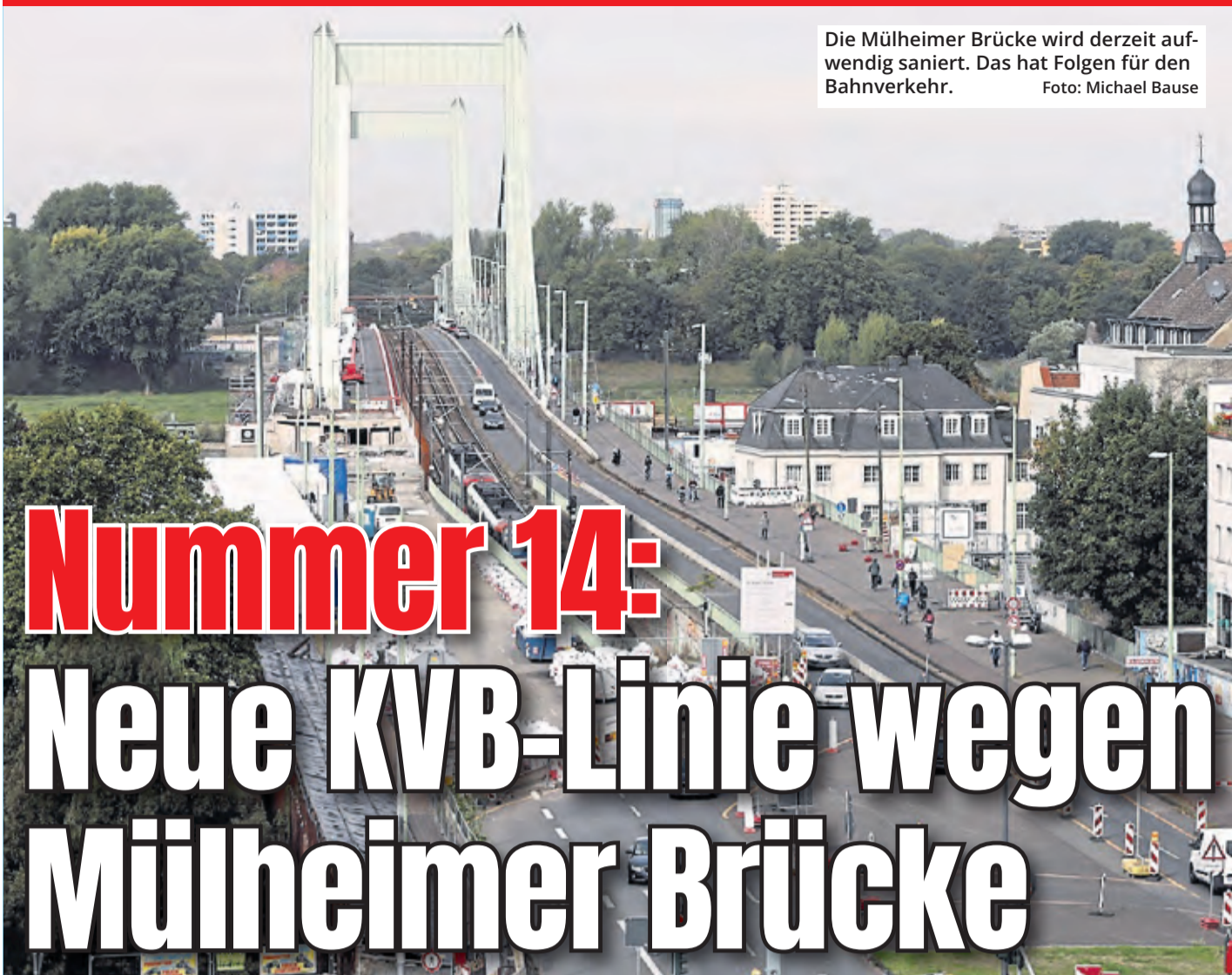
Die Mülheimer Brücke wird derzeit aufwendig saniert. Das hat Folgen für den Bahnverkehr.