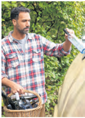
In Hinblick auf Klima- und Umweltschutz lohnt es sich, Glasverpackungen in den richtigen Container einzuwerfen.

Bis heute werden Getränke in Glasbehälter abgefüllt, ebenso Essige und Öle, Gemüse und Marmeladen, aber auch Parfüme und Arzneien. Glas gibt keine Inhaltstoffe ab, nimmt weder Aroma- noch andere Stoffe auf, es lässt sich einfach reinigen und die Färbung wirkt sich positiv auf Qualität und Lagerfähigkeit des Aufbewahrten aus. Einmal ausgeleert, haben Glasverpackungen dann noch eines gemeinsam: Sie können beliebig oft eingeschmolzen und wiederverwertet werden – zum Beispiel für neue Glasverpackungen.