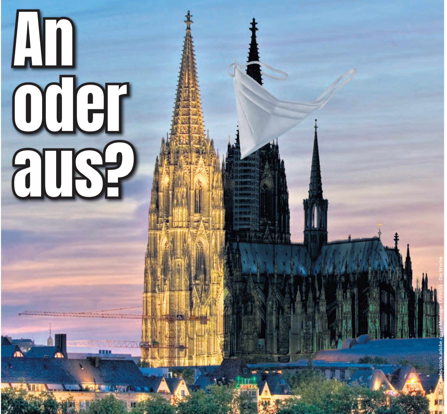
Foto: Guido Jakobs/stock.adobe.com / Montage: EXPRESS - Die Woche