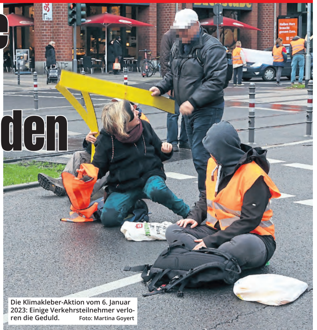
Die Klimakleber-Aktion vom 6. Januar 2023: Einige Verkehrsteilnehmer verloren die Geduld.

Immerhin: Ein Fünkchen Reue lässt sich aus den Worten des 44-Jährigen, der sich im Netz mit seinem Namen zu erkennen gab, durchaus lesen. Er habe zunächst einen der Akti-