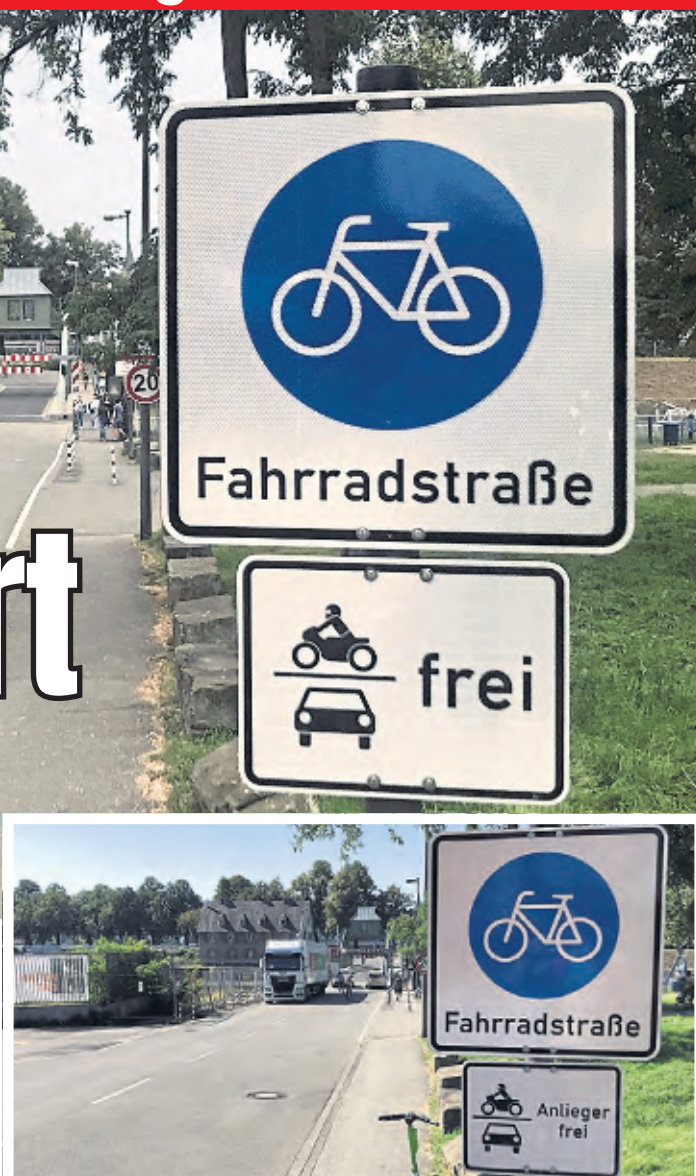
Anfang der Woche sah die Beschilderung anders aus.