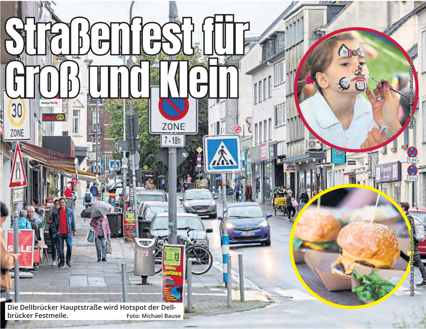
Die Dellbrücker Hauptstraße wird Hotspot der Dellbrücker Festmeile.

Auf der Schäl Sick wird am kommenden Wochenende wieder groß gefeiert. Am 23. und 24. September verwandelt sich die Hauptstraße in die „Dellbrücker Festmeile“.