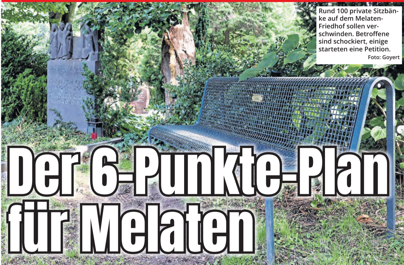
Rund 100 private Sitzbänke auf dem Melaten-Friedhof sollen verschwinden. Betroffene sind schockiert, einige starteten eine Petition.