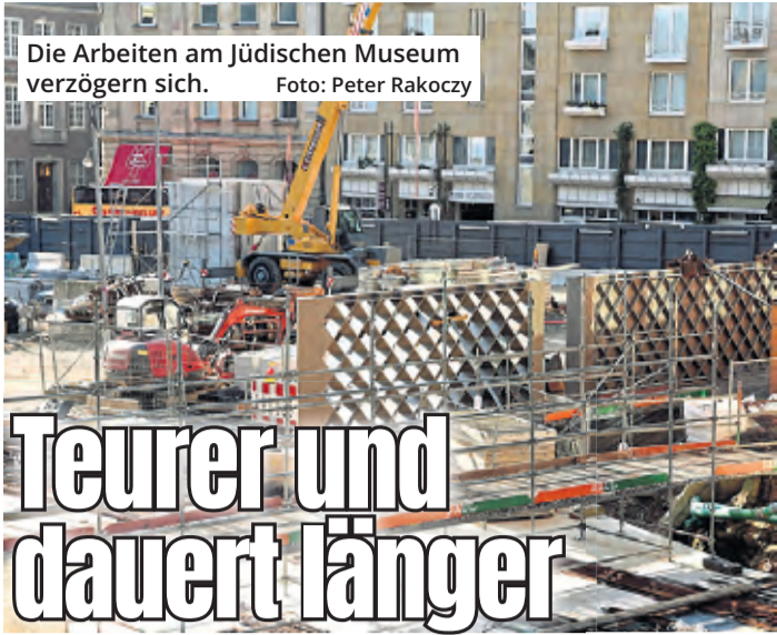
Die Arbeiten am Jüdischen Museum verzögern sich.