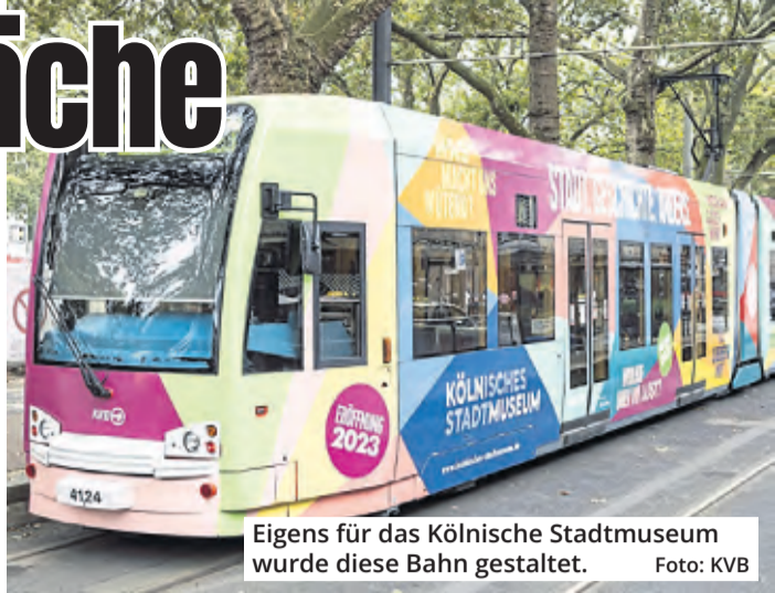
Eigens für das Kölnische Stadtmuseum wurde diese Bahn gestaltet.

Haaks: „Wir sind als KVB Teil der Geschichte und der Gegenwart dieser Stadt. Das verbindet uns mit dem Stadtmuseum, und daher werben wir gerne