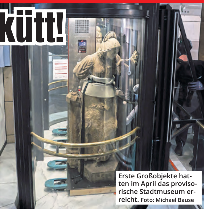
Erste Großobjekte hatten im April das provisorische Stadtmuseum erreicht.