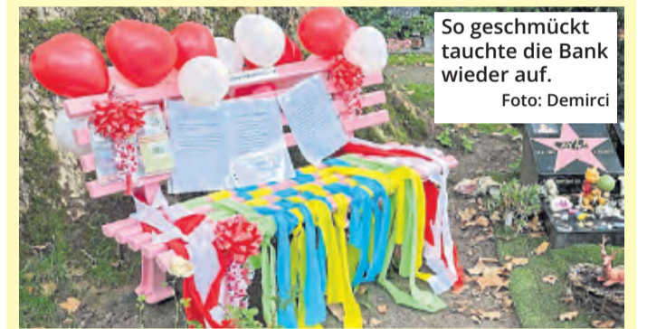
So geschmückt tauchte die Bank wieder auf.

Wer für den vermeintlichen Diebstahl und die Rückgabe verantwortlich ist, bleibt unklar. Die Bank ist vor Ort auch nicht wieder im Boden befestigt worden. Die gelösten Schrauben waren nach dem Verschwinden in der Vorwoche am Grab gefunden worden.