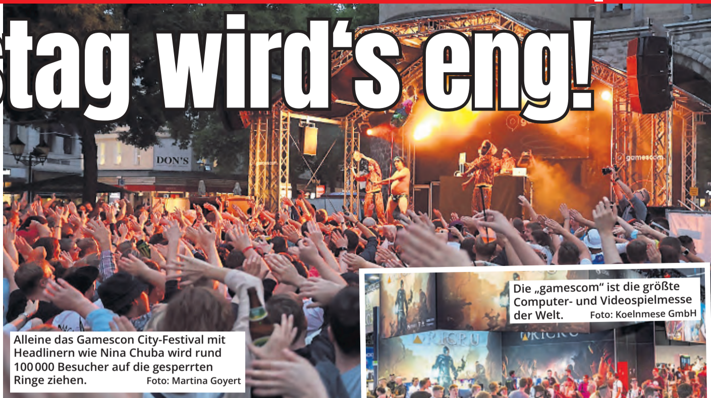
Alleine das Gamescom City-Festival mit Headlinern wie Nina Chuba wird rund 100 000 Besucher auf die gesperrten Ringe ziehen.

sentieren sich an zwei Tagen große und kleine Show- und Musik-Acts bei freiem Eintritt Open Air auf den Bühnen. Die TOGGO-Tour für Kinder zieht vom Neumarkt auf den Picassoplatz und Sonntag feiert die Veranstaltung „Arsch huh fürs Klima“ ihre Premi-