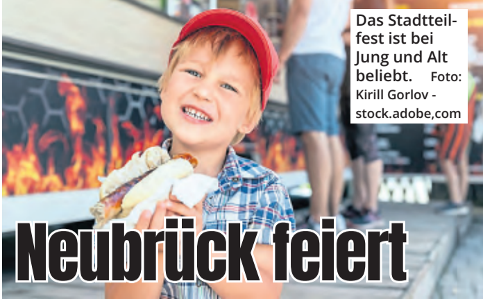
Das Stadtteilfest ist bei Jung und Alt beliebt.