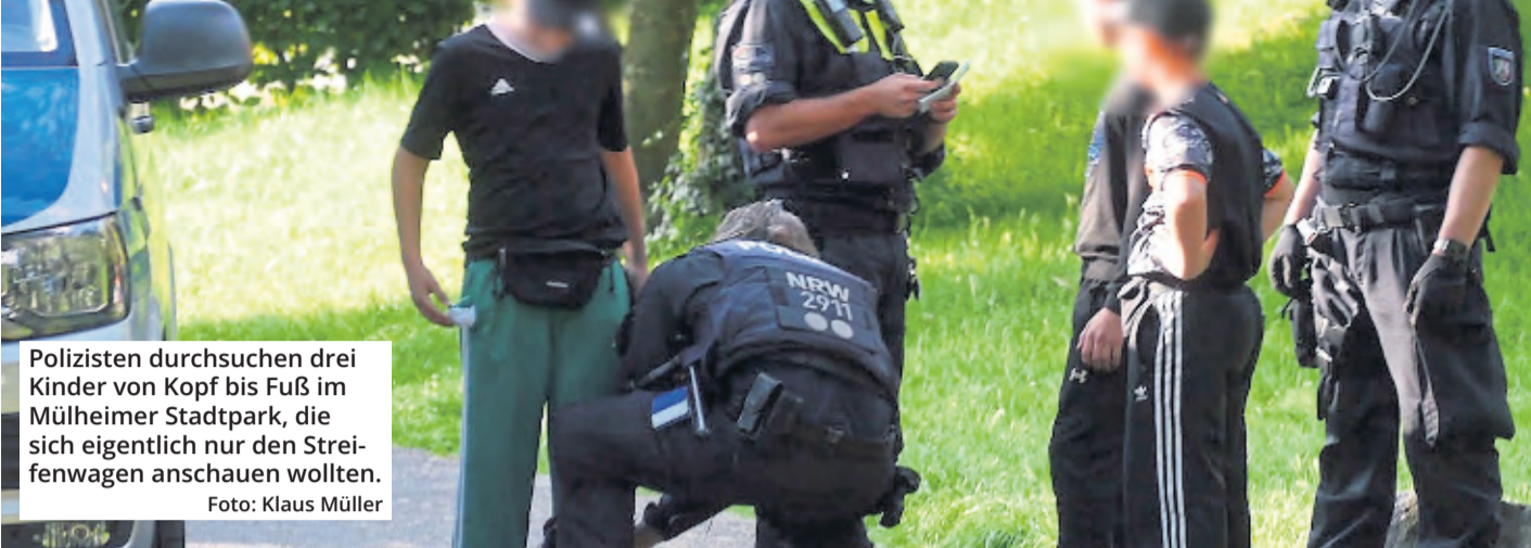
Polizisten durchsuchen drei Kinder von Kopf bis Fuß im Mülheimer Stadtpark, die sich eigentlich nur den Streifenwagen anschauen wollten.

Es ist ein Bild, das einige Fragen bei den derzeit stattfindenden Schwerpunktkontrollen der Kölner Polizei am Wiener Platz und im Mülheimer Stadtpark aufwirft. Polizisten haben sich drei Kinder vorgenommen, kontrollieren ihre Personalien und durchsuchen sie von Kopf bis Fuß. Der Auftrag der Beamten lautet: Kriminalitätsbekämpfung.