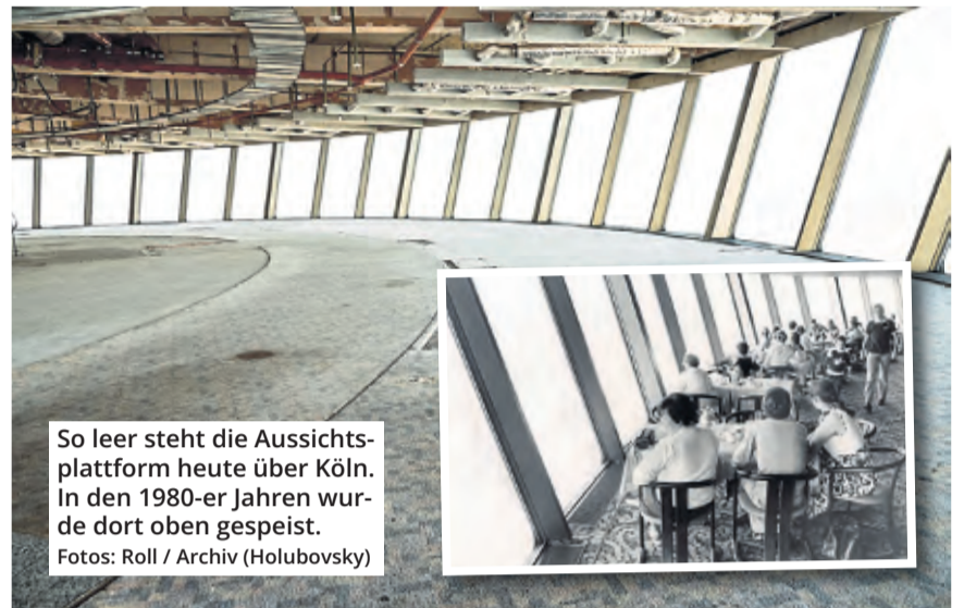
So leer steht die Aussichtsplattform heute über Köln. In den 1980-er Jahren wurde dort oben gespeist.

„Auch ein gewisser Eventcharakter wird wichtig.“