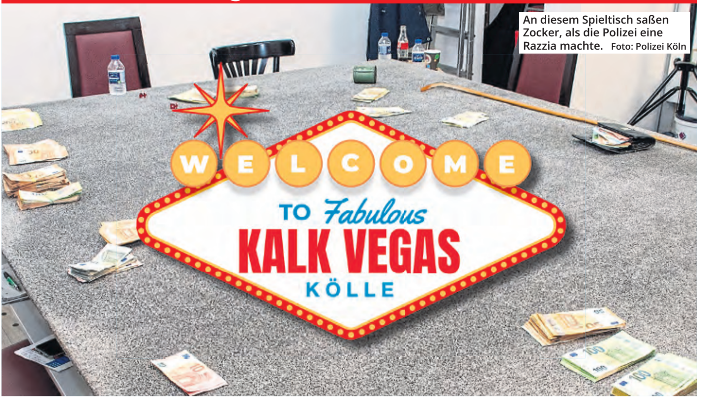
An diesem Spieltisch saßen Zocker, als die Polizei eine Razzia machte.

Da kam die Kölner Polizei aber höchst ungelegen, als 16 Männer an einem Spieltisch in einem Kalker Café saßen und gerade mit den Würfeln zockten. Die Herren waren so überrascht, dass sie nicht einmal mehr Zeit hatten, ihre Kohle einzupacken. Als Beweis schossen die Beamten das Foto mit Seltenheitswert vom Spieltisch.