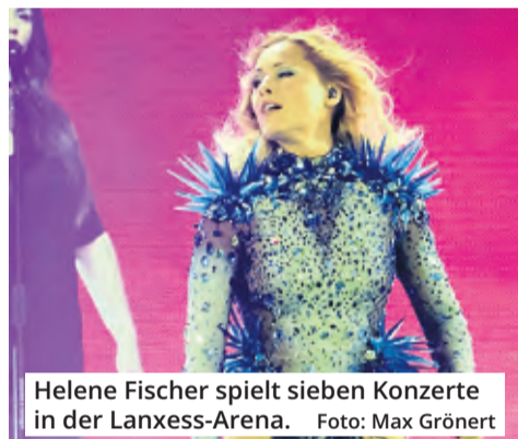
Helene Fischer spielt sieben Konzerte in der Lanxess-Arena.

Es geht aber ausnahmsweise auch eine Nummer kleiner und vor allem relaxter: Im Odonien (Hornstraße) startet um 14 Uhr das familienfreundliche „Roots Up Tagesfestival“ für Liebhaber von Roots Reggae. Spielen werden „Sista Argie & The Rebel Solution Band“, „RevolutionR“ und „Royal Sounds“ aus London/UK. Das Areal ist für 600 Zuschauer ausgelegt. Tickets gibt es noch an der Tageskasse.