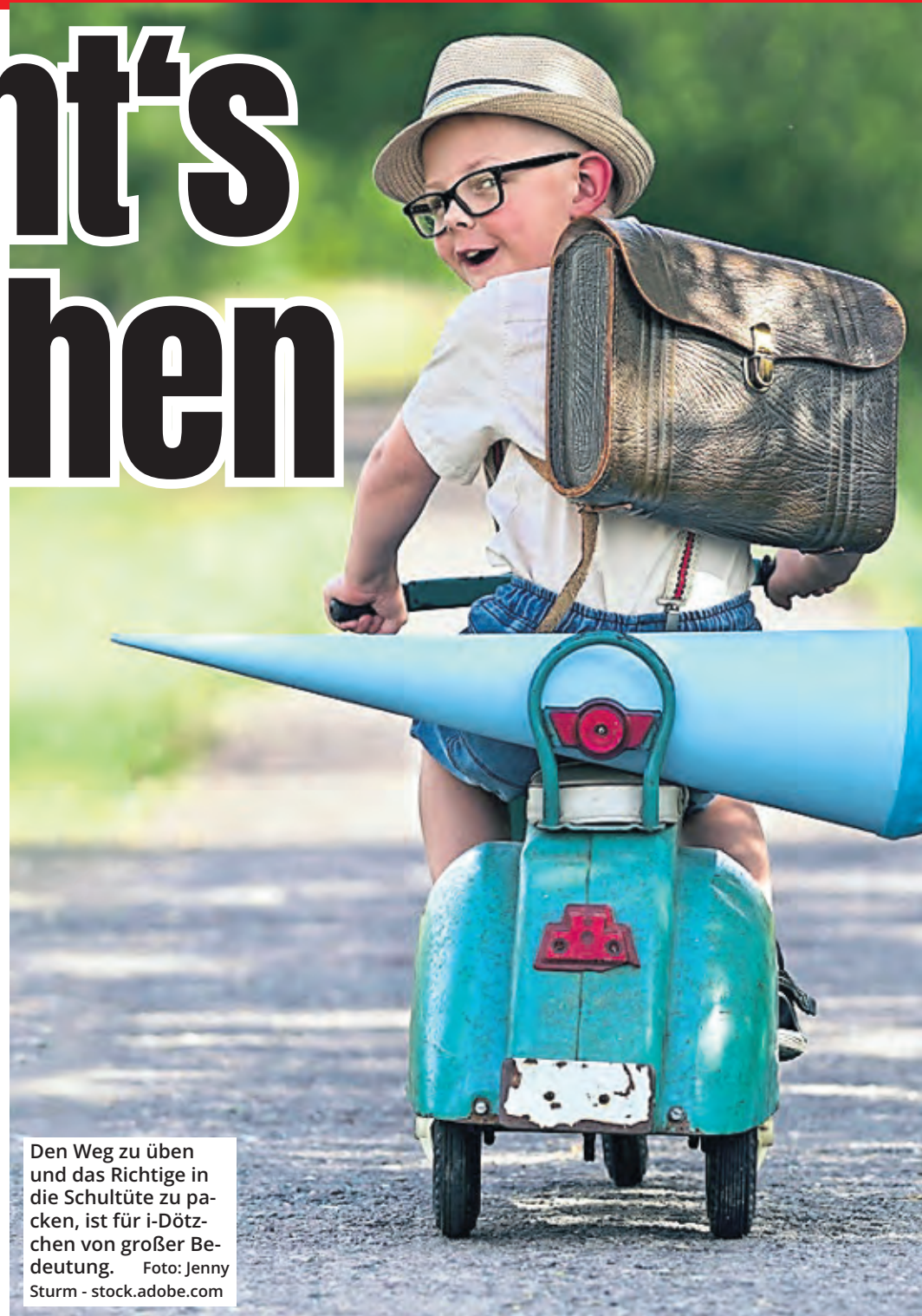
Den Weg zu üben und das Richtige in die Schultüte zu packen, ist für i-Dötzchen von großer Bedeutung.

In der Regel sind i-Dötzchen laut dem schulpсихologischen Dienst der Stadt Köln „übereilt“ mit Erlebnissen, die erzählt werden müssen. Sollte den Eltern hingegen auffallen, dass das Kind nichts