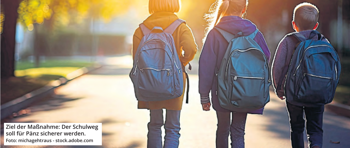
Ziel der Maßnahme: Der Schulweg soll für Pänz sicherer werden.

Ab Montag wird im Umfeld der Rosenmaarschule in Höhenhaus eine Schulstraße eingerichtet. Dabei wird die Einfahrt in die Straße Am Rosenmaar sowie die in die Heidenrichstraße jeweils montags bis freitags zwischen 7.45 und 8.15 Uhr und nachmittags zwischen 15 und 15.30 Uhr für den Kfz-Verkehr gesperrt.