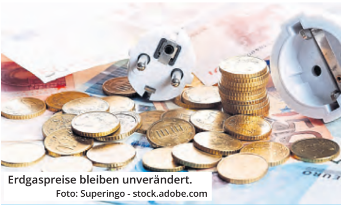
Erdgaspreise bleiben unverändert.

Strom: Der Arbeitspreis in der Grundversorgung für Privatkunden in Köln beträgt ab diesem Termin 44,91 Cent brutto pro Kilowattstunde. Er sinkt somit um 10,07 Cent brutto pro Kilowattstunde – von aktuell 54,98 Cent. Weiterhin gelten die Regelungen der Energiepreislösung, so dass Kunden für 80 Prozent des prognostizierten Jahresverbrauchs in diesem Tarif maximal 40 Cent pro Kilowattstunde zahlen. Insofern wirkt sich die Preissenkung in der Grundversorgung positiv auf den Teil des Verbrauchs aus, der über die 80 Prozent hinausgeht. Das Unternehmen bietet zusätzlich zwei Verträge mit garantierten Preisen über eine feste Laufzeit von 12 oder 24 Monaten zum Abschluss an. Diese Verträge zahlen sich für die Kunden in