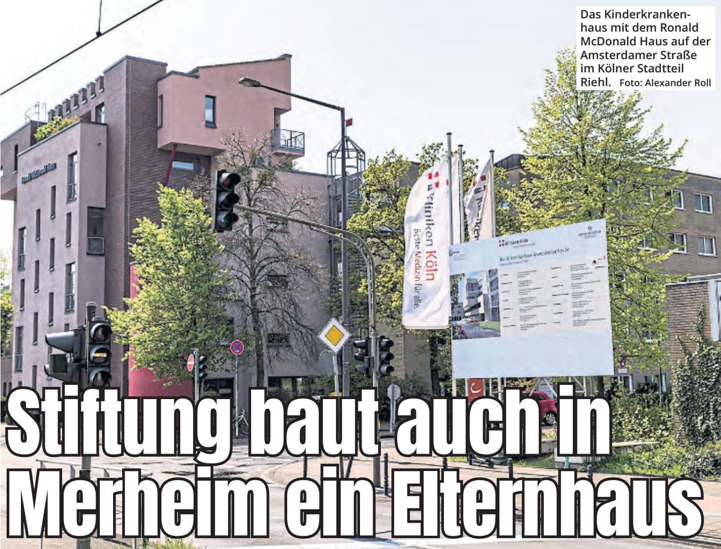
Das Kinderkrankenhaus mit dem Ronald McDonald Haus auf der Amsterdamer Straße im Kölner Stadtteil Riehl.