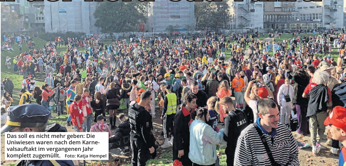
Das soll es nicht mehr geben: Die Uniwiesen waren nach dem Karnevalsauftakt im vergangenen Jahr komplett zugemüllt.

Allerdings ist ein Straßenfest etwas anderes, als wenn tau-