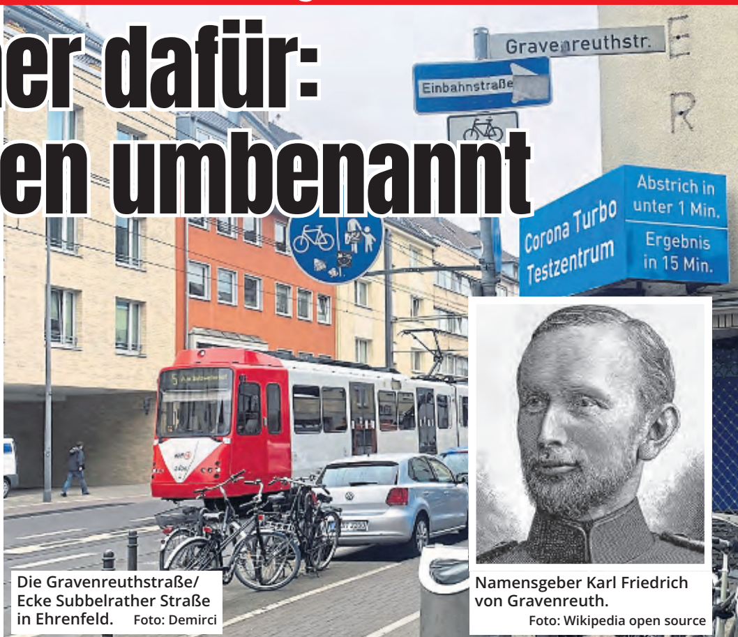
Die Gravenreuthstraße/ Ecke Subbelrather Straße in Ehrenfeld.

Das Gutachten zu Wissmann fasst zusammen, wie der 1853 in Frankfurt/Oder geborene preußische Offizier zu einem der brutalsten Akteure des Kolonialismus in Zentral- und Ostafrika wurde. Zu Köln hatte