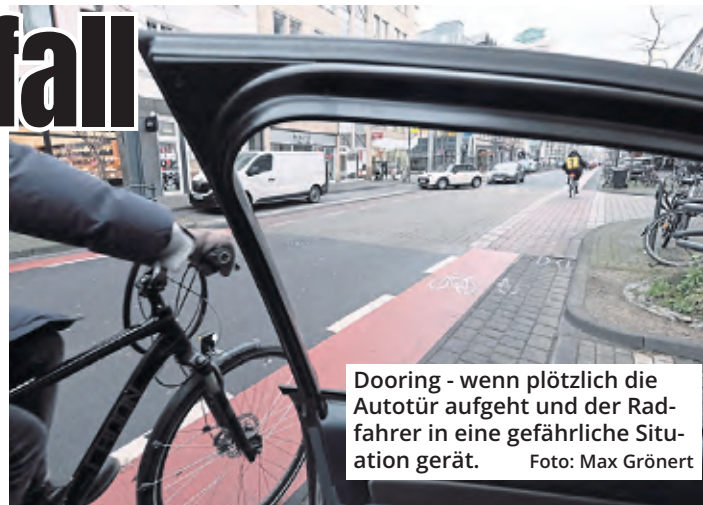
Dooring - wenn plötzlich die Autotür aufgeht und der Radfahrer in eine gefährliche Situation gerät.

Die Radfahrerin trug keinen Helm. Ob ein solcher ihr das Leben gerettet hätte, dazu konnte der Rechtsmediziner keine Aussage treffen, das wäre reine Spekulation. Der Prozess wird im August fortgesetzt.