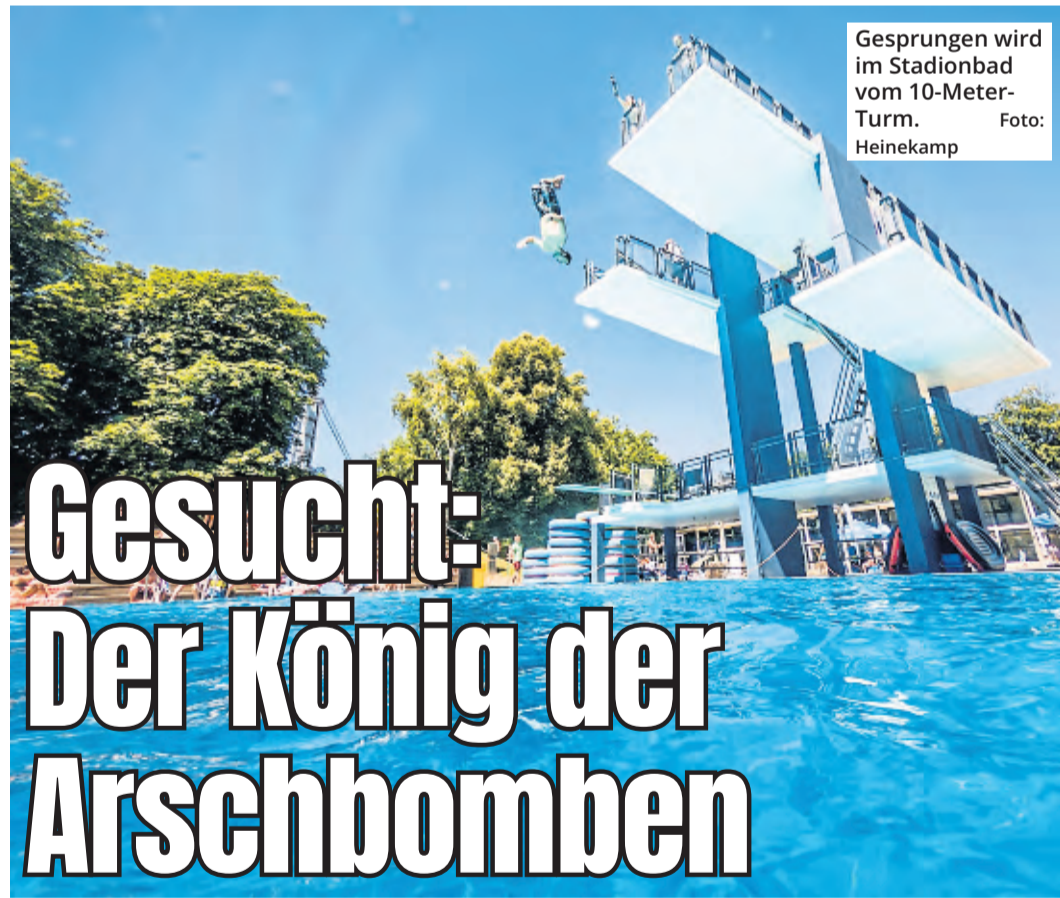
Gesprungen wird im Stadionbad vom 10-Meter-Turm.