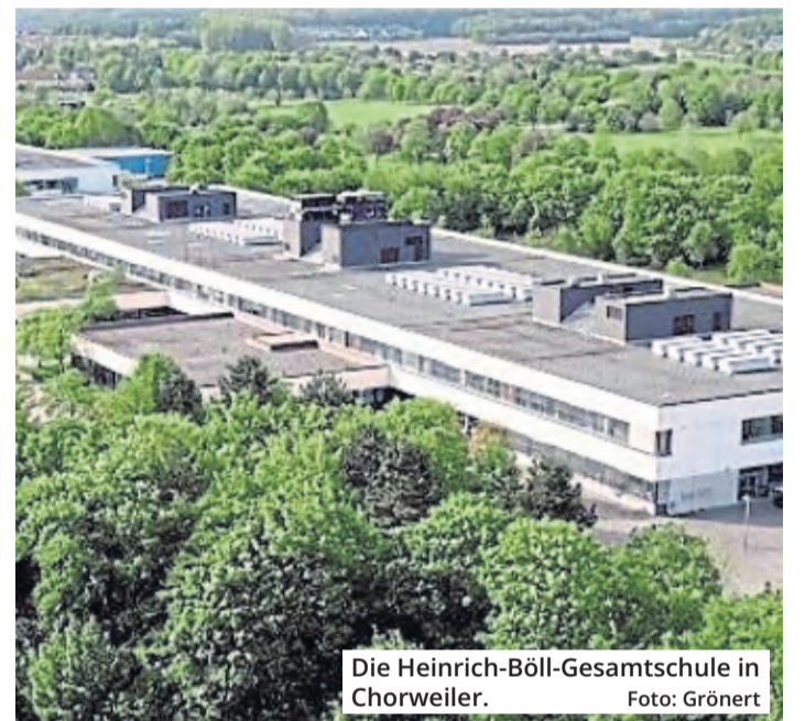
Die Heinrich-Böll-Gesamtschule in Chorweiler.

Die Stadt schätzt die Baukosten derzeit auf 691 Millionen Euro. Für die Heinrich-Böll-Gesamtschule (1974 gebaut) läuft es auf einen Abbau des Gebäudes hinaus. Für die Gesamtschule Holweide und das Kaiserin-Theophanugymnasium ist noch offen, ob eine Sanierung der nicht denkmalgeschützten Gebäude oder ein Abbruch mit anschließendem Neubau wirtschaftlicher ist.