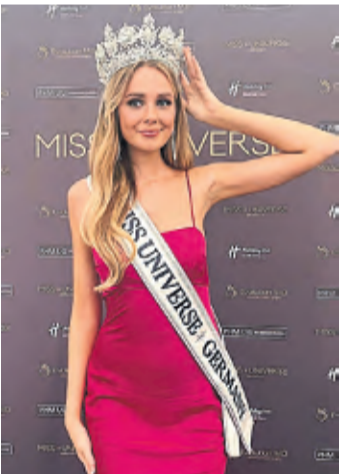
Die Kölnerin konnte ihr Glück nach der Bekanntgabe kaum fassen.

Köln. Dafür muss die jecke Kölnerin einmal mehr auf die Feierlichkeiten am 11.11. verzichten, da die Vorbereitungen auf die Wahl zur Miss Universe schon Wochen vor dem eigentlichen Abend der Entscheidung beginnen. „Normalerweise dauert die Wahl zur Miss Universe zwei bis drei Wochen, das wird in diesem Jahr mit Sicherheit ähnlich sein“, erklärt Helena im Gespräch mit Express - Die Woche. „Die genauen Daten stehen aber noch nicht fest, vermutlich bin ich erst um Weihnachten herum wieder zu Hause.“