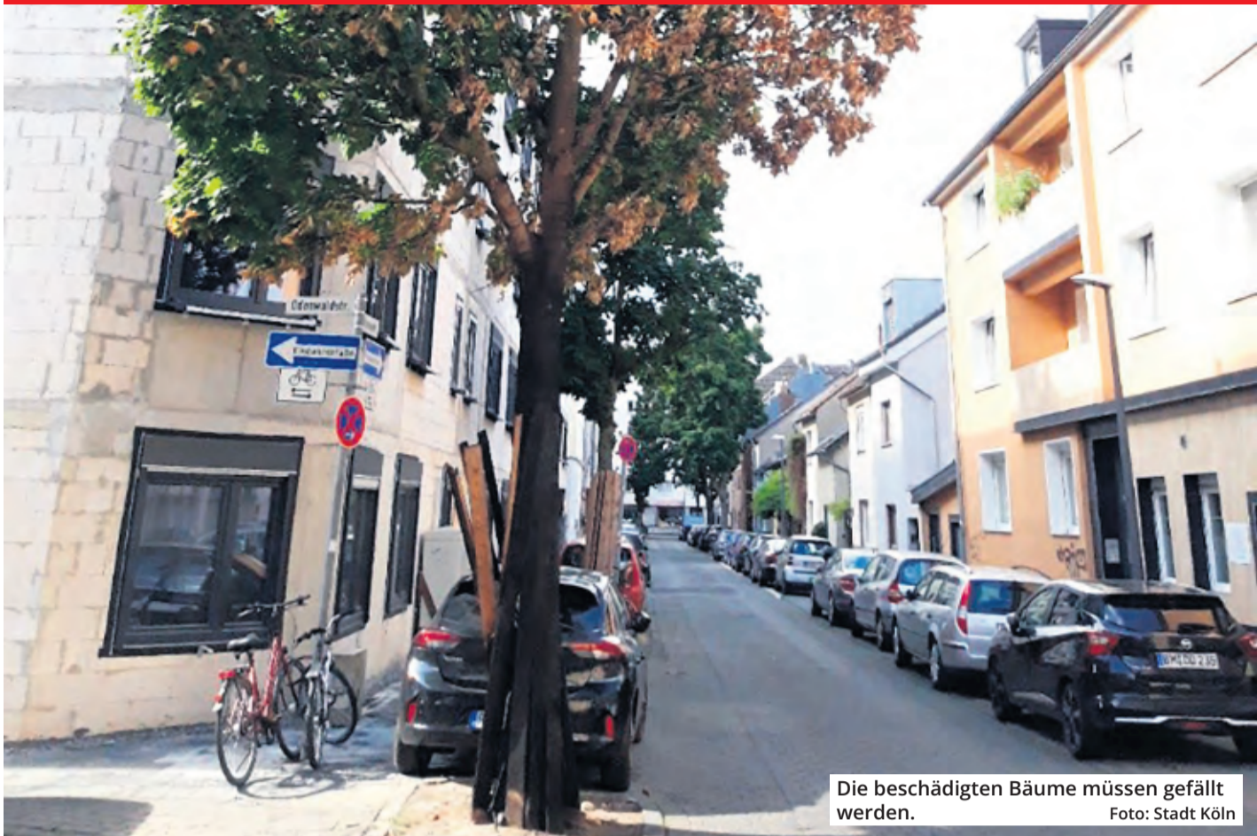
Die beschädigten Bäume müssen gefällt werden.