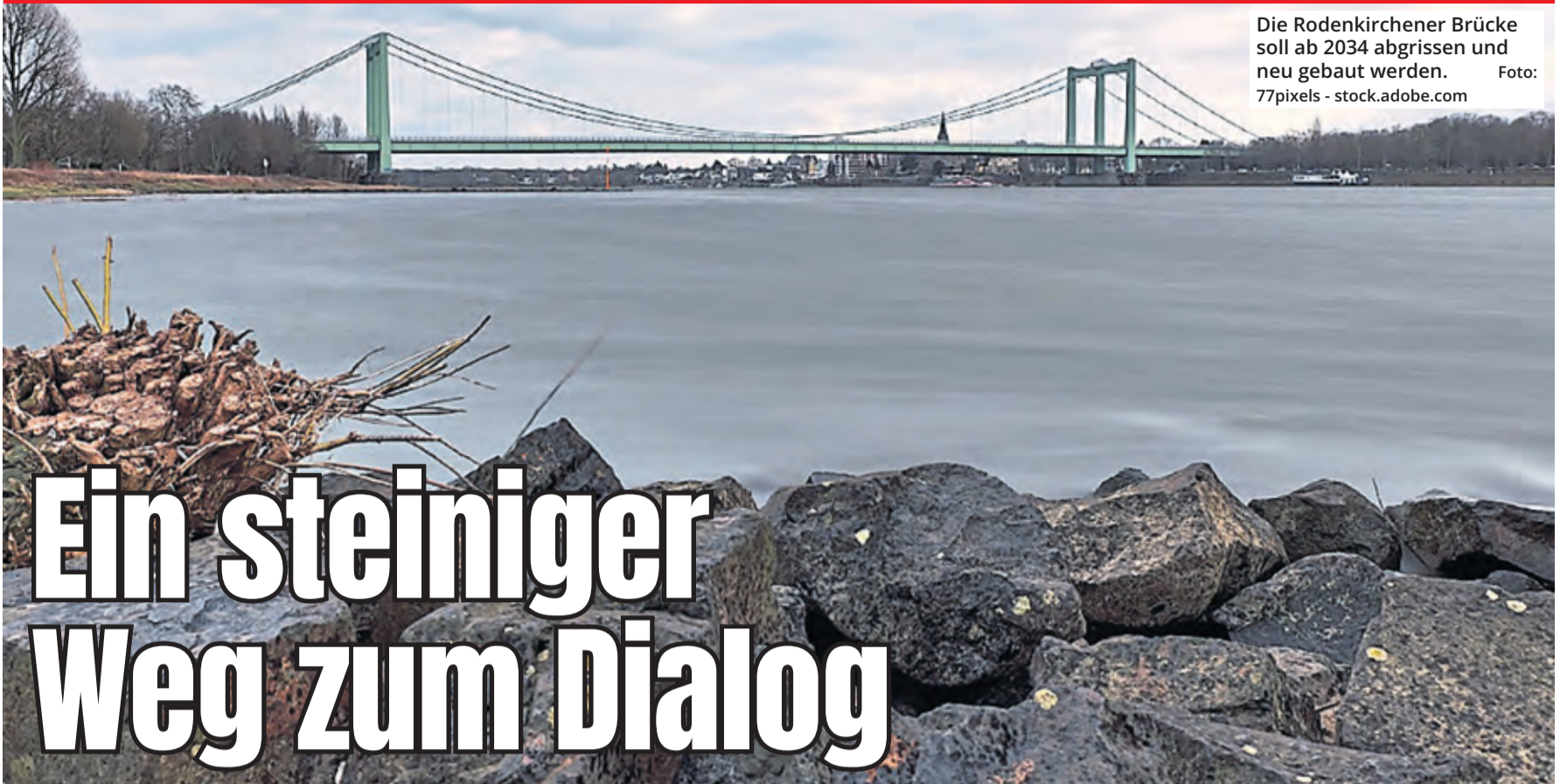
Die Rodenkirchener Brücke soll ab 2034 abgerissen und neu gebaut werden.