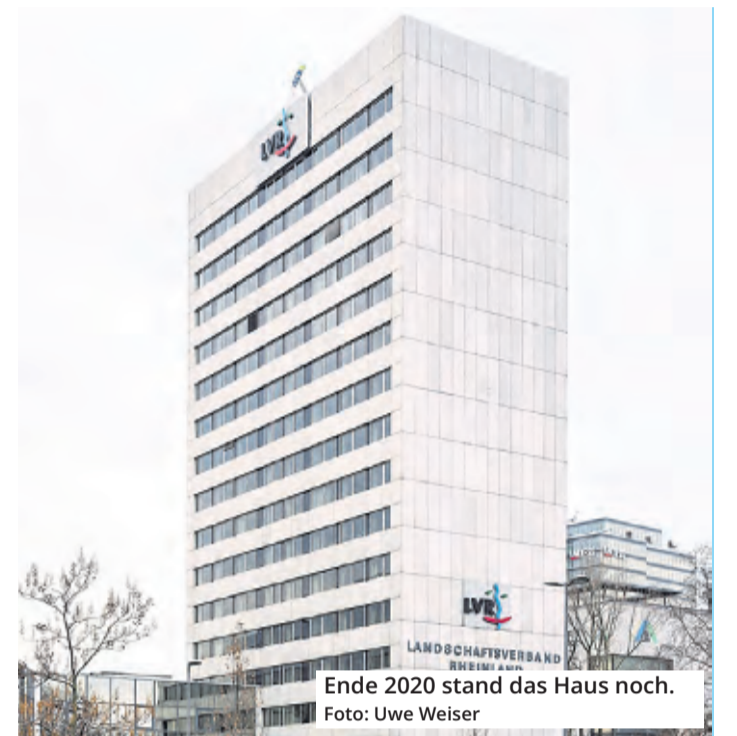
Ende 2020 stand das Haus noch.

Deutz. Das 54 Meter hohe Haus des Landschaftsverbandes Rheinland (LVR) gegenüber des Bahnhofs Messe/Deutz gehört der Vergangenheit an: Mittlerweile ist das Hochhaus am Ottoplatz vollständig abgebrochen worden. Seit dem Jahr 2021 läuft der Rückbau, er sollte eigentlich bis Mitte 2022 abgeschlossen sein, doch es gab Probleme mit der schadstoffbelasteten Fassade. Die Arbeiter mussten sie aufwendig Etage für Etage entfernen. Der Abbruch soll nun bis Juni 2024 beendet sein, dazu gehören auch zwei Tiefgeschosse. Das neue Hochhaus wird 69,5 Meter hoch sein. Nach aktuellem Stand soll das Projekt rund 230 Millionen Euro kosten. Das Gebäude wird vermutlich erst 2027 fertiggestellt sein. Künftig sollen in dem Haus bis zu 1200 Menschen arbeiten. (mhe)