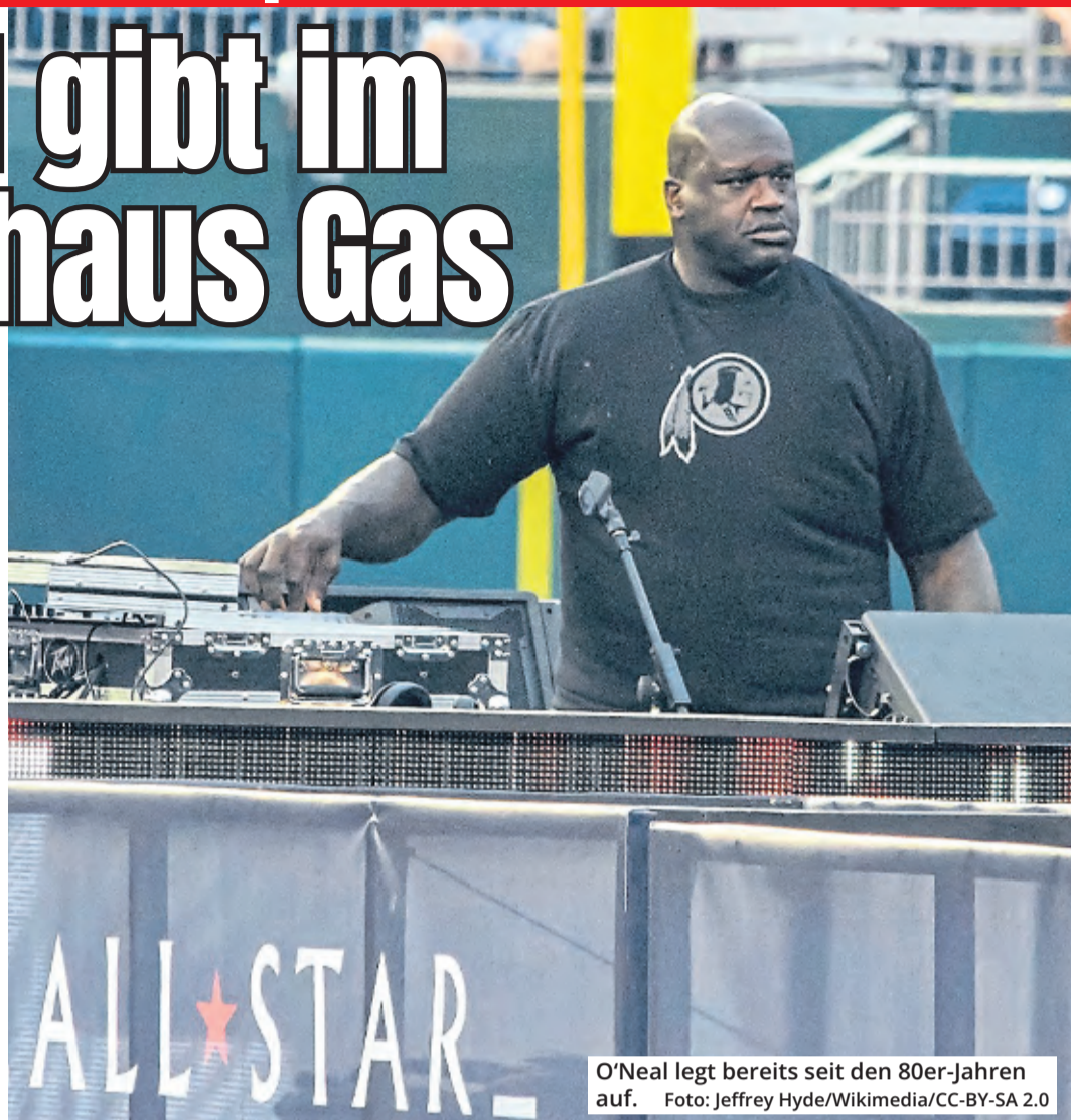
O'Neal legt bereits seit den 80er-Jahren auf.