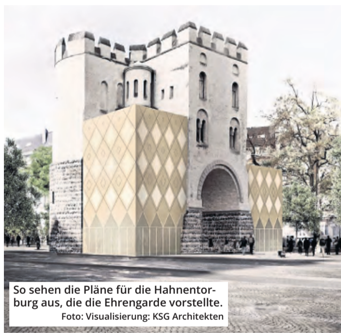
So sehen die Pläne für die Hahnentorburg aus, die die Ehrengarde vorstellte.

Damit endet nach vier Jahren auch die Ungewissheit, was mit der Hahnentorburg passiert und wo sich die Ehrengarde zukünftig trifft. Im Jahr 2019 hatten sich die Karneva-