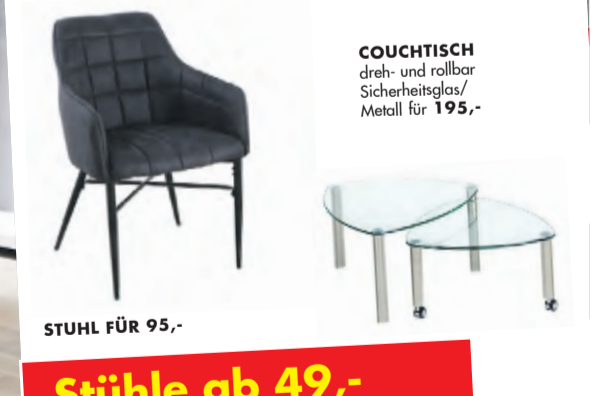
STUHL FÜR 95,-