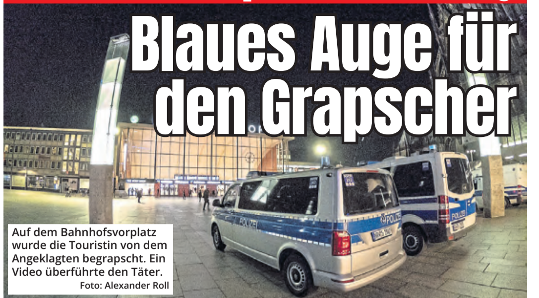
Auf dem Bahnhofsvorplatz wurde die Touristin von dem Angeklagten begripscht. Ein Video überführte den Täter.

Ein gestochen scharfes Video überführte im Amtsgericht einen Grapscher, der vergangenen Juli einer ihm fremden Frau auf dem Bahnhofsvorplatz auf das Gesäß geschlagen hatte. Richterin und Staatsanwältin stellten das Verfahren gegen eine Geldauflage ein. Darüber zeigte sich der Angeklagte selbst überrascht.