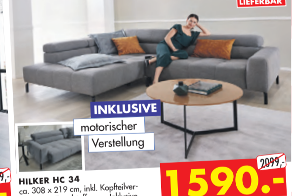
HILKER HC 34 ca. 308 x 219 cm, inkl. Kopfteilverstellung in Trendstoff grau. Inklusive Sitzvzuzug.