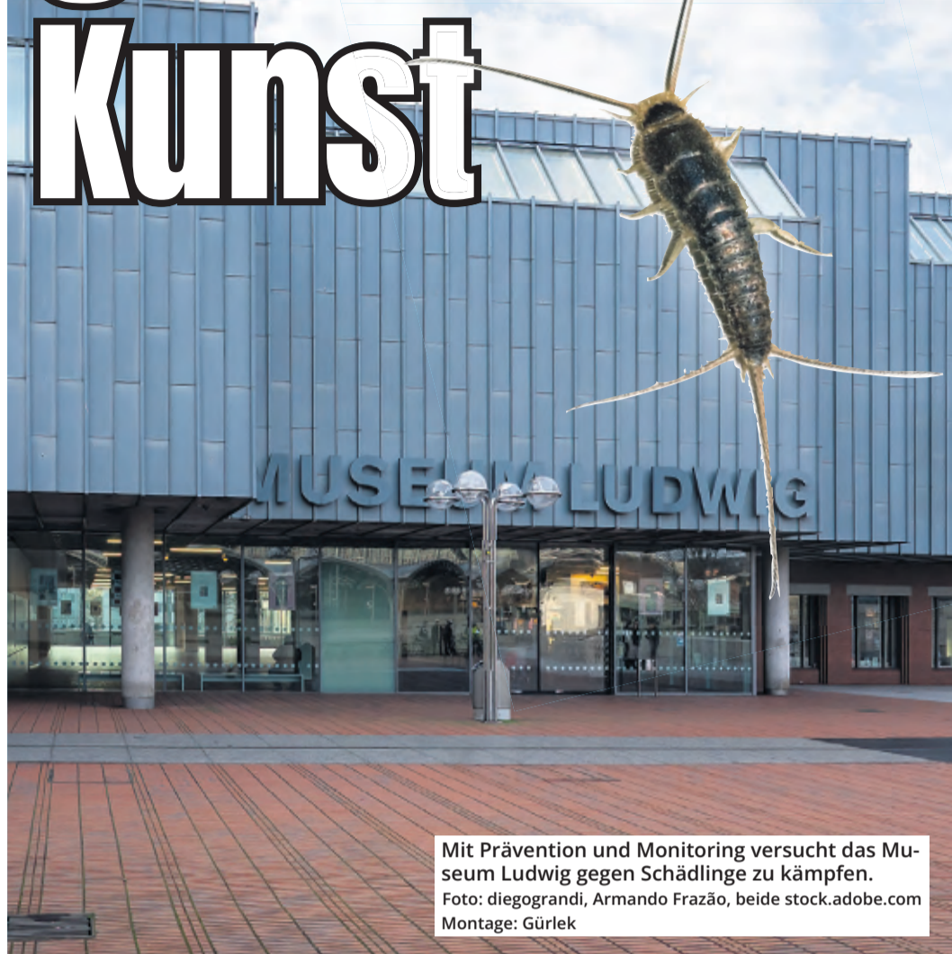
Mit Prävention und Monitoring versucht das Museum Ludwig gegen Schädlinge zu kämpfen.

Früher habe man schwere Geschütze aufgeföhren, um die Kunst vor den Schädlingen zu sichern. Da wurden dann etwa Rahmen mit giftigem Holzschutzmittel bepinselt. Aber „mit diesen Objekten kann man ohne Vollkörperschutz nicht mehr arbeiten“, so Garborini. Die Schadstoffbelastung sei zu groß. Um dem entgegenzuwirken sei heute ein genaues und individuelles Monitoring wichtig: „Was für Schädlinge habe ich? Wo habe ich die? Was sind die Ursachen?“ Natürlich sei aber auch die Reinigung ein großes Thema, dafür gebe es im Museum ein gesondertes „deep-cleaning“ Team. Trotz wärmerer Sonnenstrahlen, die vom Kölner Dom direkt in das Büro der Restauratorin fallen, bleiben die Räume im Museum ganzjährig kühl – es ist immer etwa „19 Grad bei einer Luftfeuchtigkeit von 55 Prozent“, erklärt sie. Zum Schutz der Kunst sei es extrem wichtig, dass die Klimawerte stabil