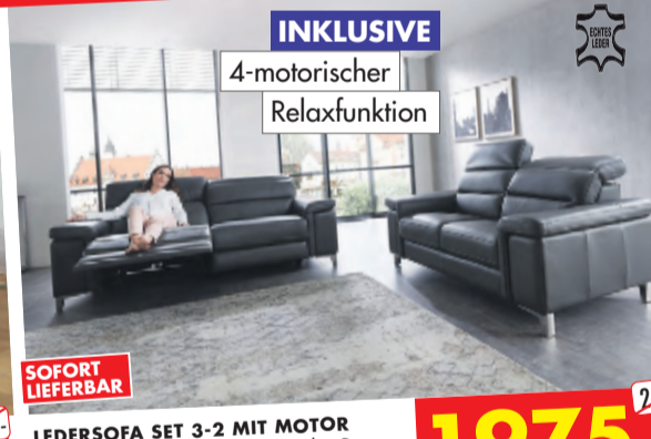
LEDERSOFA SET 3-2 MIT MOTOR 3-Sitzer ca 220 cm breit mit motorischer Relax- und Kopfteilfunktion und 2-Sitzer ca 174 cm breit.