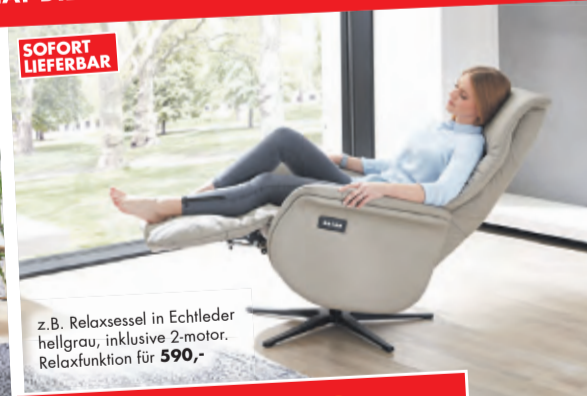
z.B. Relaxsessel in Echtleder hellgrau, inklusive 2-motor. Relaxfunktion für 590,-