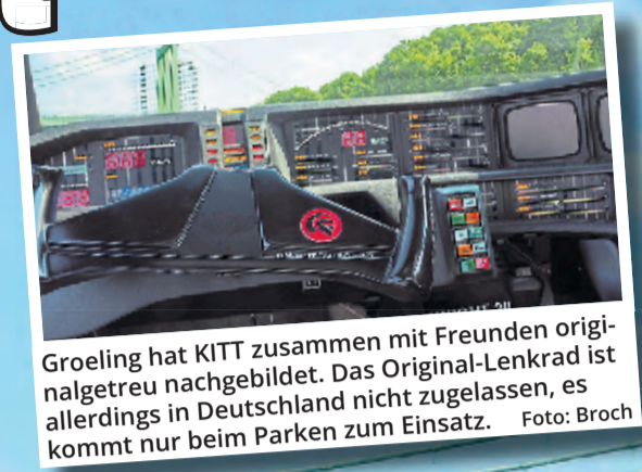
Groeling hat KITT zusammen mit Freunden originalgetreu nachgebildet. Das Original-Lenkrad ist allerdings in Deutschland nicht zugelassen, es kommt nur beim Parken zum Einsatz.