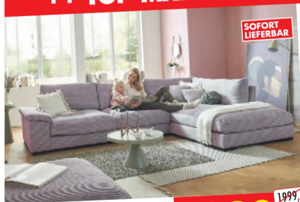
ECKSOFA in Trendstoff Cord, ca. 333 x 223 cm in Cord rose.

++ TOP-MARKEN RADIKAL REDUZIERT +++ BIS ZU 70% REDUZIERT ++