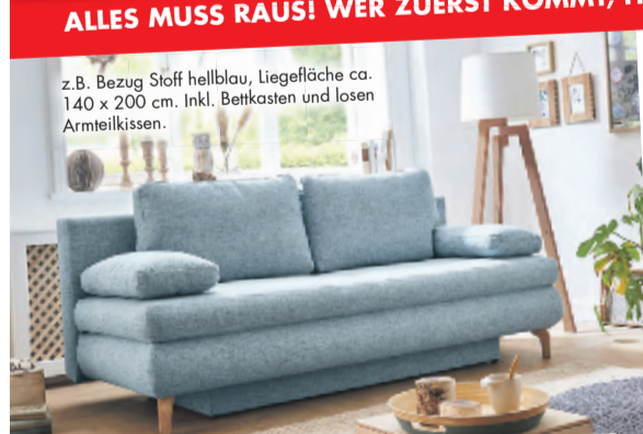
z.B. Bezug Stoff hellblau, Liegefläche ca. 140 x 200 cm. Inkl. Bettkasten und losen Armeilkissen.