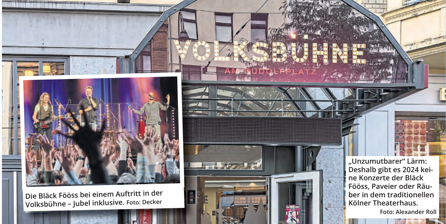
Die Bläck Fööss bei einem Auftritt in der Volksbühne – Jubel inklusive.

Schuld daran sind nicht die Bands oder deren Teams, ganz im Gegenteil, wie Axel Molinski betont: „Sie alle sind unglaublich diszipliniert mit den Einschränkungen umgegangen. Das Problem sind die Beifallskundgebungen und das Mit-