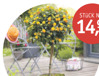
WANDELRÖSCHEN-STÄMMCHEN Lantana | Topf-Ø 19 cm | ohne Übertopf

*Angebote gültig bis 11.05.2023, solange Vorrat reicht.