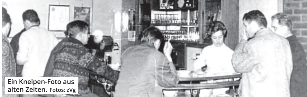
Ein Kneipen-Foto aus alten Zeiten.

Die Kneipe ums Eck war früher eine Mischung aus Feierabendvergnügen, Vereinsheim, Geschäftsbüro und Seelsorgebereich zugleich. In ihrem neuen Buch „Altes von der Theke“ lassen Agnes Esser und René Jäger eine alte Zeit wieder lebendig werden.