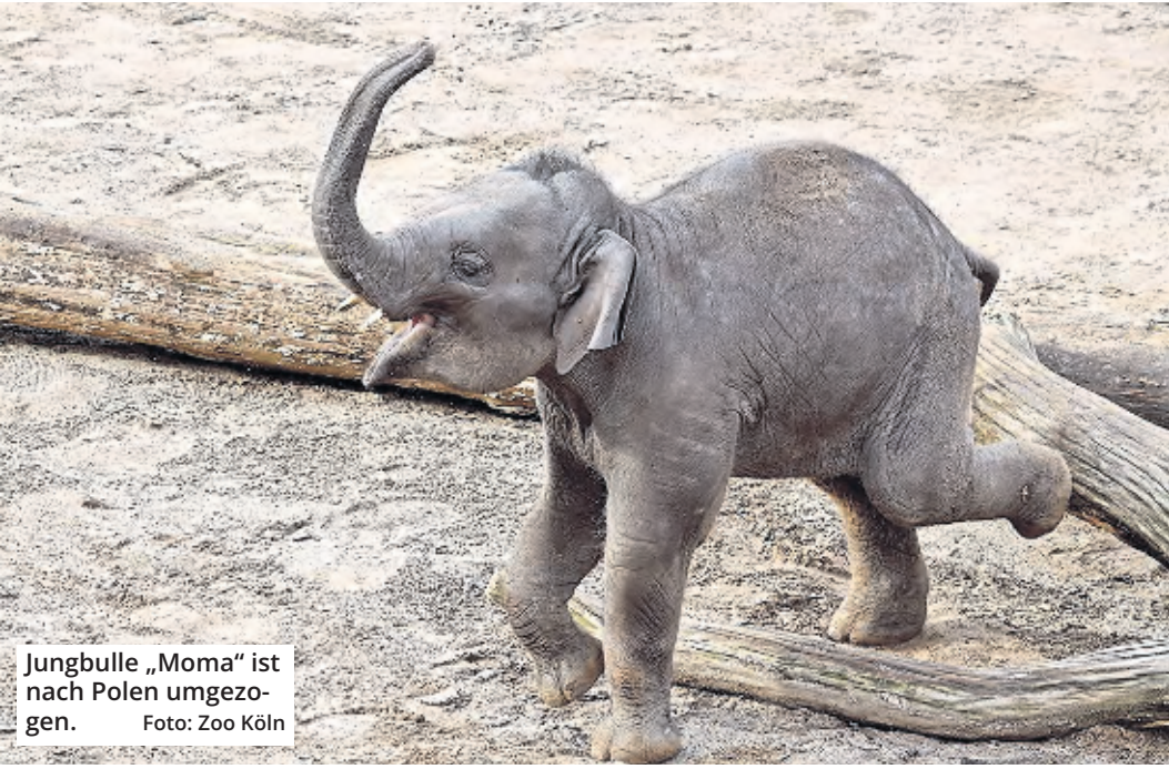
Jungbulle „Moma“ ist nach Polen umgezogen.

Zwei der Kölner Tierpfleger reisten mit „Moma“ und blieben zur Eingewöhnung die ersten Tage auch mit im neuen Zoo in Plock. Mit dem Abschied ging auch die Trennung zweier Freunde einher: Denn „Moma“ verbrachte seine Zeit am liebsten mit Kumpel „Tarak“, der aus dem Zoo Heidelberg nach Köln kam. Und auch einigen Menschen wird „Moma“ fehlen. „Gute Reise kleiner ‚Moma‘. Mein Herz tut weh, aber ich weiß ja, dass es sein muss“, schrieb eine Kölnerin auf der Facebook-Seite des Kölner Zoos.