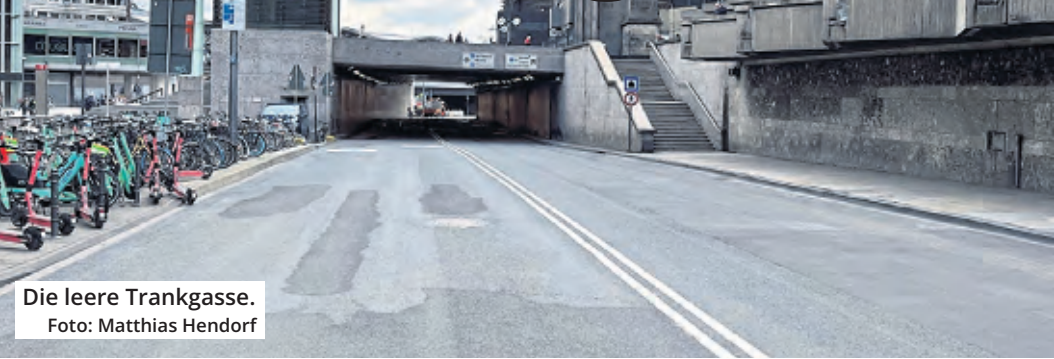
Die leere Trankgasse.