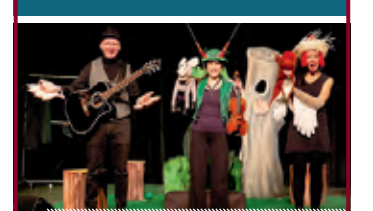
„Remmidemmi unter Baum Nummer 5“ Kindertheater ab 3 Jahren Di., 09. Mai 2023, 10:30 Uhr und 16:30 Uhr