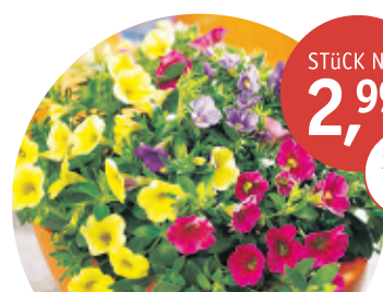
ZAUBERGLÖCKCHEN Calibrachoa | 3 Farben in einem Topf | Topf-Ø 13 cm | ohne Übertopf

Seeberger Pflanzenhof e.K. Oranjerhofstraße 20 · Köln-Seeberg · Telefon: 0221/709310