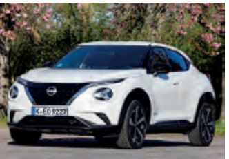
Der Juke fällt durch sein Design auf