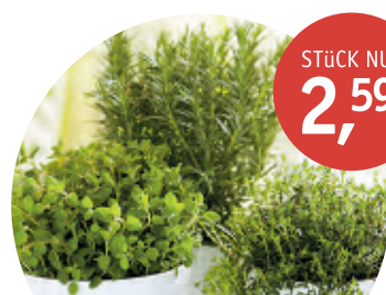
KRÄUTER aus der Region | über 50 versch. Sorten | Topf-Ø 12 cm | ohne Übertopf