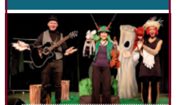
„Remmidemmi unter Baum Nummer 5“ Kindertheater ab 3 Jahren Di., 09. Mai 2023, 10:30 Uhr und 16:30 Uhr