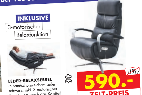
LEDER-RELAXSESSEL in handschuhweichem Leder schwarz, inkl. 3-motorischer Verstellung, auch das Kopfteil ist motorisch einstellbar.