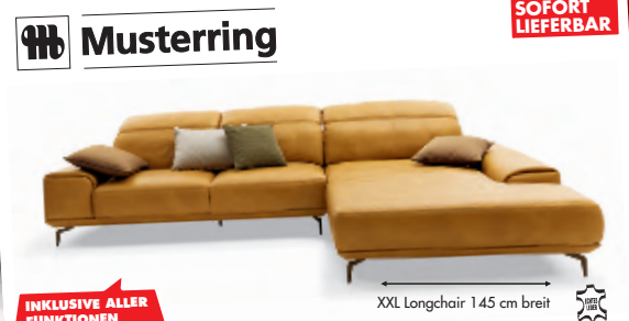
INCLUSIVE ALLER FUNKTIONEN