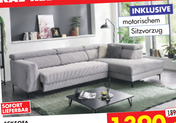
ECKSOFA ca. 293 x 201 cm, inklusive motorischem Sitzvorrug in Trendstoff Cord grau.