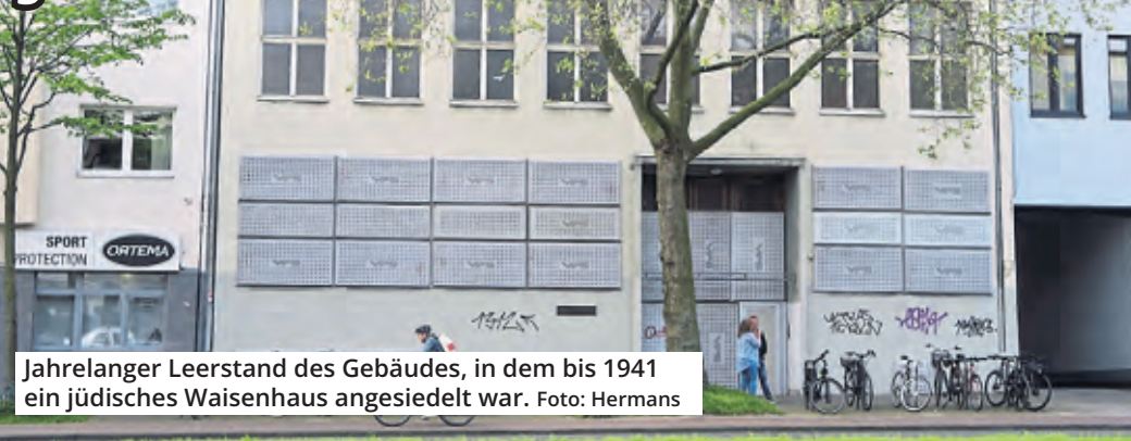
Jahrelanger Leerstand des Gebäudes, in dem bis 1941 ein jüdisches Waisenhaus angesiedelt war.

Der Altbau an der Aachener Straße 443 steht unbewohnt da. Künftig, so die Idee, soll das Haus als Wohn- und Begegnungsstätte genutzt werden. Allerdings hat das Gebäude eine erschütternde Vergangenheit. Bis 1941 war es ein jüdisches Waisenhaus.