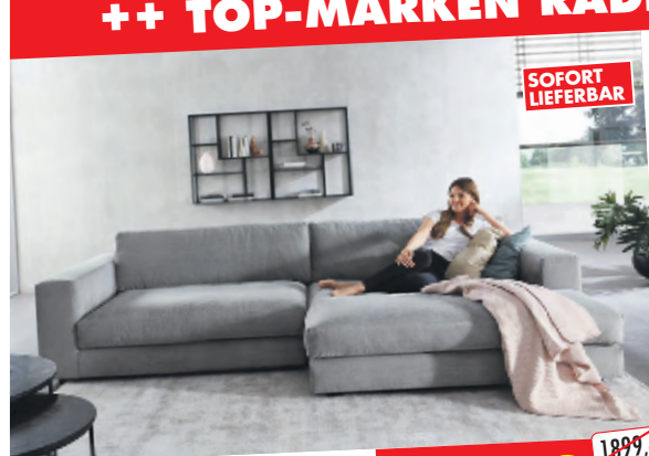
ECKSOFA ca. 295 x 170 cm in trendigem Cordstoff grau, Rücken Spannstoff.

++ TOP-MARKEN RADIKAL REDUZIERT +++ BIS ZU 70 % REDUZIERT ++