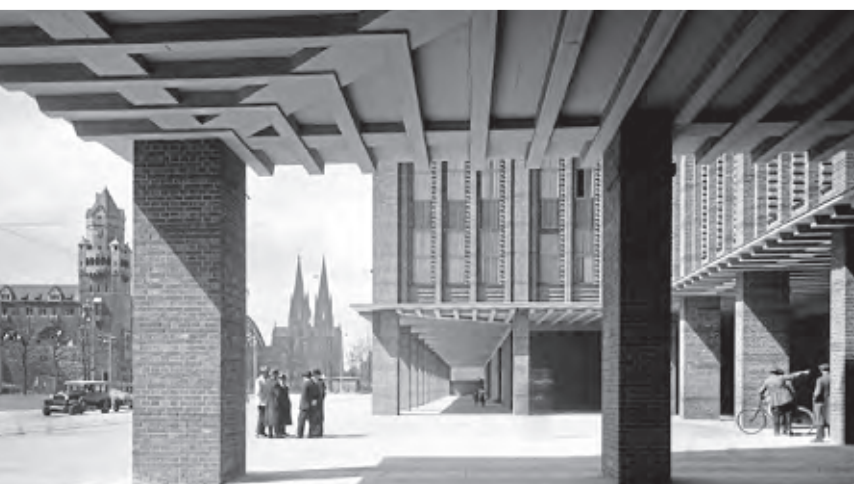
Unten: Die neuen Rheinhallen der Köl- ner Messe, 1928 fotografiert von Hugo Schmölz. Zu heute ist fast kein Unterschied erkennbar.