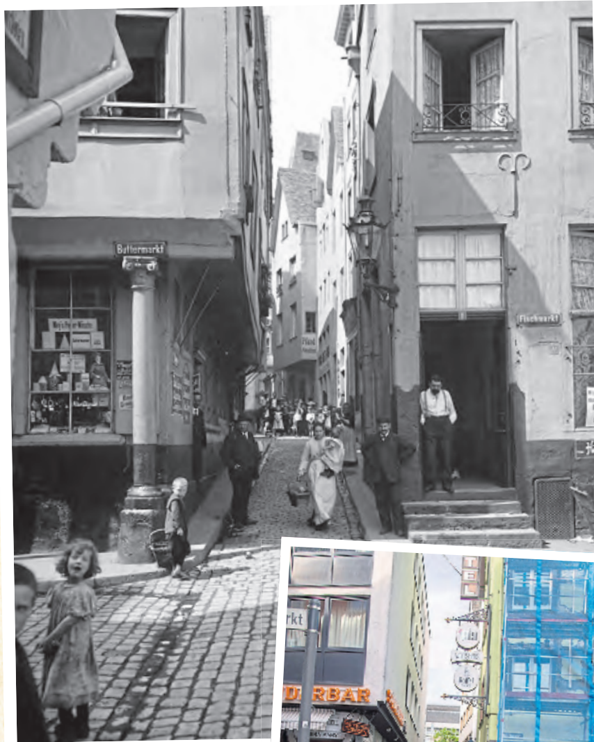
Oben: Eine Straßenszene in der Altstadt an der Ecke Lintgasse/Butter- markt, festgehalten 1904 von Peter Geus. Die Gasse selbst blieb im Wesentlichen erhalten.