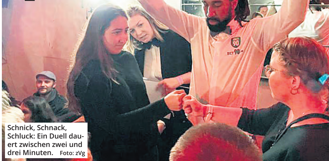
Schnick, Schnack, Schluck: Ein Duell dauert zwischen zwei und drei Minuten.

„Schnick, Schnack, Schluck“ ist Kölner Kneipensport vom Feinsten. Das bekannte Kinderspiel Stein, Papier, Schere tourt seit 2013 als Welt-Cup durch die Domstadt und ist eine Riesengaudi für alle.