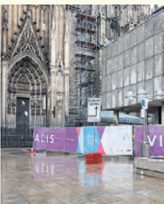
Anders als ursprünglich geplant besteht die Umleitung noch länger.

saniert werden muss. Die Verewaltung geht derzeit von einem Fertigstellungstermin Ende Juni aus