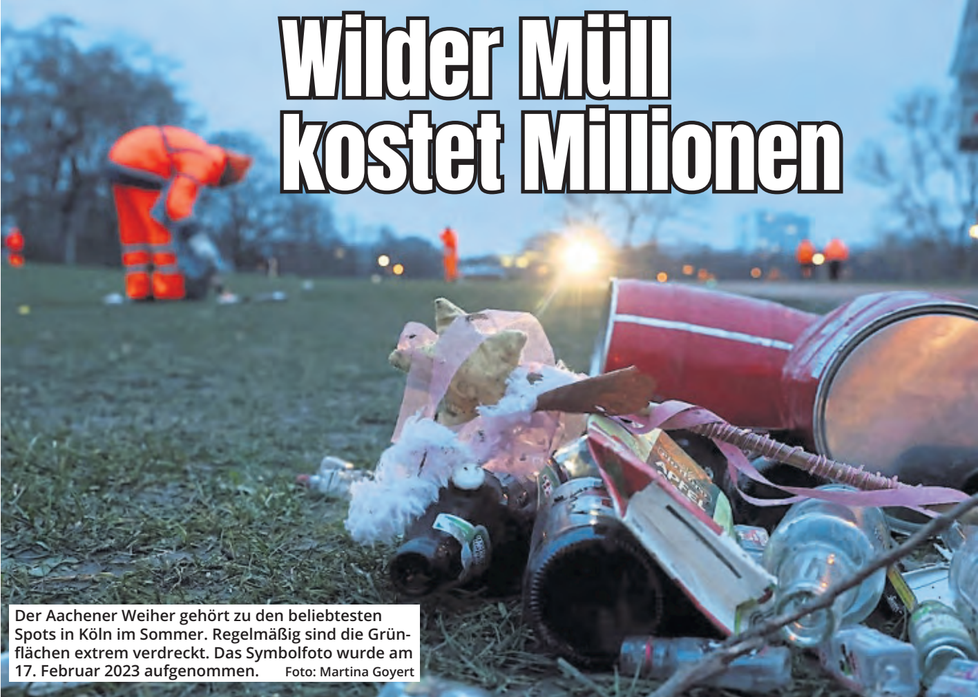
Der Aachener Weiher gehört zu den beliebtesten Spots in Köln im Sommer. Regelmäßig sind die Grünflächen extrem verreckt. Das Symbolfoto wurde am 17. Februar 2023 aufgenommen.

Die Zigarettenkippe wegschnippen, den Pizzakarton auf der Parkbank liegen lassen oder die leere Getränkedose achtlos ins Gebüsch werfen – das nennt man „Littering“. Köln. Diesen wilden Müll möchten die Stadt Köln und die Abfallwirtschaftsbetriebe (AWB) nicht länger tatenlos hinnehmen und starten jetzt eine Littering-Kampagne. Damit nicht genug: An sommerlichen Wochenenden sind die „Grill-Scouts“ der AWB in Grünanlagen unterwegs, um