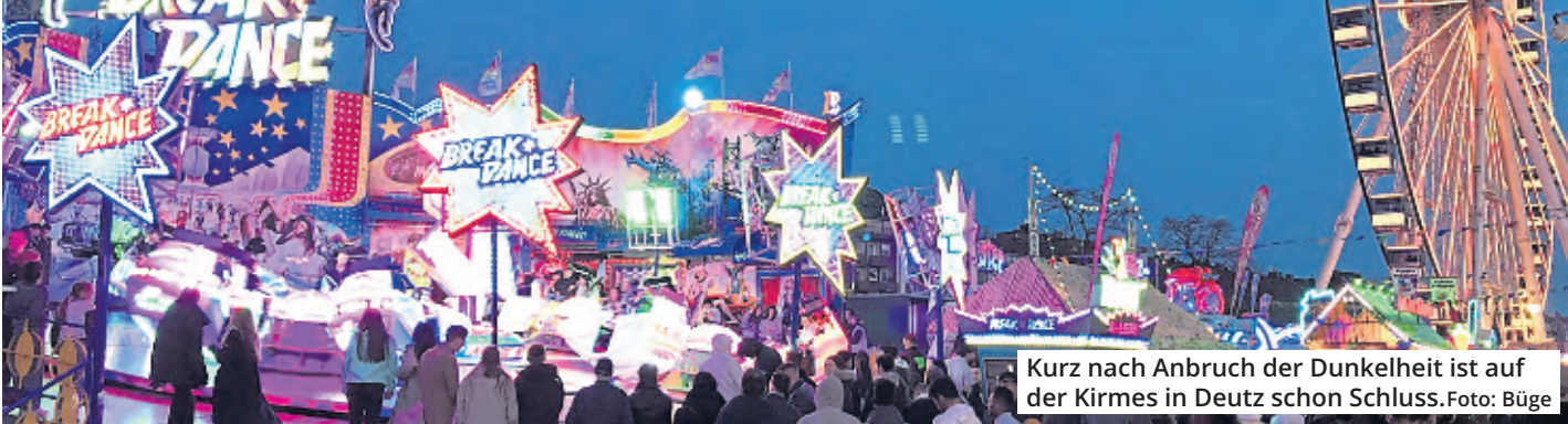
Kurz nach Anbruch der Dunkelheit ist auf der Kirmes in Deutz schon Schluss.

Die kürzteste Kölner Kirmes der letzten Jahre geht am Sonntag zu Ende. Nur neun Tage lang fand das Frühlingsvolksfest in Deutz statt. Die Schausteller fordern nun Konsequenzen, Kirmesgänger reagieren mit Unverständnis auf die Vorgaben der Stadtverwaltung.