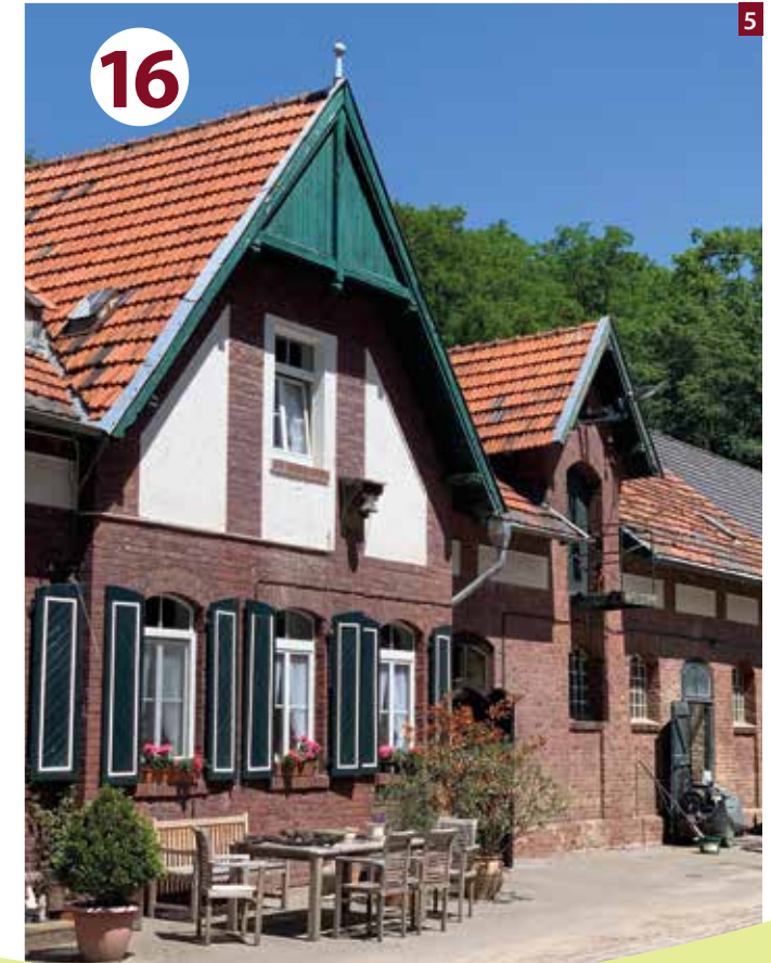
druckerei staedteregion aachen/A_58/Feierabendrunde 03.22 Text und Fotos: Bertina Kreisel, Karte: Paul Dunkel