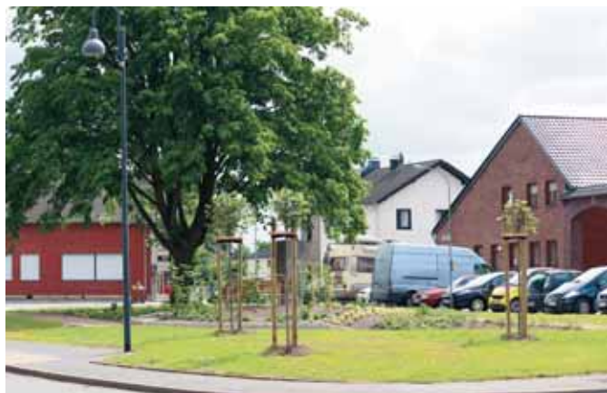
Die Mitglieder des Bauausschusses sowie Verwaltungsvertreter bei der Inauguration des Dorfplatzes.

Auch wurde im Zusammenhang mit der Umgestaltung des Dorfplatzes am benachbarten ehemaligen Schulgebäude eine attraktive Sitzgelegenheit geschaffen, die immer wieder von zahlreichen Senioren aufgesucht wird.