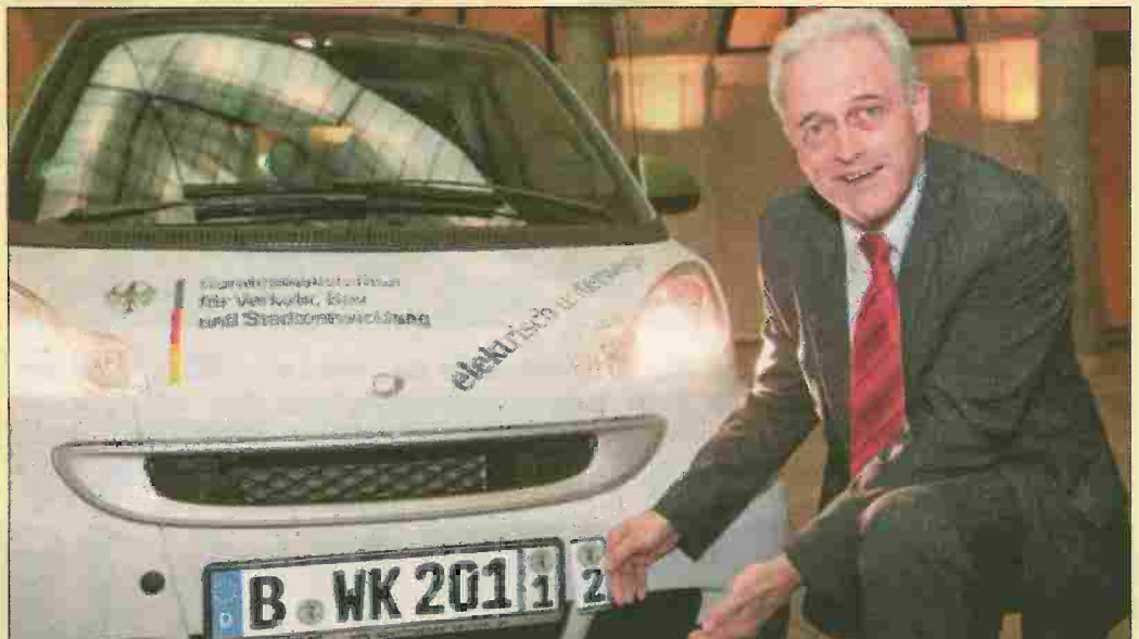
Bundesverkehrsminister Peter Ramsauer mit Wechselkennzeichen.

Nach Österreich und der Schweiz gibt es ab 1. Juli 2012 auch in Deutschland das Wechselkennzeichen. Damit können künftig zwei Fahrzeuge derselben Fahrzeugklasse wechselseitig und saisonunabhängig mit nur einem Nummernschild zugelassen werden. Die EU unterscheidet zwischen den Klassen Autos, Oldtimer und Wohnmobile (M1), Motorräder, Leichtkrafträder, Trikes und Quads (L) sowie Anhänger (01). Damit können Fahrzeuge, die sonst mit Saisonkennzeichen unterwegs waren, jetzt auch außerhalb der vorgegebenen Zeit gefahren werden. Eine Nutzung untereinander - beispielsweise für ein Auto und ein Motorrad - ist