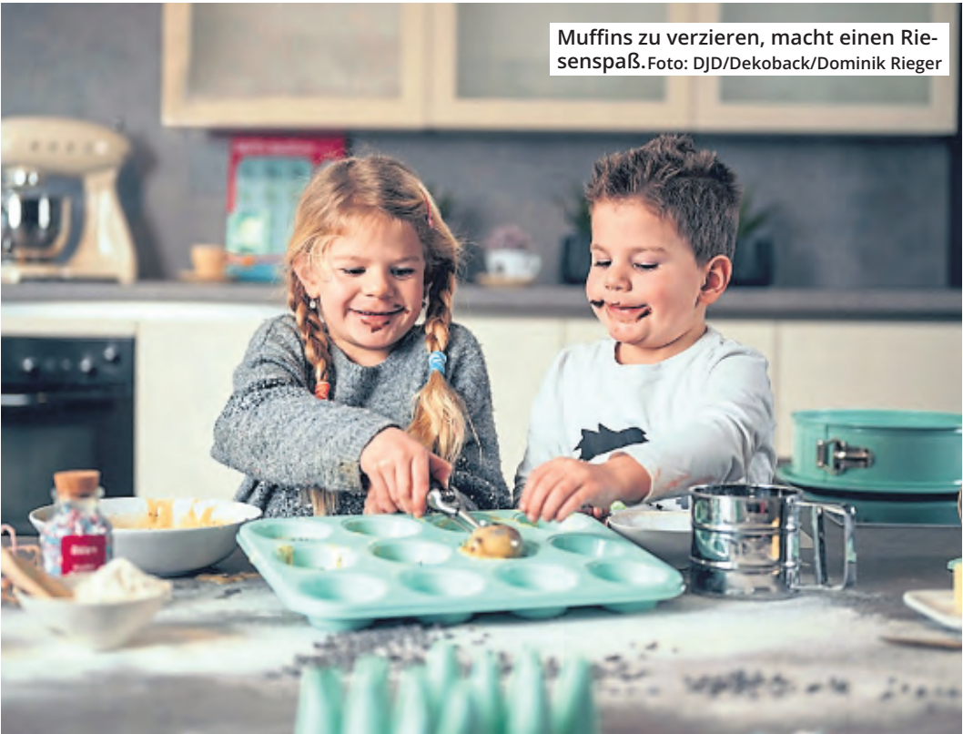
Muffins zu verzieren, macht einen Riesenspaß.

Gleichzeitig gelte es für die Bürger in Köln, illegale Rennen und Ähnliches zu melden. „Stellen die Kölnerinnen und Kölner ‚Raserverhalten‘ beziehungsweise ein verbotenes Kraftfahrzeugrennen fest, sollten sie die 110 anrufen und ihre Feststellungen mitteilen.“ Raser sollten sich laut Polizei also darüber im Klaren sein, dass die Bereitschaft anderer Verkehrsteilnehmender hoch ist, verkehrswidriges Verhalten anzuzeigen.