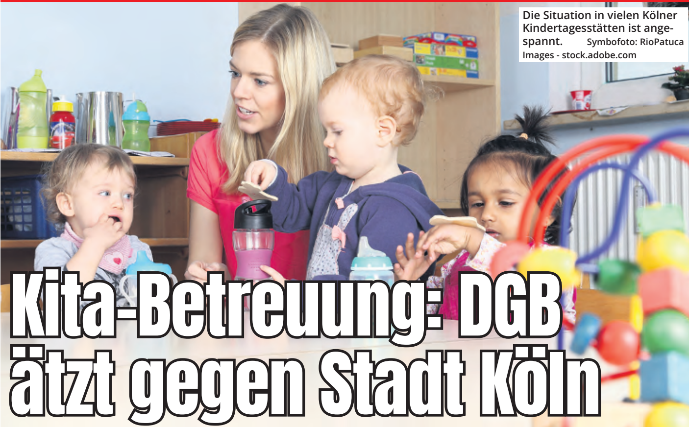
Die Situation in vielen Kölner Kindertagesstätten ist angespannt.