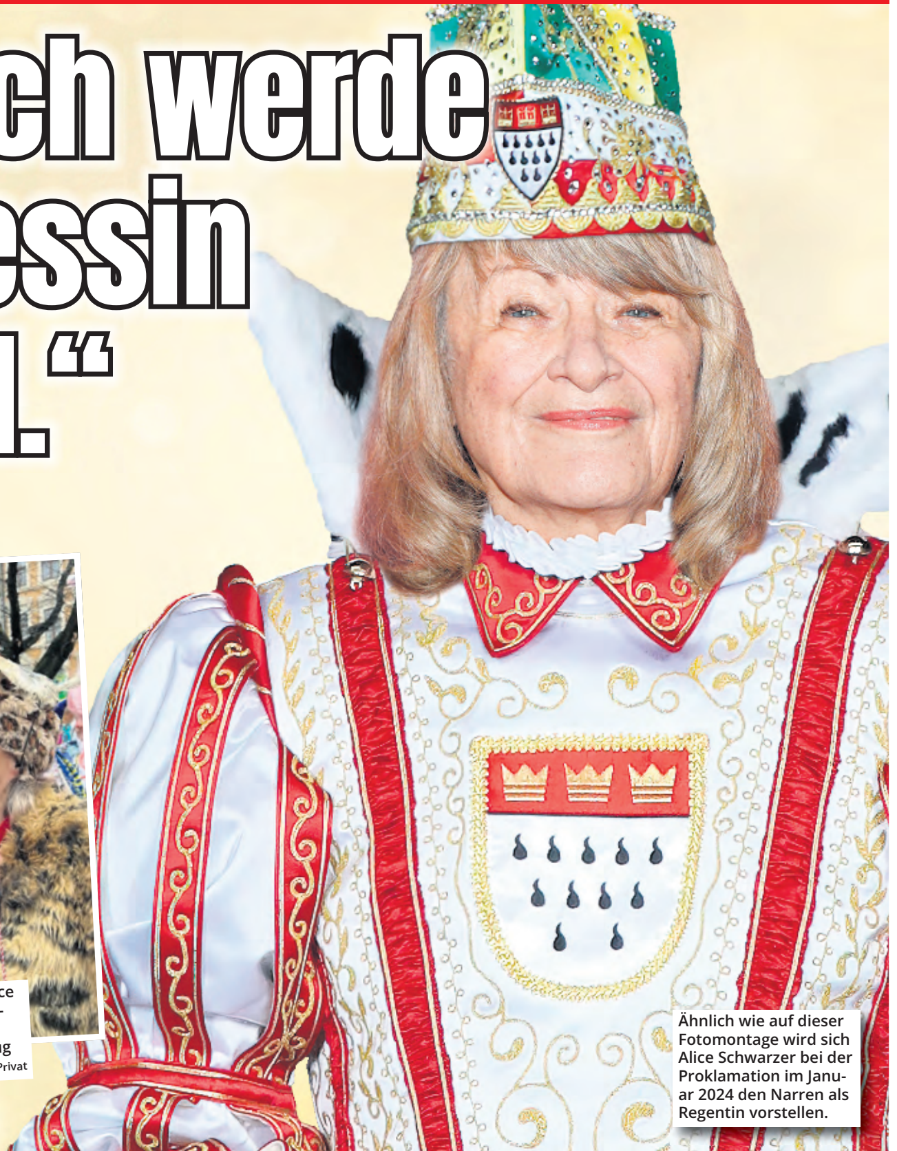
Ähnlich wie auf dieser Fotomontage wird sich Alice Schwarzer bei der Proklamation im Januar 2024 den Narren als Regentin vorstellen.