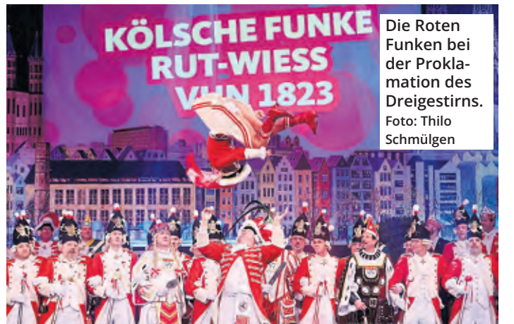
Die Roten Funken bei der Proklamation des Dreigestirns.

Ticketkäufer, die bereits eine Karte erworben haben, erhalten das Geld zurück. Sie sollen sich an ihre jeweilige Vorverkaufsstelle wenden.