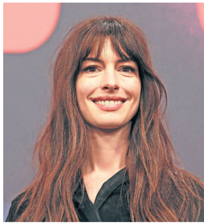
Oscar-Preisträgerin Anne Hathaway, hier auf der Berlinale 2023, kommt für Filmaufnahmen nach Köln.