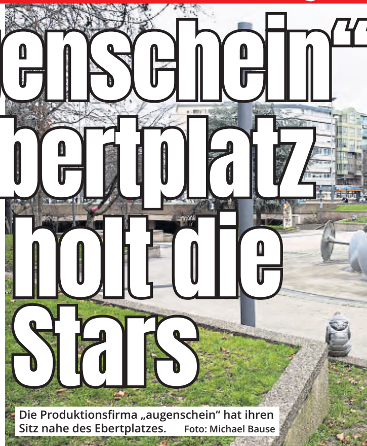
Die Produktionsfirma „augenschein“ hat ihren Sitz nahe des Ebertplatzes.

Jetzt also „Mother Mary“, eine Geschichte um eine fiktive Starmusikerin, die in eine Sinnkrise stürzt (Anne Hathaway, Oscar 2013 für die Beste Nebenrolle in Les Misérables). Die britische Emmy-Gewinnerin Michaela Coel (35, „Wakanda