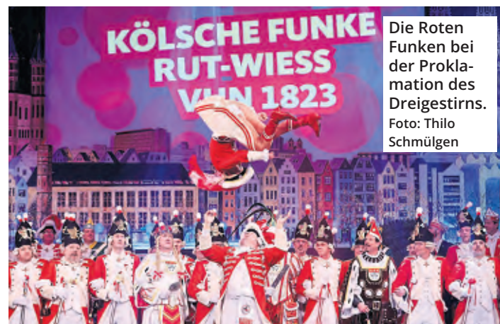
Die Roten Funken bei der Proklamation des Dreigestirns.

Ticketkäufer, die bereits eine Karte erworben haben, erhalten das Geld zurück. Sie sollen sich an ihre jeweilige Vorverkaufsstelle wenden.