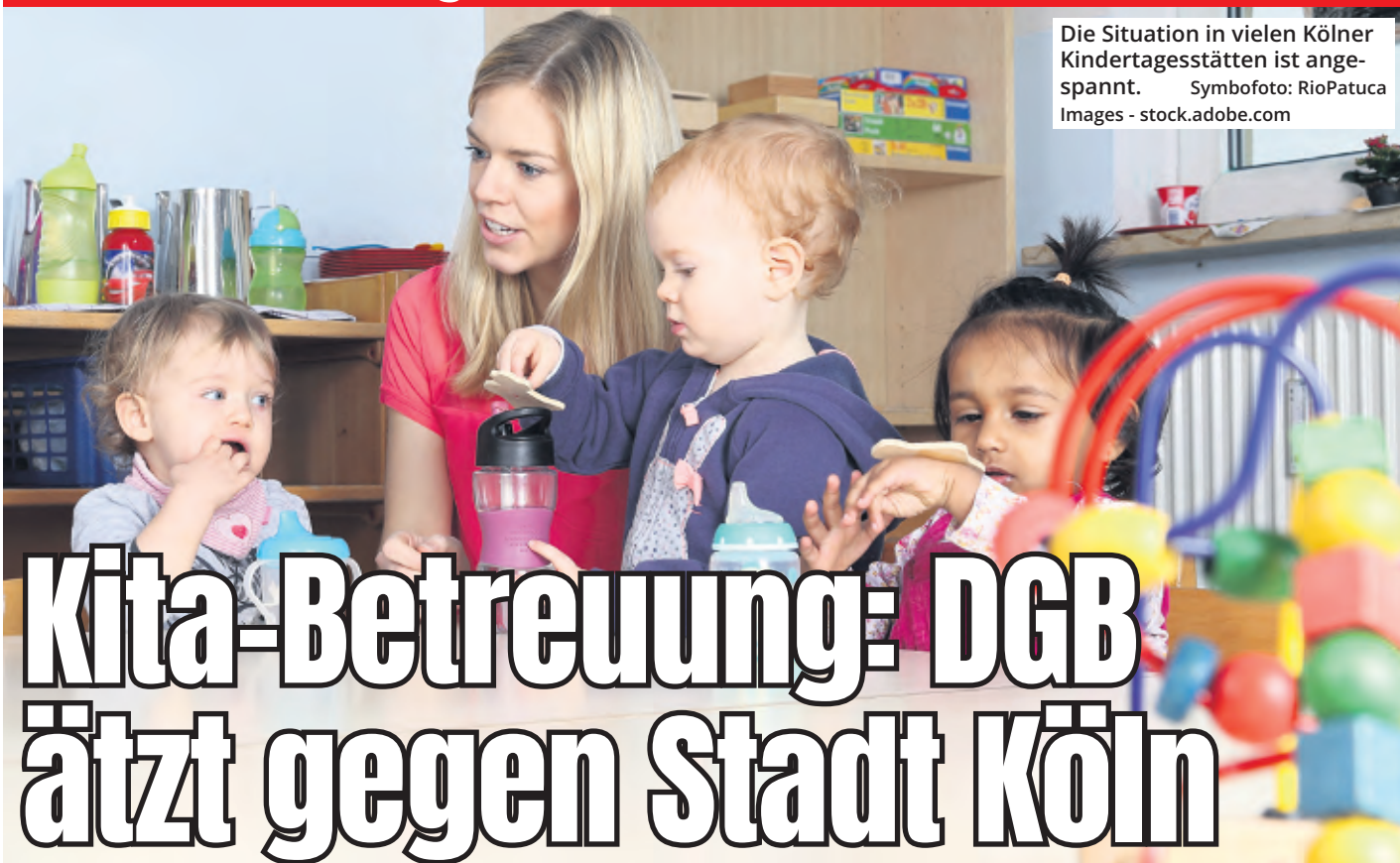
Die Situation in vielen Kölner Kindertagesstätten ist angespannt.