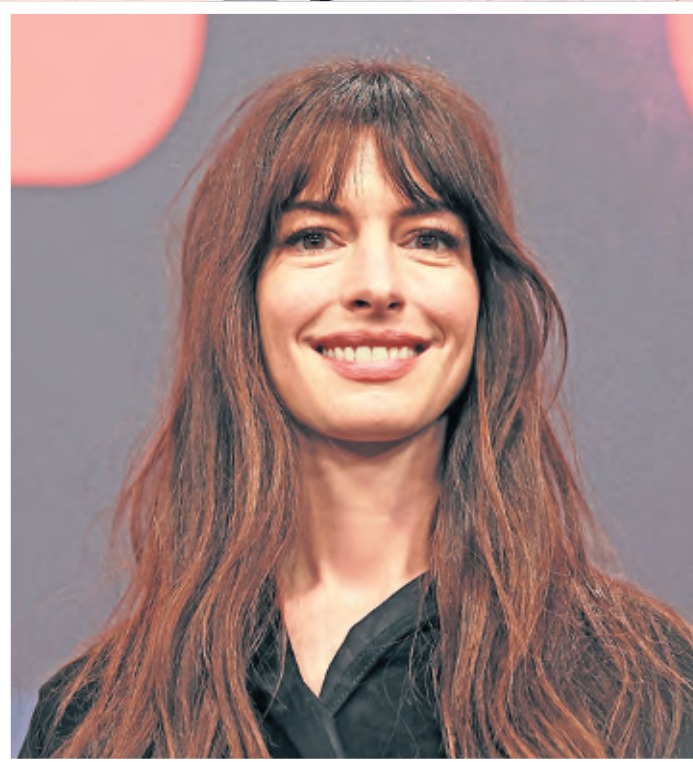
Oscar-Preisträgerin Anne Hathaway, hier auf der Berlinale 2023, kommt für Filmaufnahmen nach Köln.