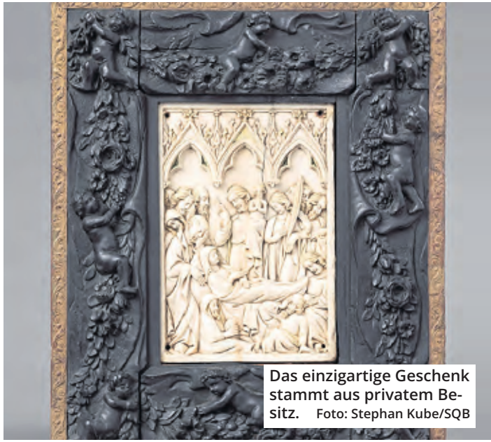
Das einzigartige Geschenk stammt aus privatem Besitz.

Die einzigartige Darstellung zeigt Maria auf dem Sterbelager, umgeben von den Aposteln. In der Mitte erscheint Christus, die Verstorbene segnend, und hält auf dem linken Arm die Personifikation ihrer Seele als kleine nackte Figur. Die Szene wird von einer detailreichen gotischen Maßwerkarchitektur überdacht.