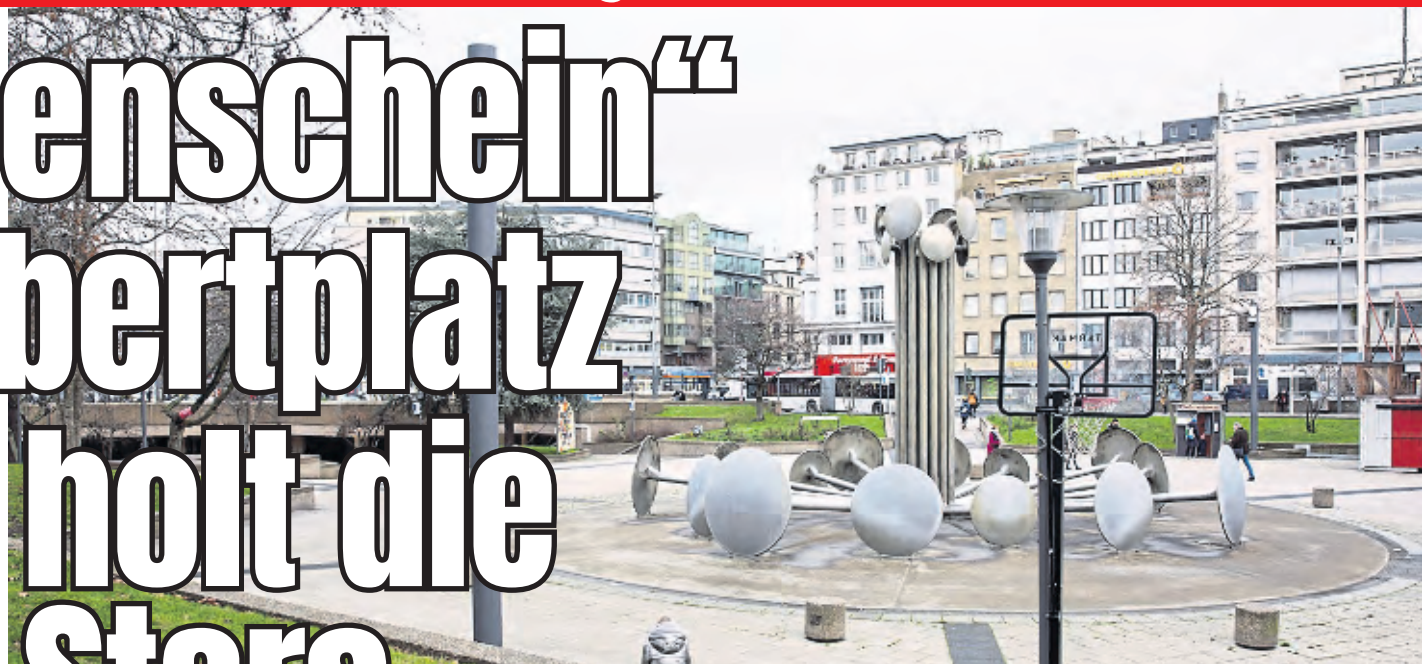
Die Produktionsfirma „augenschein“ hat ihren Sitz nahe des Ebertplatzes.

Fest steht, dass auch die Kölner MMC-Studios gebucht sind. Von der Film- und Medienstiftung NRW, die das internationale Starkinoprojekt mit einer Million Euro fördert, heißt es, die Produktionsstätten in Ossendorf würden als „höchste Filmstudios der Welt die idealen Bedingungen für die geplanten Bauten bieten“. Das lässt sich gerade eindrucksvoll im neuen Kinofilm mit Willem Dafoe („Spider Man: No Way Home“) sehen: Der Psychothriller „Inside“ mit Dafoe in der Hauptrolle spielt in einer mondänen New Yorker Penthousewohnung und wurde in den MMC-Studios abgedreht.