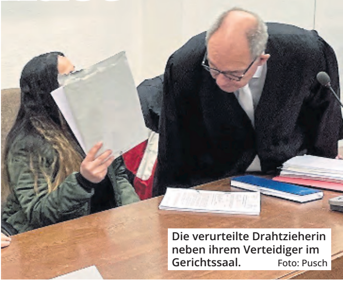
Die verurteilte Drahtzieherin neben ihrem Verteidiger im Gerichtssaal.

Die Mittäter erhielten Strafen zwischen zwei und drei Jahren Gefängnis.