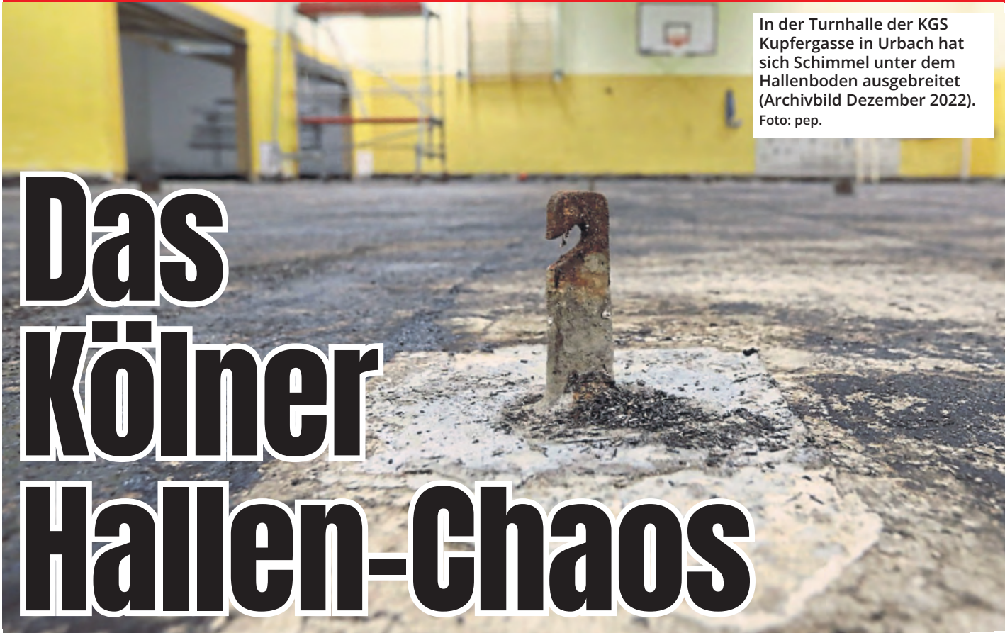
In der Turnhalle der KGS Kupfergasse in Urbach hat sich Schimmel unter dem Hallenboden ausgebreitet (Archivbild Dezember 2022).