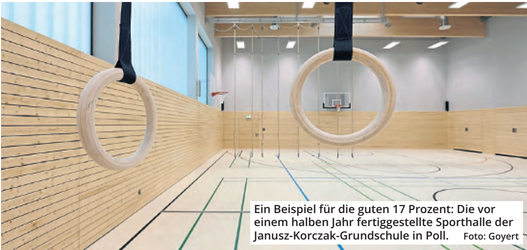
Ein Beispiel für die guten 17 Prozent: Die vor einem halben Jahr fertiggestellte Sporthalle der Janusz-Korczak-Grundschule in Poll.

Pfeifer: „Ein Vergleich muss erlaubt sein: Die Sanierung der Oper kostet uns bis heute über den Daumen eine Milliarde Euro. Eine Milliarde. Für ein Prestigeobjekt, für eine kleine Minderheit. Sei gegönnt. Aber: Da sollte eine zweistellige Millionensumme für 300 000 sportbegeisterte Kölner, vor allem Kinder, Jugendliche und Senioren, doch eigentlich kein Problem sein, um schnell das Nötigste zu reparieren und der Gesundheit und dem sozialen Leben Vorfahrt zu geben!“