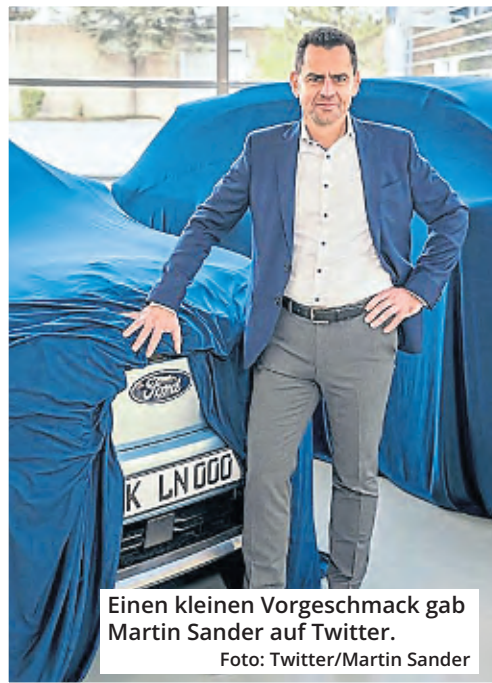
Einen kleinen Vorgeschmack gab Martin Sander auf Twitter.

Am 7. 7. läuft der letzte Fiesta vom Band, im Herbst sollen dann die ersten E-Autos in den Verkauf gehen. (pm)