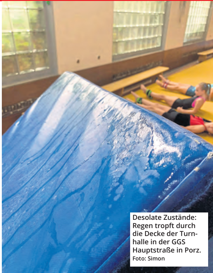
Desolate Zustände: Regen tropft durch die Decke der Turnhalle in der GGS Hauptstraße in Porz.

Von rund 280 Sporthallen in Köln haben nach Angaben der Stadtverwaltung 82 Prozent deutliche oder schwerwiegende Mängel. Sportvereine müssen Angebote streichen, Schulsport kann nicht mehr stattfinden. Schon vor Corona steckte der Kölner Hallensport in der Krise. Und die hat sich nach der Pandemie nicht abgeschwächt, im Gegenteil. Jetzt möchte die Politik handeln. Wie – und was der Stadtsportbund dazu sagt – lesen Sie hier.