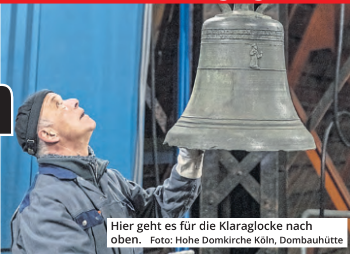
Hier geht es für die Klaraglocke nach oben.

des Domgeläutes integriert. Im Vierungsturm habe das historische Exemplar einen Platz neben drei weiteren Glocken: der Mettglocke, der Wandlungsglocke und der Angelusglocke.