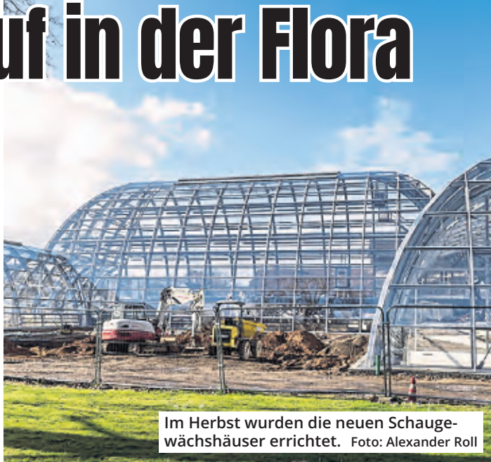
Im Herbst wurden die neuen Schaugewächshäuser errichtet.

Für den Fall, dass die vorgeschriebenen Vor- und Rücklauftemperaturen im Gewächshaus nicht erreicht werden, sind die verantwortlichen Firmen vor Ort, um bei Bedarf noch einmal nachsteuern zu können. Während der Testläufe werden auch Extrem-Temperaturen simuliert. Läuft alles glatt, wird im Anschluss der Betrieb für drei