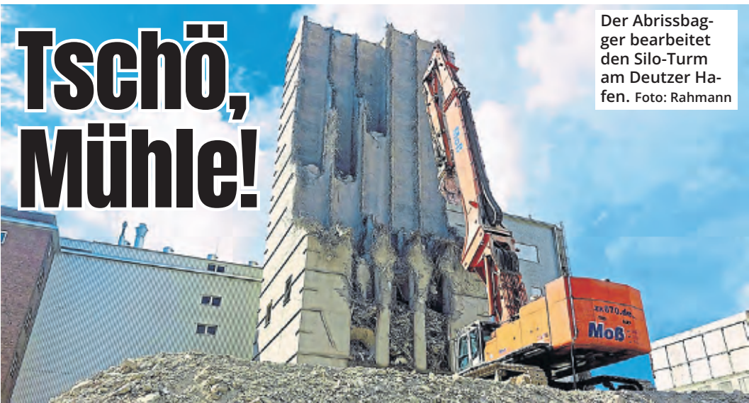
Der Abrissbagger bearbeitet den Silo-Turm am Deutzer Hafen.

Von März bis September werden Wassersäcke dienstags, von 8 bis 10 Uhr sowie 15 bis 17 Uhr im Stadthaus Deutz, Riegel F, 11. Etage, Raum 44 ausgegeben. Das Amt für Landschaftspflege und Grünflächen ist dankbar für die tatkräftige und wertvolle Unterstützung der Bevölkerung, Bäumen trotz Trockenphasen ein gutes Anwachsen und Gedeihen zu ermöglichen.