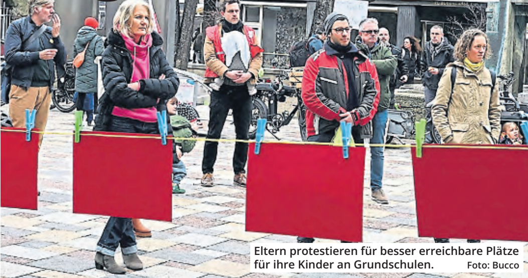
Eltern protestieren für besser erreichbare Plätze für ihre Kinder an Grundschulen.

Es war nicht der ideale Tag für eine Demonstration gegen die Schulplatznot an Grundschulen. Angesichts des Streiks der KVB war es für viele Eltern eine riesige Herausforderung, mit ihren Kindern quer durch Köln zu der Demo vor das Rathaus zu kommen, zu der Stadtschulpflegschaft und die Gewerkschaft Erziehung und Wissenschaft (GEW) aufgerufen hatten.