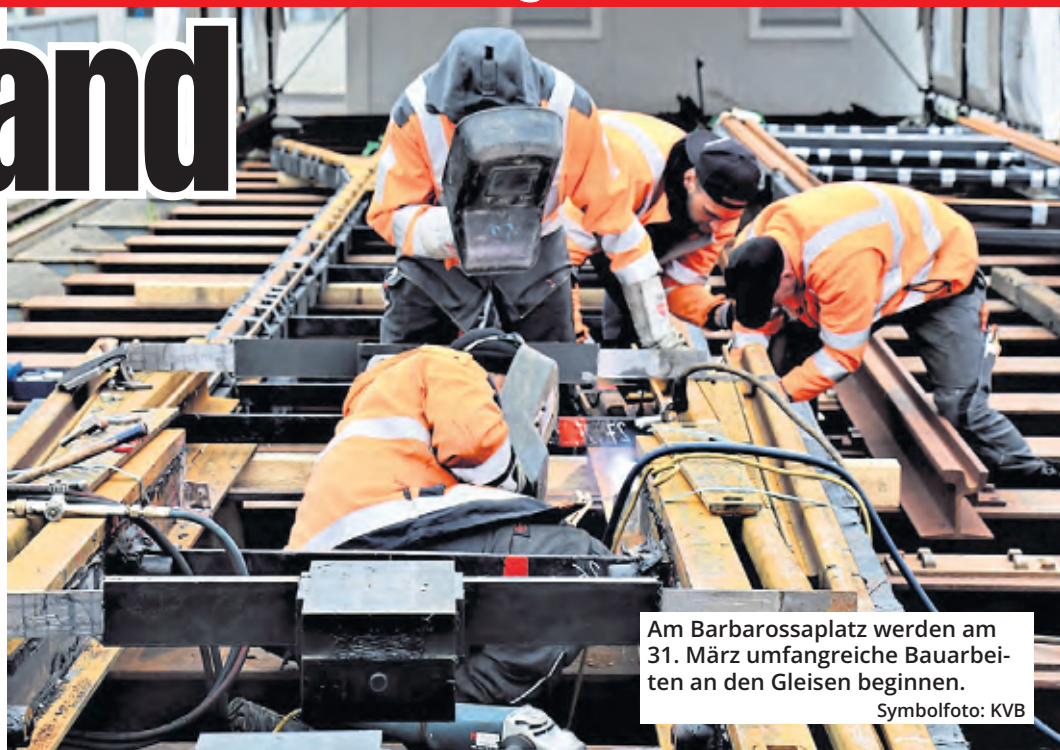
Am Barbarossaplatz werden am 31. März umfangreiche Bauarbeiten an den Gleisen beginnen.

„Zu dem Zeitpunkt werden wir es nicht hinbekommen, zum vollen Fahrplan zurückzukehren“, sagt Haaks. „Das ist blöd. Aber wenn die Kran-