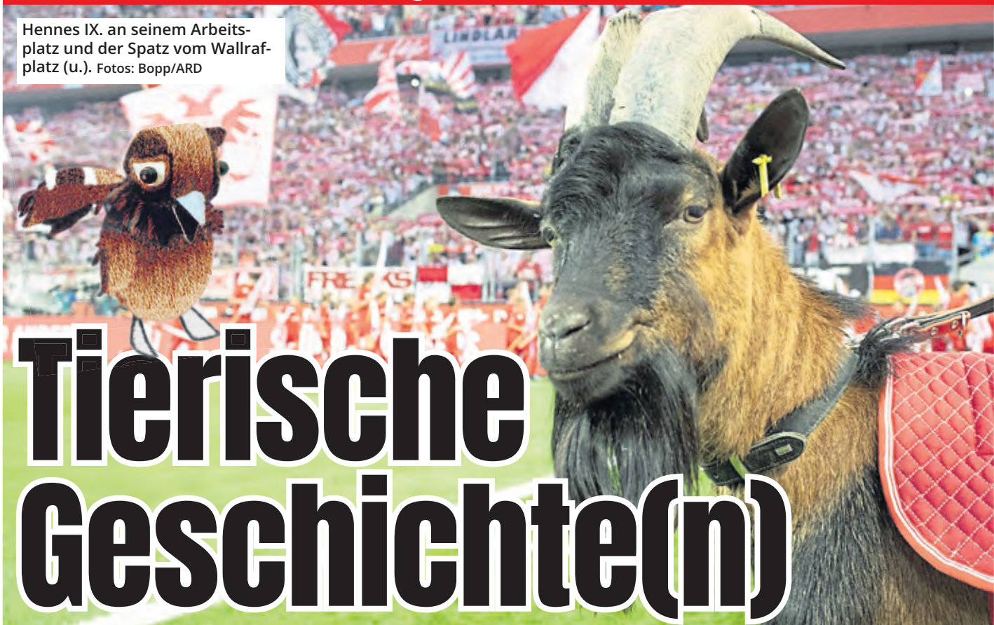
Hennes IX. an seinem Arbeitsplatz und der Spatz vom Wallrafplatz (u.).