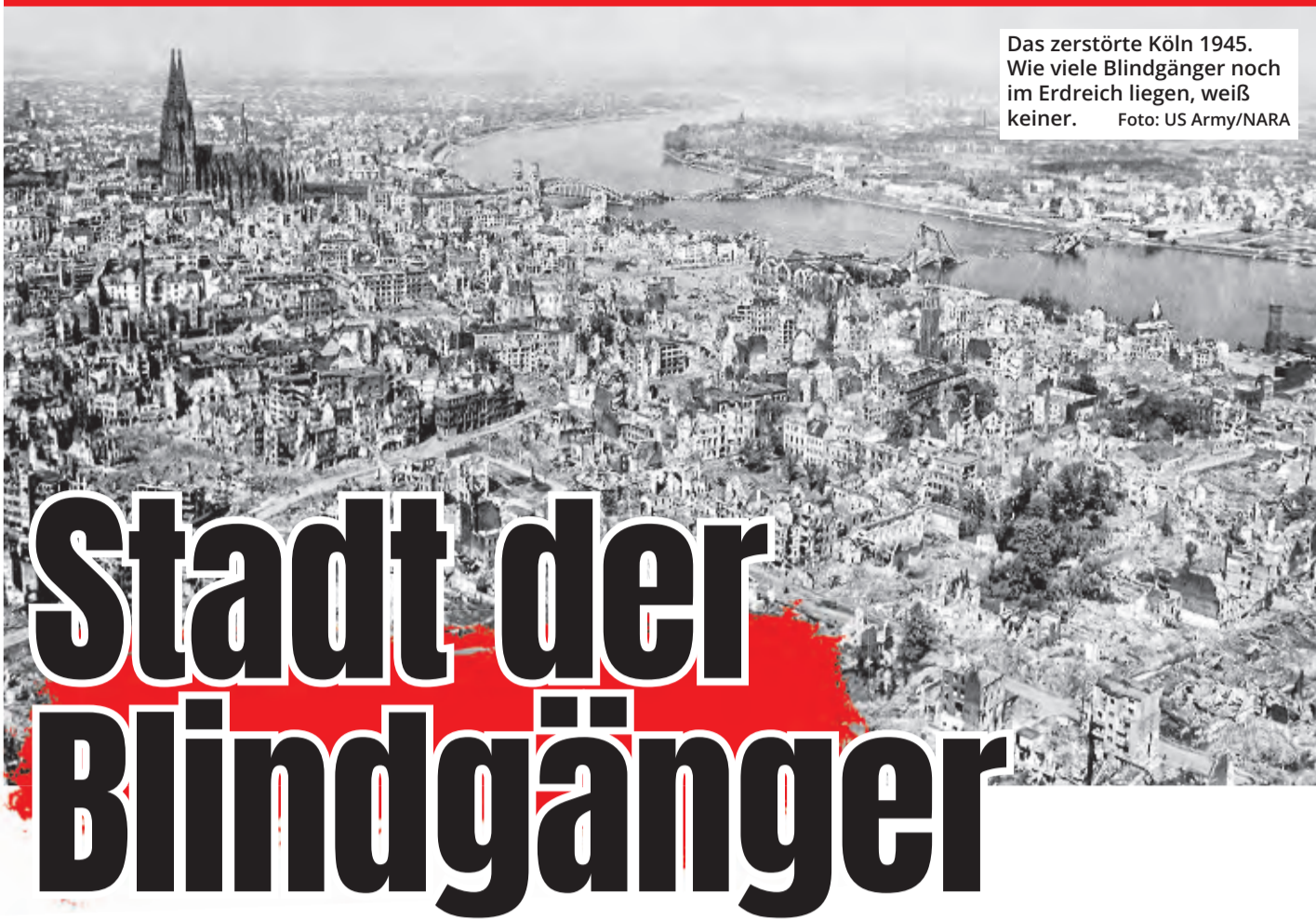
Das zerstörte Köln 1945. Wie viele Blindgänger noch im Erdreich liegen, weiß keiner.