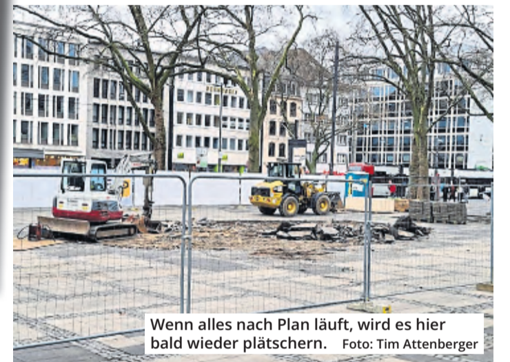
Wenn alles nach Plan läuft, wird es hier bald wieder plätschern.

In der Projektbeschreibung zum neuen Brunnen auf dem Neumarkt heißt es: „Die neue Brunnenfläche soll wieder drei Fontänen erhalten und die Fläche und Form dem alten Brunnen entsprechen.“ (red/mhe)