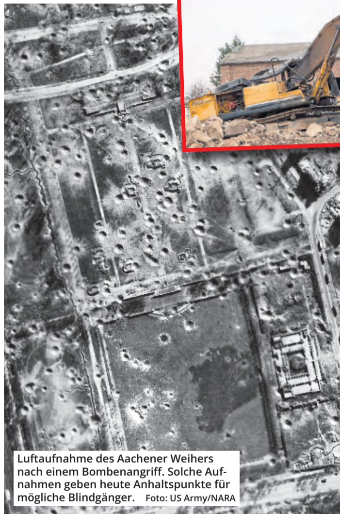
Luftaufnahme des Aachener Weihers nach einem Bombenangriff. Solche Aufnahmen geben heute Anhaltspunkte für mögliche Blindgänger.