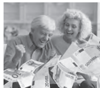
Es geht um viel Geld.

Bei einem Widerruf erhalten Sie – anders als bei der Kündigung – alle eingezahlten Beiträge ohne Abzug von Maklerprovisionen und Verwaltungskosten zurück. Und nicht nur das: Die Versicherung muss Sie auch an dem mit Ihrem Geld erzielten Anlagegewinn beteiligen. So können Sie bis zu 150 % der eingezahlten Beiträge zurückholen. Ein sattes Plus auf Ihrem Konto winkt!