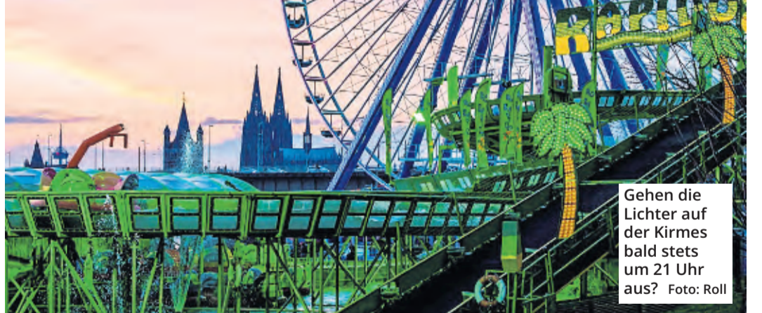
Gehen die Lichter auf der Kirmes bald stets um 21 Uhr aus?