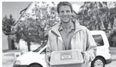
Landhausküche – eine Marke der apetito AG, Bonifatiusstraße 305, 48432 Rheine