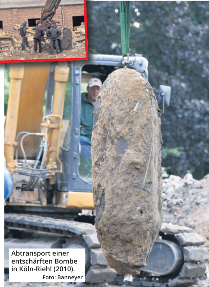
Abtransport einer entschärften Bombe in Köln-Riehl (2010).