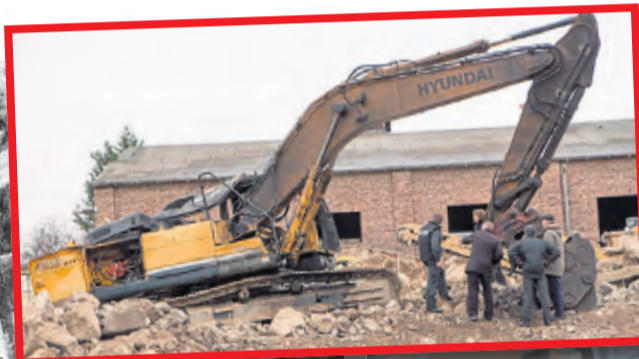
Links: 2014 löste dieser Bagger in Euskirchen die Explosion eines Blindgängers aus: Der Fahrer starb, acht weitere Menschen wurden schwer verletzt.

Dass er dadurch jedoch irgendwann einmal arbeitslos werden könnte, erwarte er in naher Zukunft nicht. Einen Wunsch habe er dennoch: „Ich möchte gerne, dass meine Enkel aufwachsen, ohne dass es diese Altlasten im Boden gibt!“