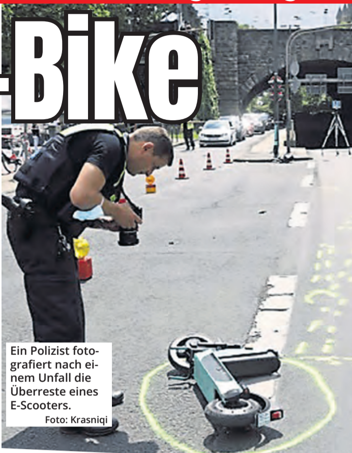
Ein Polizist fotografiert nach einem Unfall die Überreste eines E-Scooters.

Sorgen bereiten der Kölner Polizei auch Senioren auf E-Bikes. So viele Verunglückte gab es in Köln noch nie: Insgesamt waren es 276, das sind 55 Prozent mehr als im Jahr zuvor. Eine Person kam ums Leben. Allerdings waren auch nie so viele E-Bikes auf den Kölner Straßen unterwegs. Auf den Autobahnen in und um Köln gab es 2022