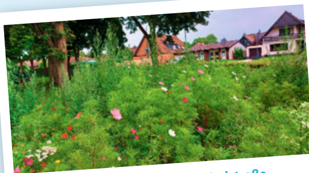
Grünfläche an der Schmiedstraße

2020 hat die Stadt Baesweiler die Fläche mit Unterstützung der Gartenbau- und Siedlergemeinschaft Setterich e.V. umgestaltet. Dort finden nun Insekten reichlich Nahrung und Unterschlupf.