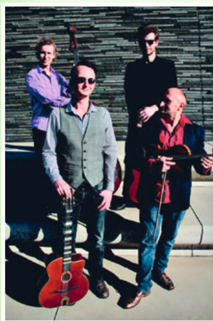
Hot Club de Cologne