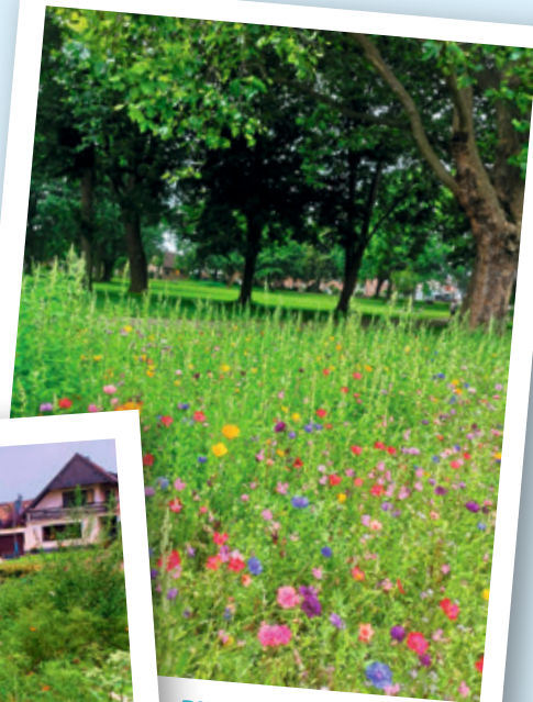
Blühfläche im Volkspark

Haben auch Sie Interesse daran, eine Patenschaft für eine Baumscheibe oder eine Grünfläche zu übernehmen? Schauen Sie doch im Serviceportal der Stadt Baesweiler vorbei oder kontaktieren Sie die Klimaschutzmanagerin Frau Vonhögen unter 02401/800-375 oder karina.vonhoegen@stadt.baesweiler.de .