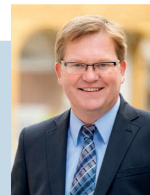
Oberbürgermeister Michael Cerny Stadt Amberg

„Die zunehmende Verlagerung der Kosten im Gesundheitswesen auf die Kommunen nimmt uns Städten die finanziellen Spielräume zur Umsetzung wichtiger Aufgaben wie beispielsweise im Bildungsbereich oder bei der Verkehrswende. Wir brauchen daher schnelle Hilfen zum Ausgleich und mittelfristig ein Umsteuern in der Gesundheitspolitik.“