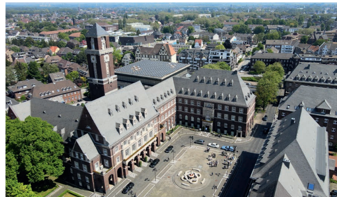
InnovationCity Bottrop: Sanierung Rathaus, Vivawest Zukunftshaus und Photovoltaik auf der Fläche