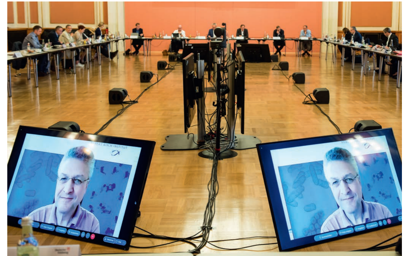
RKI-Präsident Prof. Dr. Lothar Wieler, hier virtuell zugeschaltet zur Präsidiumssitzung des Deutschen Städtetages im Roten Rathaus Berlin am 30. Juni

Die Städte werden den Sommer nutzen, damit Schutz- und Hygienemaßnahmen in den Schulen zum Beginn des neuen Schuljahres stimmen. An Bund und Länder appellieren die Städte, eine einheitlich abgestimmte Haltung für den Beginn des neuen Schul- und Kitajahres zu entwickeln.