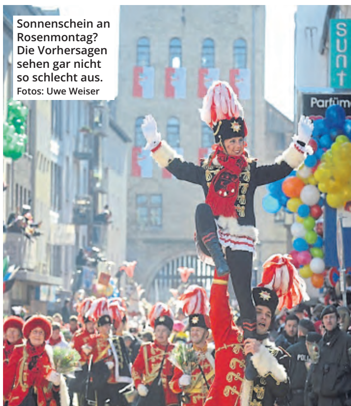
Sonnenschein an Rosenmontag? Die Vorhersagen sehen gar nicht so schlecht aus.

Obwohl wir dieses Jahr das 200-jährige Bestehen des organisierten Kölner Karnevals feiern, bedeutet das nicht auch den 200. Rosenmontagszug. Immer wieder gab es Gründe, die den Zoch verhinderten. Zuletzt waren es die Pandemie (2021) und der Ukraine-Krieg (2022). Im Jubiläumsjahr wird deshalb „erst“ der 167. „offizielle“ Rosenmontagszug durch die Stadt ziehen.