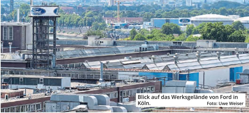
Blick auf das Werksgelände von Ford in Köln.

Der Betriebsrat hatte zunächst befürchtet, dass in Köln sogar 3200 Jobs wegfallen könnten. Entsprechend erleichtert waren die Arbeitnehmervertreter, dass deren Befürchtungen sich nicht bewahrheiteten. Nach Gesprächen mit dem Management gab