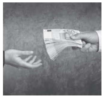
Es geht um viel Geld.

Bei einem Widerruf erhalten Sie – anders als bei der Kündigung – alle eingezahlten Beiträge ohne Abzug von Maklerprovisionen und Verwaltungskosten zurück. Und nicht nur das: Die Versicherung muss Sie auch an dem mit Ihrem Geld erzielten Anlagegewinn beteiligen. So können Sie bis zu 150 % der eingezahlten Beiträge zurückholen. Ein sattes Plus auf Ihrem Konto winkt!