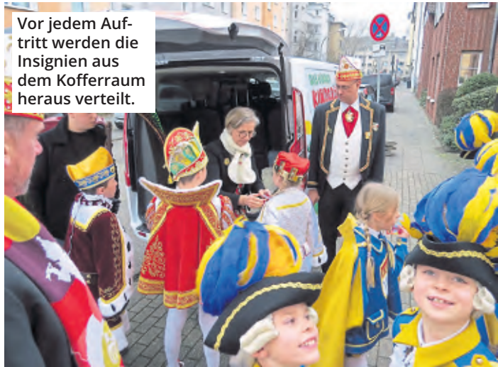
Vor jedem Auftritt werden die Insignien aus dem Kofferraum heraus verteilt.