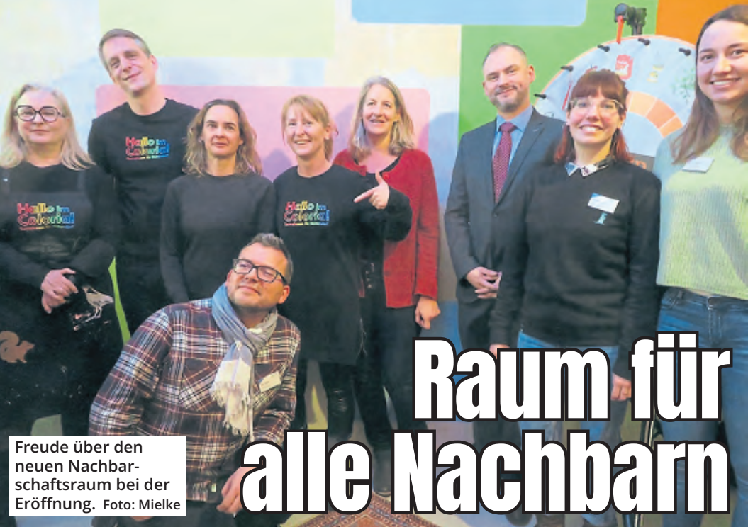
Freude über den neuen Nachbarschaftsraum bei der Eröffnung.