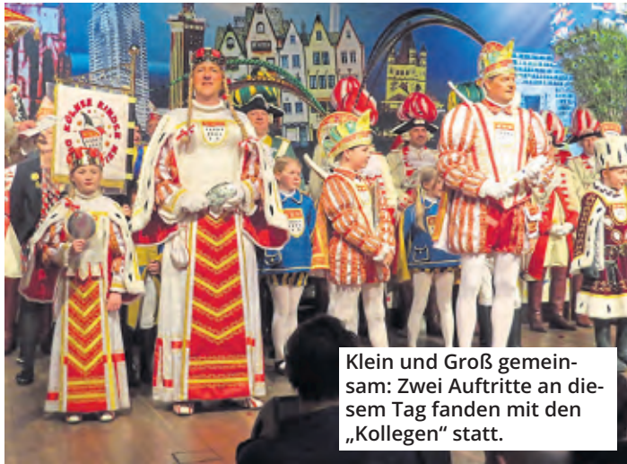
Klein und Groß gemeinsam: Zwei Auftritte an diesem Tag fanden mit den „Kollegen“ statt.