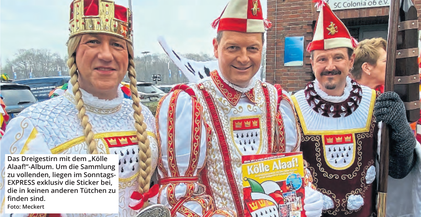
Das Dreigestirn mit dem „Kölle Alaaf!“-Album. Um die Sammlung zu vollenden, liegen im Sonntags-EXPRESS exklusiv die Sticker bei, die in keinen anderen Tütchen zu finden sind.