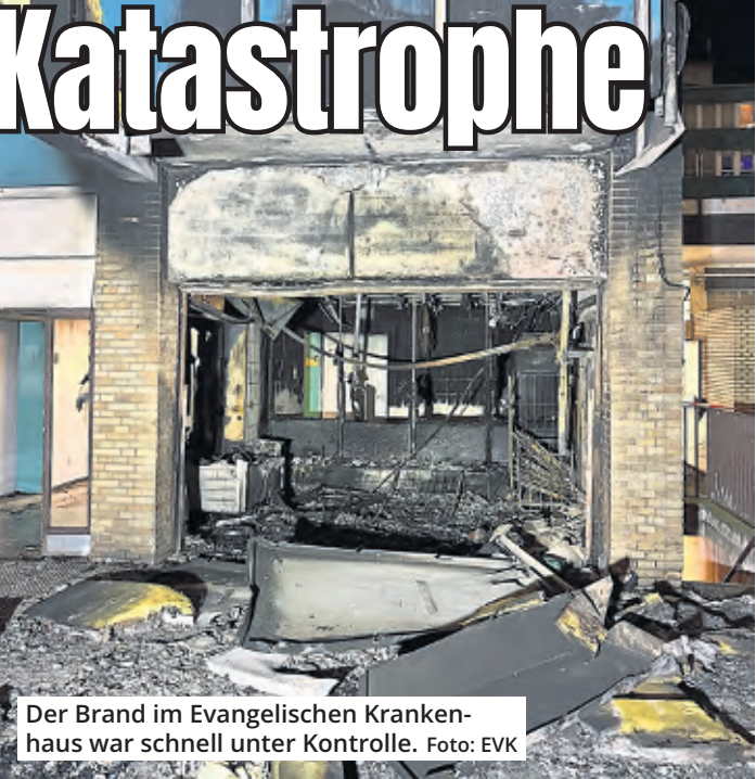
Der Brand im Evangelischen Krankenhaus war schnell unter Kontrolle.

Ausgelöst wurde der Alarm gegen 1.30 Uhr. Die Feuerwehr war nur wenig später mit zwei Löschzügen vor Ort. Der Rauch breitete sich vom Entsorgungsraum rasch durch Lüftungsschächte und gekippte Fenster über sieben Geschosse des Gebäudes aus, sodass 54 Patienten evakuiert werden mussten. Nach Reinigung und Kontrolle der Stationen konnten alle Patienten wieder