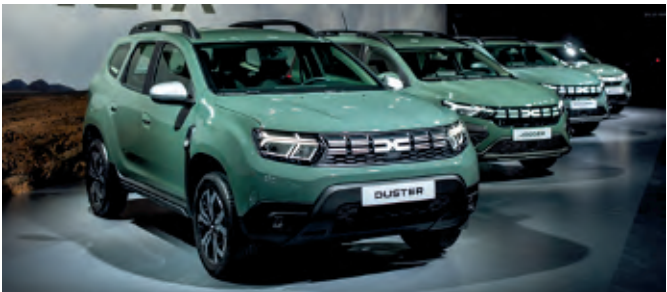
Dacia setzt auf bivalente Eco-G Modelle

bis zu 13 Prozent geringere CO 2 -Emissionen ohne Leistungseinbußen sowie bei vollem Benzin- und Autogastank bis zu 1.300 Kilometer Reichweite. Auch stoßen Eco-G Aggregate im Autogasbetrieb keine Rußpartikel aus. Stichwort „Sicherheit“: Ein Füllstoppventil begrenzt die Befüllung des Flüssiggastanks auf 80 Prozent. Hinzu kommen ein Rückschlagventil und ein Sicherheitsventil, so dass die Eco-G Modelle von Dacia uneingeschränkt Zufahrt zu Parkhäusern und Tiefgaragen haben. LPG selbst ist, anders als Erdgas, keinen Lie-