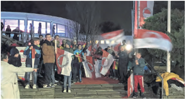
Die Fans standen vor der Ankunft bei Rot-Weiss Spalier.