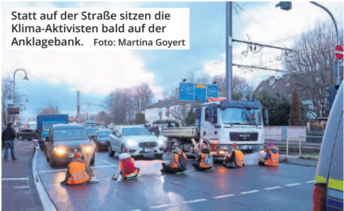
Statt auf der Straße sitzen die Klima-Aktivistinnen bald auf der Anklagebank.

Nach mehreren Blockadeaktionen auf Hauptverkehrsstraßen in Köln müssen sich insgesamt sieben Aktivistinnen und Aktivistinnen der „Letzten Generation“ in Kürze vor Gericht verantworten. Der Vorwurf lautet Nötigung.