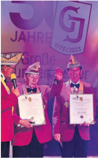
50 Jahre GJ: Ein Anlass, Gründungsmitglieder der Großen Junkersdorfer zu ehren.

schen Kinderprogramm, unter anderem mit den Domstürmern.