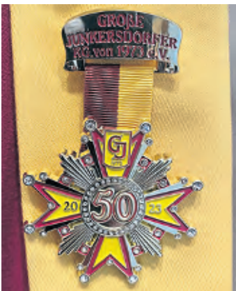
Die Jubiläums-Spange der KG.

Am Samstag nach Aschermittwoch treffen sich schließlich noch Mitglieder und Freunde zum Fischessen im Kastanienhof.