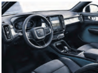
Im Volvo-Innenraum arbeitet ein Luftreiniger.