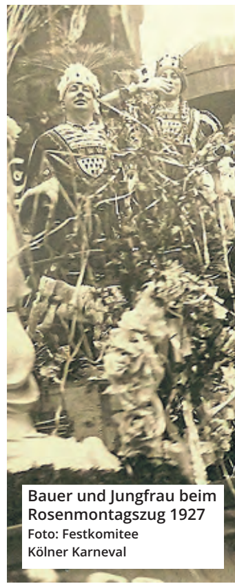
Bauer und Jungfrau beim Rosenmontagszug 1927