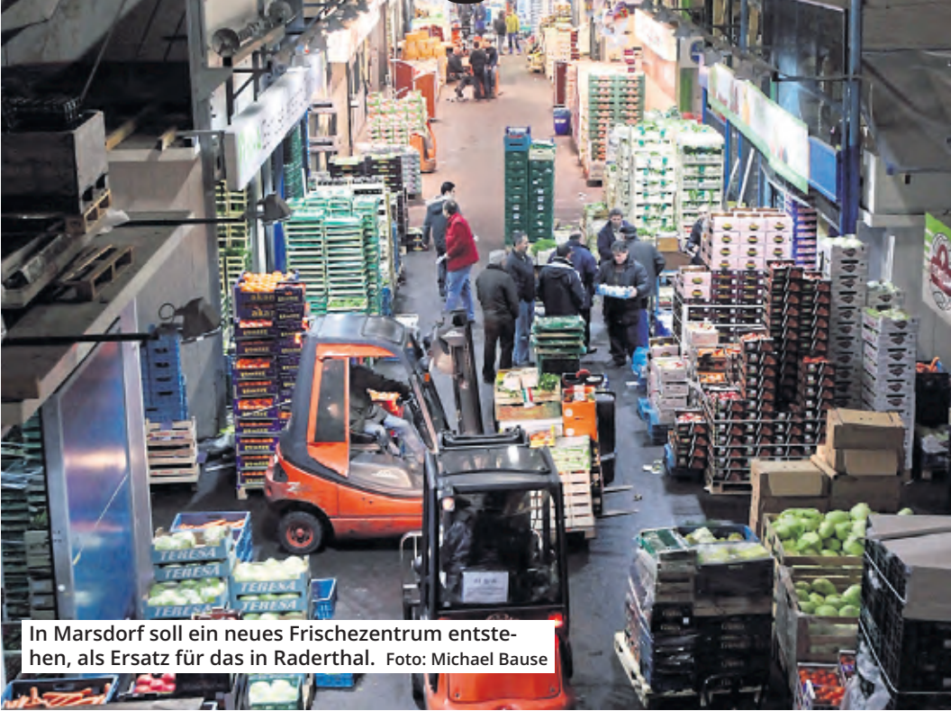
In Marsdorf soll ein neues Frischezentrum entstehen, als Ersatz für das in Raderthal.

Vorbild Europa: Für den geplanten Großmarkt in Marsdorf startet die Stadtverwaltung eine europaweite Markterkundung.