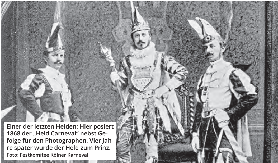
Einer der letzten Helden: Hier posiert 1868 der „Held Karneval“ nebst Ge- folge für den Photographen. Vier Jah- re später wurde der Held zum Prinz.