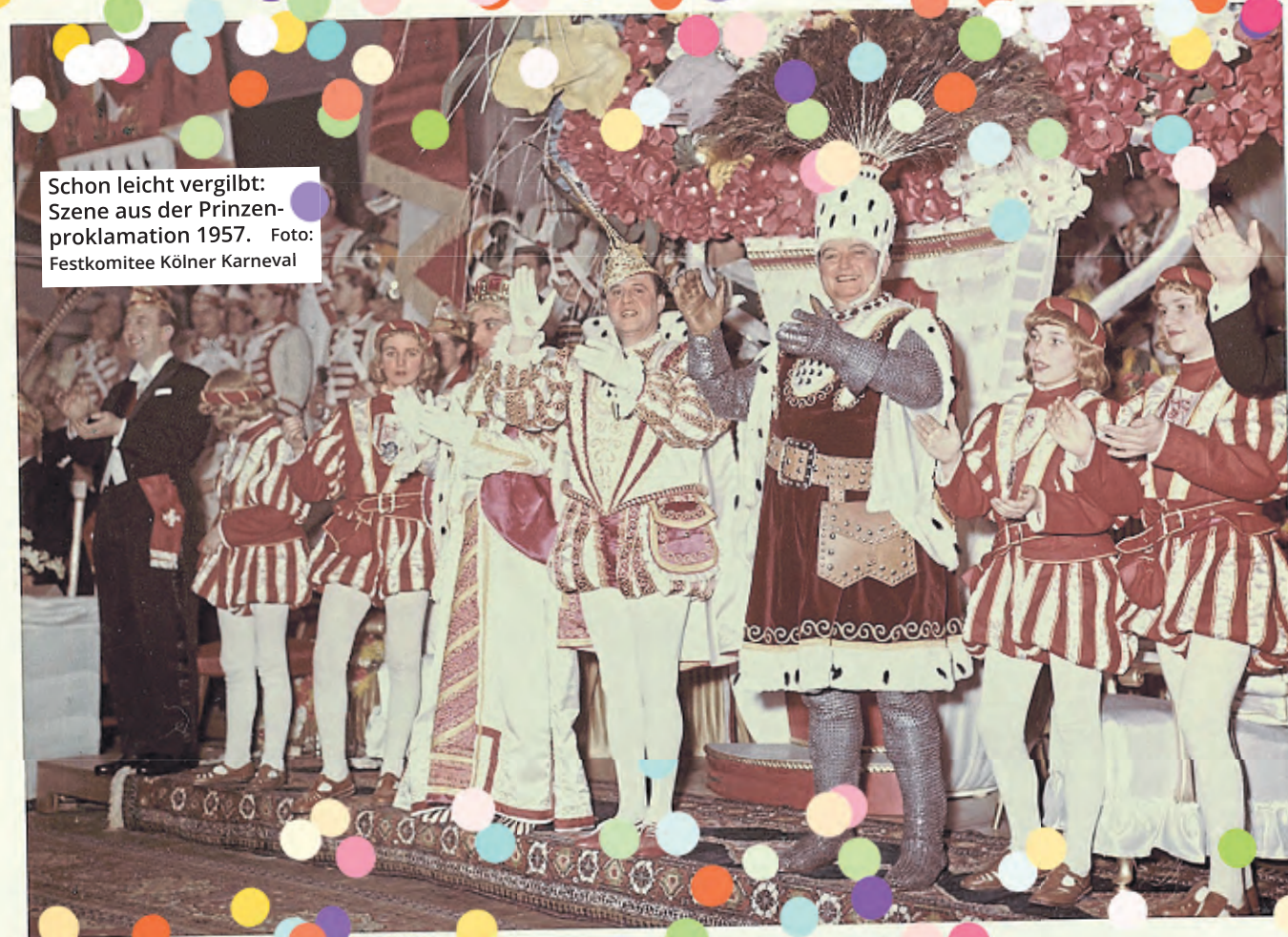
Schon leicht vergilbt: Szene aus der Prinzen- proklamation 1957.