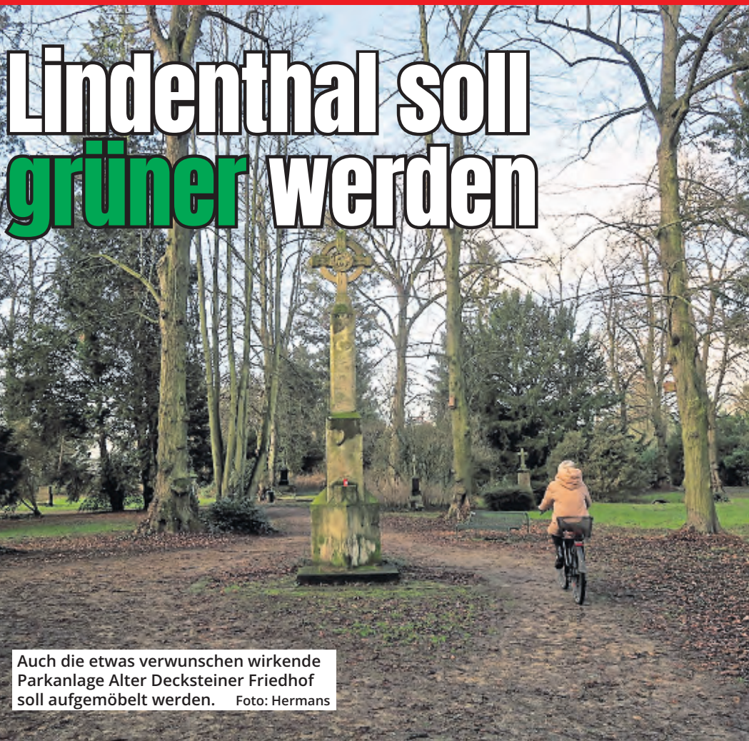
Auch die etwas verwunschen wirkende Parkanlage Alter Decksteiner Friedhof soll aufgemöbelt werden.

Bezirksvertreter entschieden über Verwendung von Mitteln zur Verbesserung des Klimas im Bezirk.