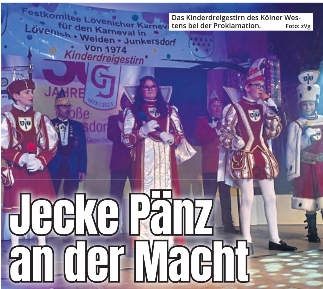
Das Kinderdreigestirn des Kölner Westens bei der Proklamation.

Rolladen König GmbH Ottostraße 16 50859 Köln info@rolladen-koenig.de www.rolladen-koenig.de