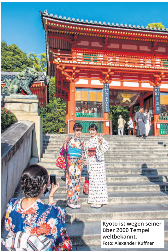
Kyoto ist wegen seiner über 2000 Tempel weltbekannt.

so sagt sie: „Freundlich durch's Leben gehen!“ Für die Zukunft wünscht sich die Jubilarin, dass sie sich eines Tages friedlich verabschieden kann. „Aber das entscheidet der Herrgott“.