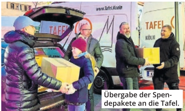
Übergabe der Spendenpakete an die Tafel.

Im Mai soll es eine weitere Aktion geben. „Ganz wichtig ist uns, dass wir dieses Jahr im