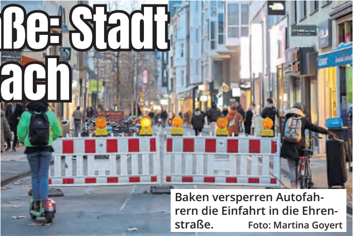
Baken versperren Autofahrern die Einfahrt in die Ehrenstraße.

Die Zustände haben die Stadt Köln zu weiteren Maßnahmen veranlasst: An zwei Zufahrten zur Ehrenstraße sind mobile Baken aufgestellt worden, die als Hindernisse für Autofahrer dienen sollen. In einigen Wochen werden sie durch herausnehmbare Poller ersetzt.