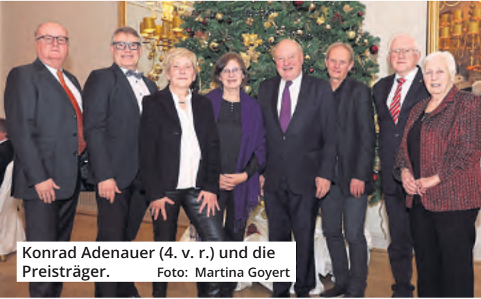
Konrad Adenauer (4. v. r.) und die Preisträger.

In der Preisurkunde heißt es, die beiden ausgezeichneten Vereine „ergänzen in vorbildlicher Weise die staatlichen Leistungen und geben so ein leuchtendes Beispiel von gelebter Solidarität. Sie tragen maßgeblich zur friedlichen Existenz unserer Gesellschaft bei.“