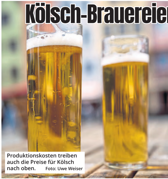
Produktionskosten treiben auch die Preise für Kölsch nach oben.