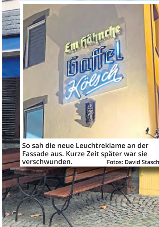
So sah die neue Leuchtreklame an der Fassade aus. Kurze Zeit später war sie verschwunden.

Als die neue Außenwerbung angebracht wurde, postete Stasch sie noch voller Stolz auf dem Instagram-Kanal der Gaststätte. Er schloss den Laden in der Nacht auf den 2. Dezember gegen 1 Uhr ab. Gegen Mittag erhielt er dann einen Anruf von seiner Frau, die die Kneipe für den nächsten Abend herrichten wollte. „Sie sagte zu mir: Die neue Werbung sieht ja schon ganz schön aus. Aber wann wird denn der Rest angebracht? Ich wusste zuerst gar nicht, was sie meint,