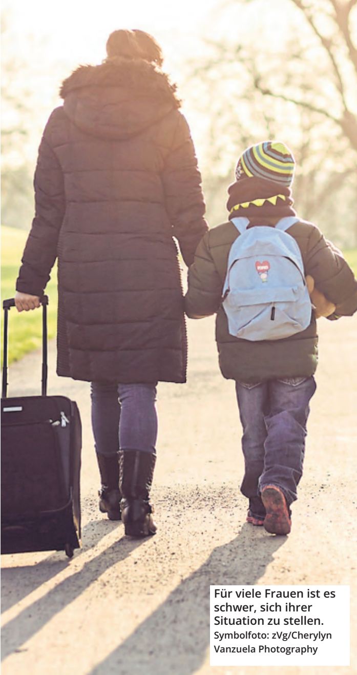
Für viele Frauen ist es schwer, sich ihrer Situation zu stellen.

Jede dritte Frau erlebt einmal in ihrem Leben körperliche Gewalt. Soweit die Statistik. Die betroffenen Frauen stehen neben den physischen Verletzungen und dem seelischen Schmerz oft vor der Frage, wie sie sich vor dem gewalttätigen (Ex-)Partner in Sicherheit bringen können. Und wohin mit den Kindern? In Köln wurde 1976 das erste Frauenhaus gegründet, ein Ort, wo Frauen mit ihren Kindern Zuflucht finden können und dessen Adresse geheim ist. 1991 kam ein weiteres Frauenhaus hinzu.