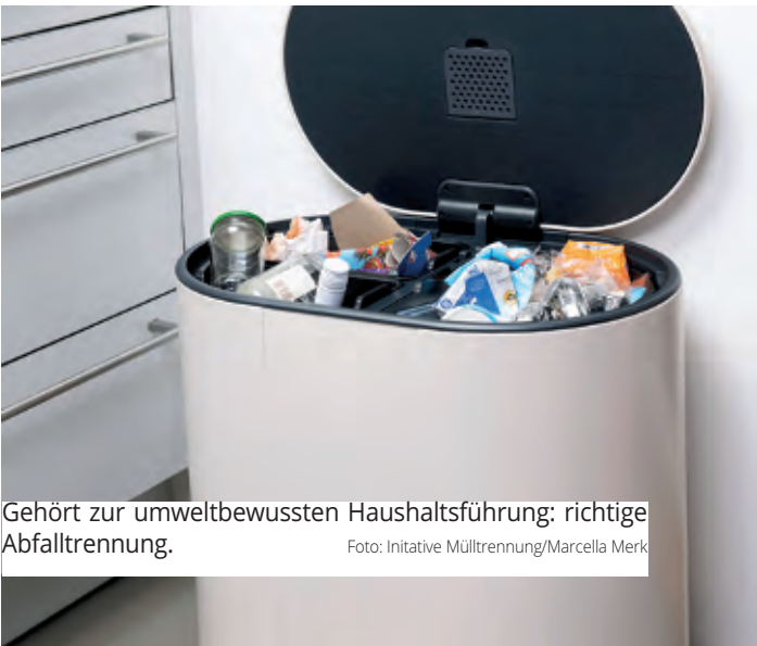
Gehört zur umweltbewussten Haushaltsführung: richtige Abfalltrennung.

Die einfache Grundregel lautet: In die Gelbe Tonne/den Gelben Sack gehören ausschließlich gebrauchte und restentleerte Verpackungen, die nicht aus Papier, Pappe, Karton oder Glas sind. Das sind Leichtverpackungen aus Kunststoff wie Joghurtbecher oder leere Shampooflaschen. Auch Aluminium- und Weißblechverpackungen wie Konservendosen oder Senftuben und