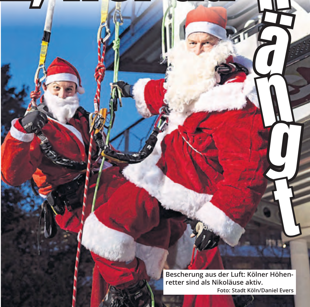
Beschercung aus der Luft: Kölner Höhenretter sind als Nikoläuse aktiv.

ter der dortigen pädiatrischen Notfallmedizin. „Es ist eine gute Möglichkeit, den Kindern und Jugendlichen etwas Abwechslung in den Stationsalltag zu bringen, denn gerade in der Adventszeit ist es für sie schwer, im Krankenhaus zu sein. Umso schöner ist es, ihnen eine Freude zu bereiten.“