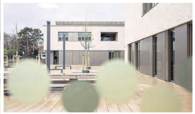
Ein Zuweg zur neuen Grundschule im Sürther Feld wird befestigt.

Sürth. Soviel stehe bereits fest: Die dauerhafte Befestigung des Weges soll in Abhängigkeit von den Witterungsverhältnissen bis zum Ende der Weihnachtsferien erledigt sein. „So werden die Schülerverkehre über die Sürther Straße dauerhaft entlastet und auch sicherer gemacht. Zu letztgenanntem Aspekt trägt auch eine deutlich vergrößerte Aufstellfläche für Radfahrende an der Kreuzung Kölnstraße / Am Feldrain gegenüber der ARAL-Tankstelle bei, wie auch die insbesondere für Rollstuhlfahrer wichtige Entfernung einer Auf-