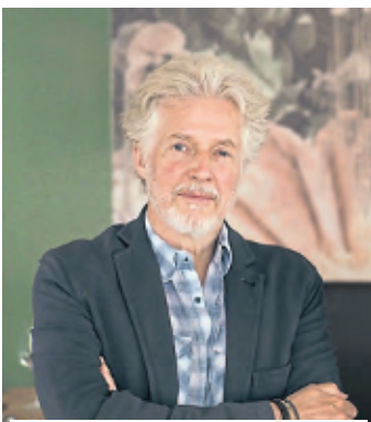
Frank Schätzing veröffentlichte 2004 den Roman „Der Schwarm“.

„Weitere Teaser werden folgen“, teilte ZDF-Sprecherin Maïke Magdanz mit. Ansonsten herrscht eine Welle des Schweigens. Schätzing verweist – auf