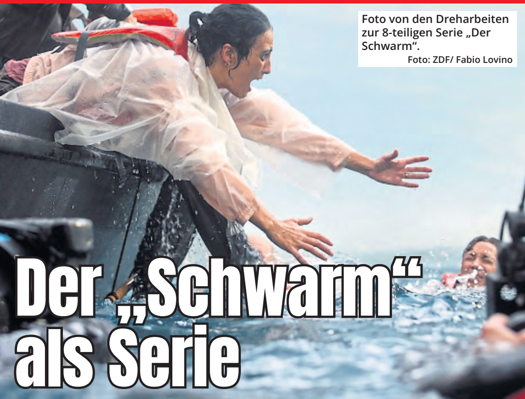
Foto von den Dreharbeiten zur 8-teiligen Serie „Der Schwarm“.