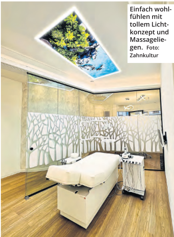
Einfach wohlfühlen mit tollem Lichtkonzept und Massageliegen.