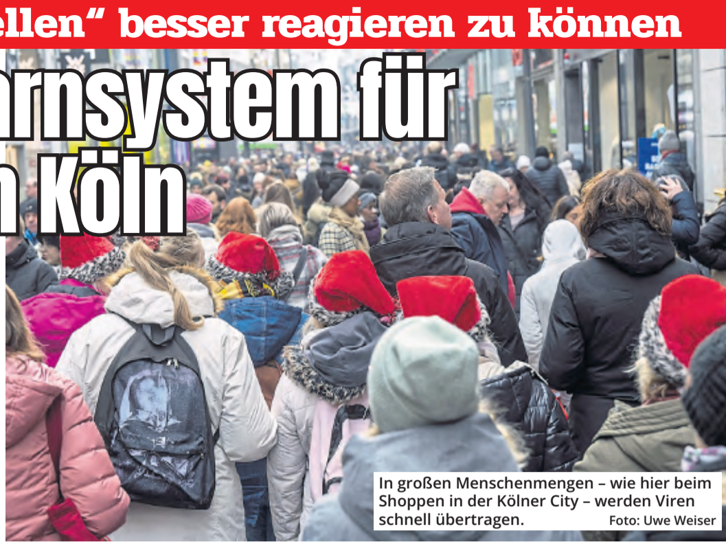
In großen Menschenmengen – wie hier beim Shoppen in der Kölner City – werden Viren schnell übertragen.