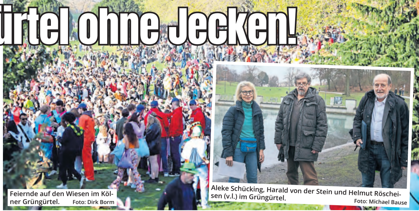
Feiernde auf den Wiesen im Kölner Grüngürtel.

Am 11.11. hatte die Polizei angesichts der Überfüllung der Zülpicher Straße die Menschen ins Landschaftsschutzgebiet des Inneren Grüngürtels abgeleitet. Die Folgen seien