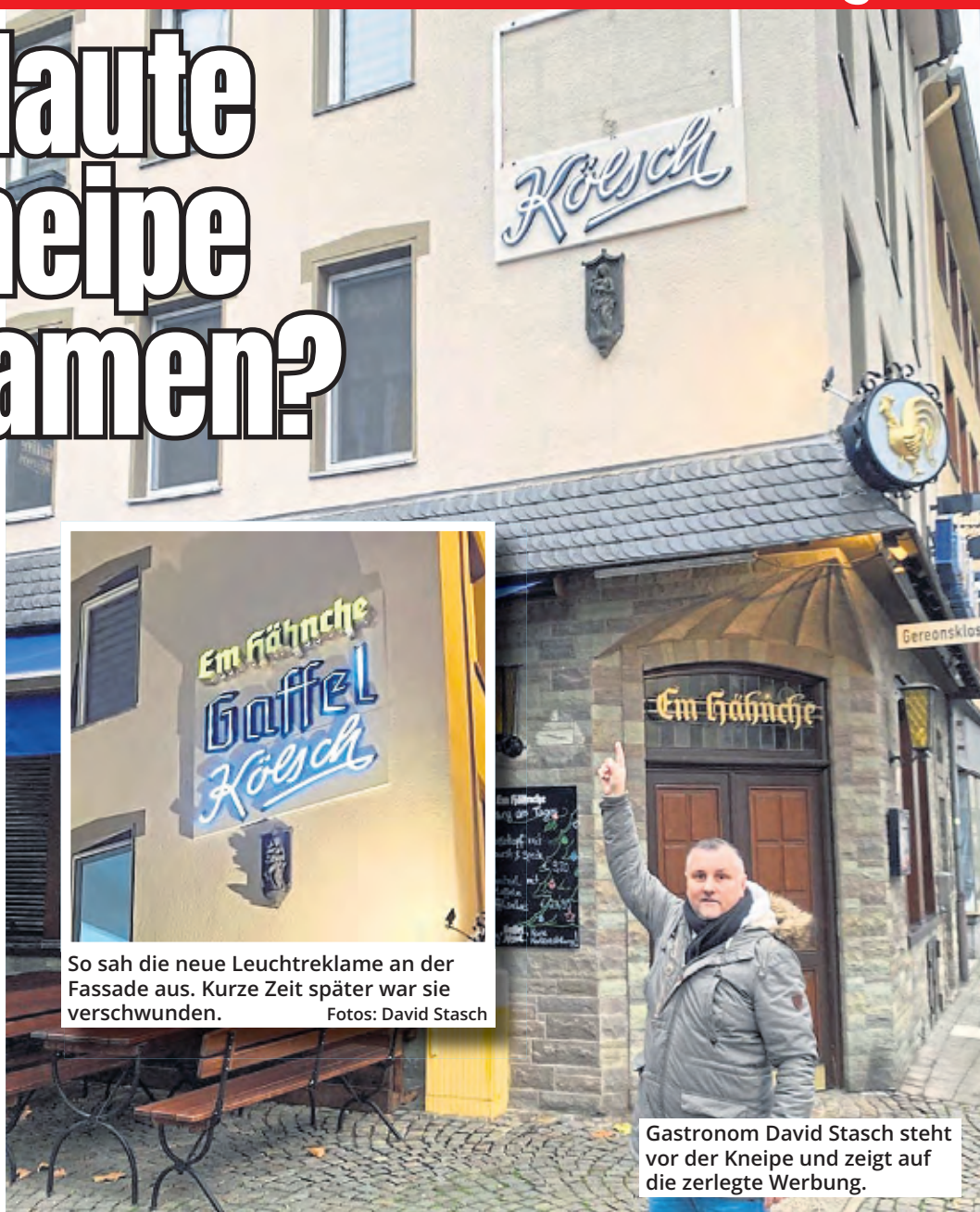
So sah die neue Leuchtreklame an der Fassade aus. Kurze Zeit später war sie verschwunden.

Als die neue Außenwerbung angebracht wurde, postete Stasch sie noch voller Stolz auf dem Instagram-Kanal der Gaststätte. Er schloss den Laden in der Nacht auf den 2. Dezember gegen 1 Uhr ab. Gegen Mittag erhielt er dann einen Anruf von seiner Frau, die die Kneipe für den nächsten Abend herrichten wollte. „Sie sagte zu mir: Die neue Werbung sieht ja schon ganz schön aus. Aber wann wird denn der Rest angebracht? Ich wusste zuerst gar nicht, was sie meint,