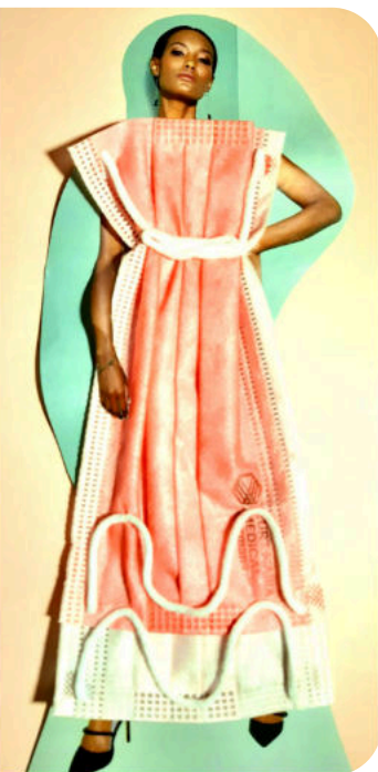
Kleid aus OP-Maske

Unter dem Motto „Maskenvielfalt“ ruft der Förderverein der Stadtteilbücherei Rheindorf/Auerberg zu einem Kreativwettbewerb um die schönsten Ideen zum Thema „Masken“ auf.