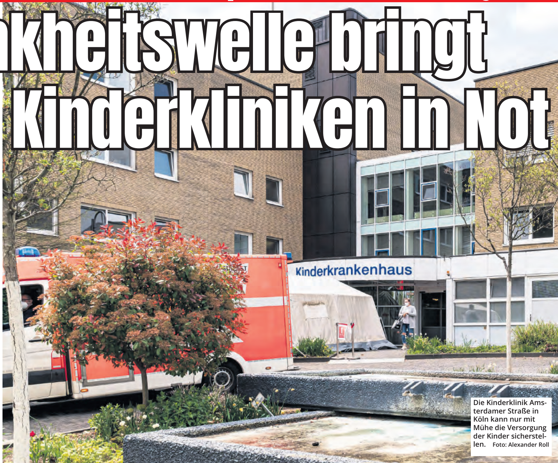
Die Kinderklinik Amsterdamer Straße in Köln kann nur mit Mühe die Versorgung der Kinder sicherstellen.

Funken: „Auch die Wartezeiten in der Notaufnahme sind durch den großen Andrang sehr lang. Ebenso müssen kranke Kinder direkt aus der Notaufnahme in andere NRW-Krankenhäuser verlegt werden. Wir bitten alle betroffenen Familien um Verständnis für die Wartezeiten und Verschiebungen. Diese Maßnahmen sind notwendig, um die Patientenversorgung aufrechtzuerhalten.“