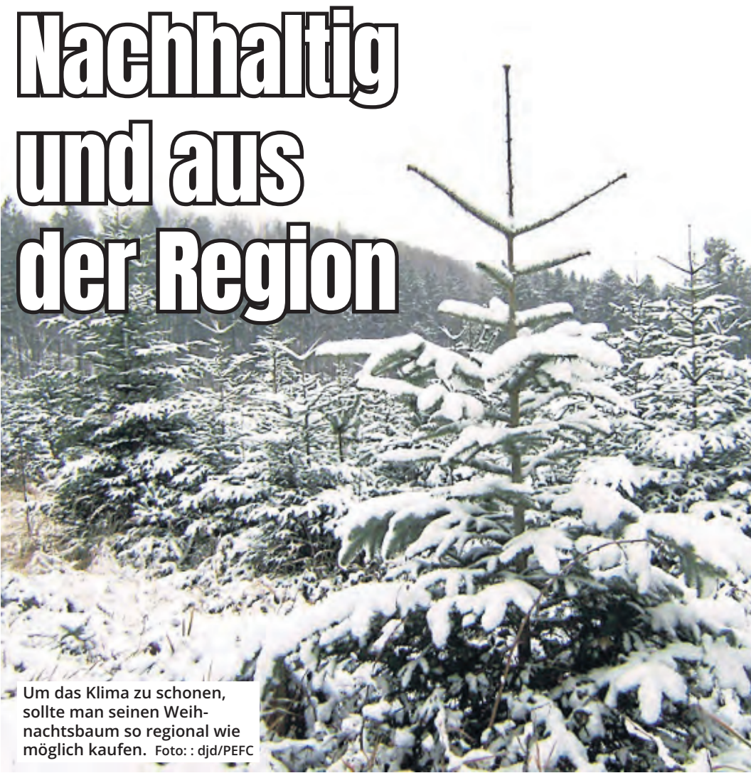
Um das Klima zu schonen, sollte man seinen Weihnachtsbaum so regional wie möglich kaufen.