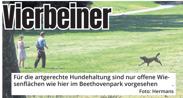
Für die artgerechte Hundehaltung sind nur offene Wiesenflächen wie hier im Beethovenpark vorgesehen.

angrenzenden Bäumen handle es sich zudem überwiegend um Buchen, die mit ihrem „oberflächennahen Wurzelsystem empfindlich auf Trittbelastung durch Mensch und Hunde“ reagierten. Das Vorhandensein von Schatten sei im Übrigen kein Kriterium für die Ausweisung von Hundefreilaufflächen, und die Anpflanzung von einzelnen robusten Bäumen auf der Hundewiese komme nicht in Frage, weil die Parkanlage