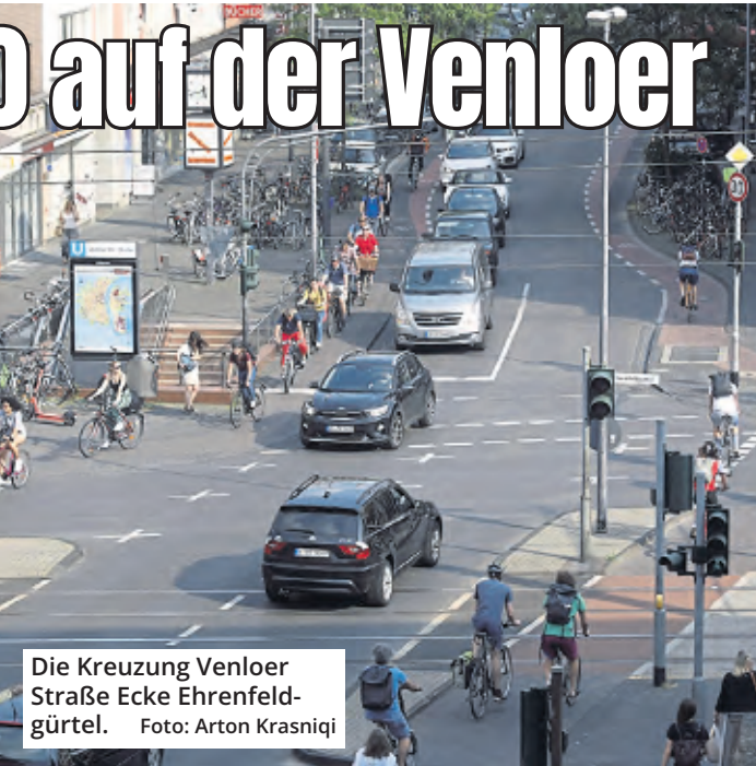
Die Kreuzung Venloer Straße Ecke Ehrenfeldgürtel.

Dazu werden die Fahrrad-schutzstreifen zunächst provisorisch mittels einer gelben X-Markierung außer Kraft gesetzt. Der Entfall der Fahrrad-schutzstreifen ist Voraussetzung für die Einrichtung einer Tempo-20-Zone, so die Stadt. Diese Markierungsarbeiten dauern voraussichtlich zwei Wochen und werden so durchgeführt, dass der Verkehr auf der Venloer Straße nicht beeinträchtigt werde.