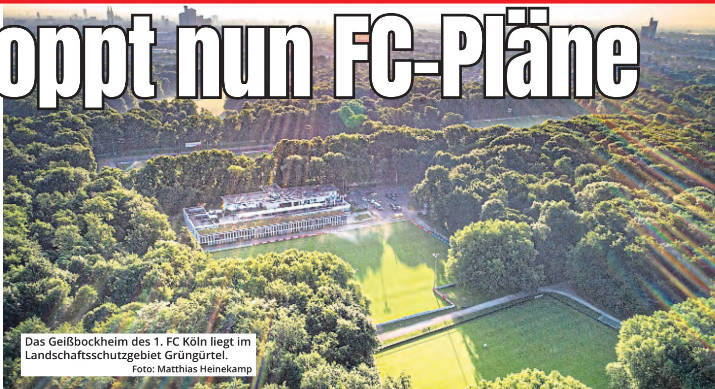
Das Geißbockheim des 1. FC Köln liegt im Landschaftsschutzgebiet Grüngürtel.