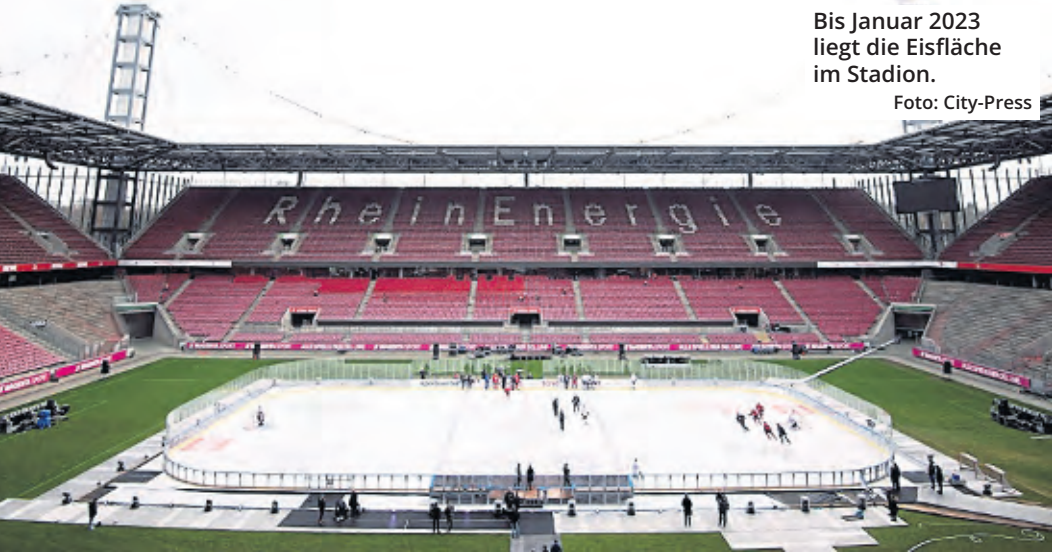
Bis Januar 2023 liegt die Eisfläche im Stadion.