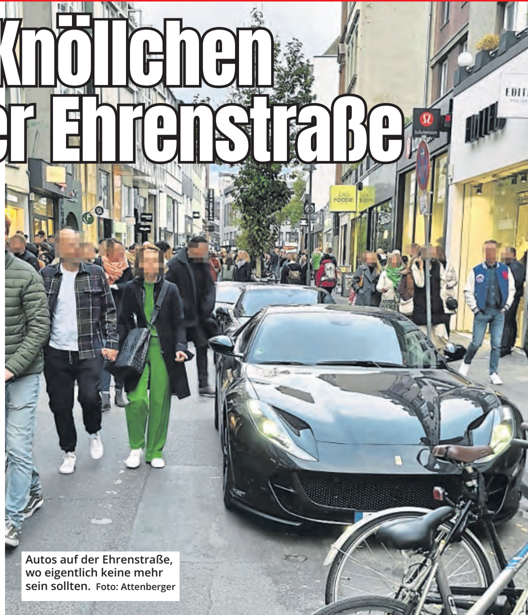
Autos auf der Ehrenstraße, wo eigentlich keine mehr sein sollten.

Eine Sondergenehmigung zum Befahren der Ehrenstraße besaßen die Fahrer der drei Autos nicht, wie die Stadt