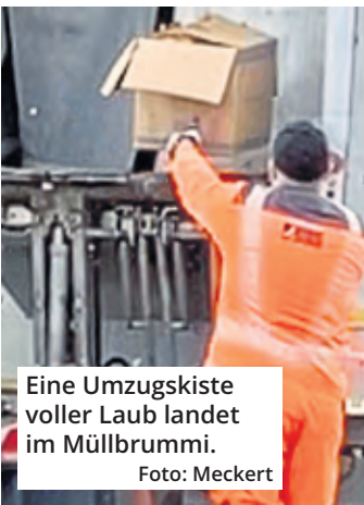
Eine Umzugskiste voller Laub landet im Müllbrummi.

Köln. Zum 100-jährigen Bestehen der Koelnmesse wird die Domstadt Gastgeber der globalen Konferenz der Messe-Branche sein. Der 91. UFI Global Congress wird vom 20. bis 23. November 2024 stattfinden. Die Koelnmesse ist eins der 20 Gründungsmitglieder der Global Association of the Exhibition Industry (UFI).