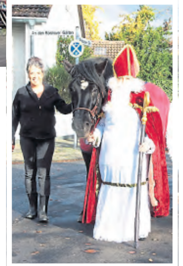
Sankt Nikolaus wird um 12 Uhr erwartet.

Nachdem Vandalen die Halterung des aufgestellten Weihnachtsbaumes im Jahr