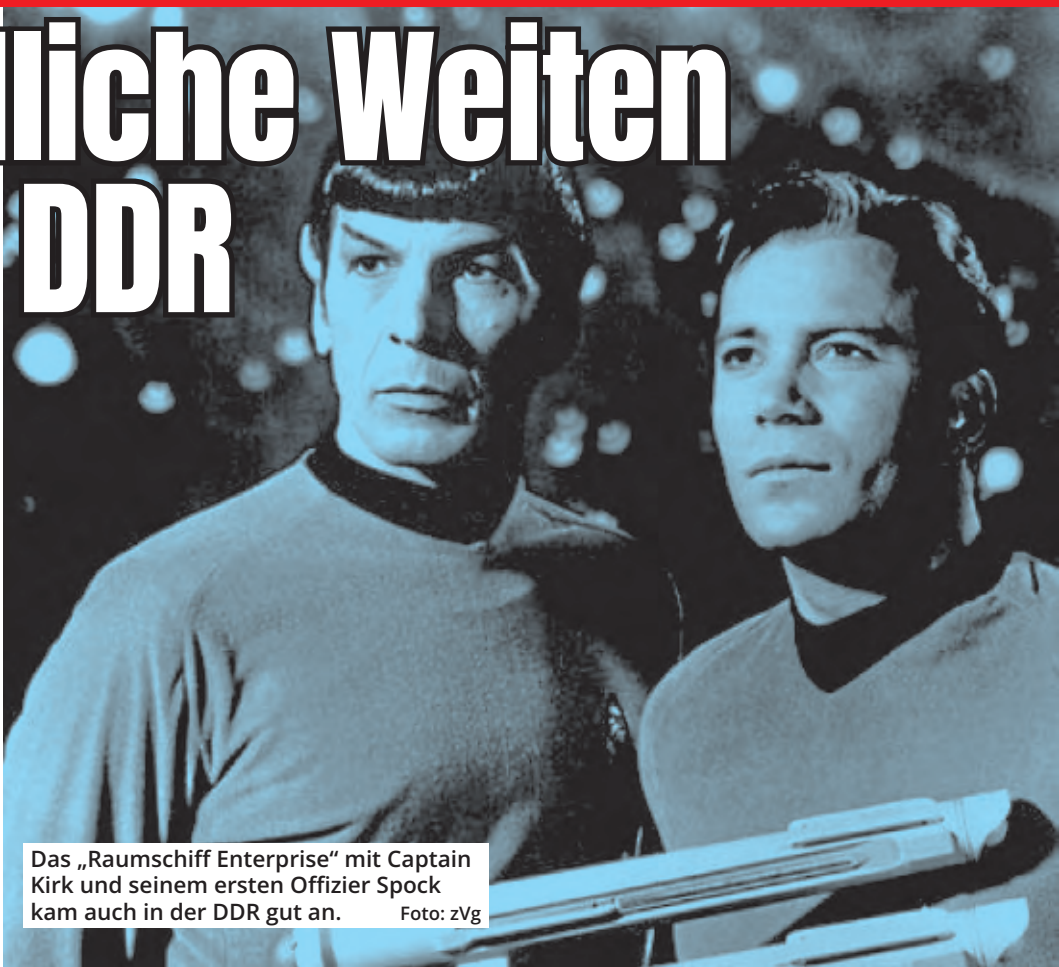
Das „Raumschiff Enterprise“ mit Captain Kirk und seinem ersten Offizier Spock kam auch in der DDR gut an.

In der Ausstellung trifft man so auf Klassiker der Filmgeschichte wie „Tootsie“ (mit Dustin Hofmann) sowie Filme mit Eddy Murphy oder Michael Douglas. Besonders spannend