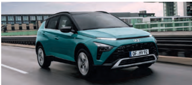
Kompakt, wendig und agil, der neue Baycon

Dank seiner Abmessungen und seines familienfreundlichen Platzangebots im Innenraums will der Baycon das Beste aus beiden Welten bieten: Während seine kompakte Größe die Handhabung erleichtert, bietet seine SUV-typische erhöhte Sitzposition die gewohnt gute Übersicht über das Verkehrsgeschehen. Mit einer Länge von 4,18 Meter, einer Breite von 1,77 Meter und einer Höhe von 1,49 Meter möchte der Baycon eine ausgewogene Balance zwischen