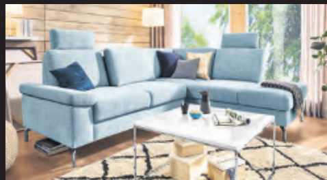
PM Polstermöbel Online Funktion mit Komfort