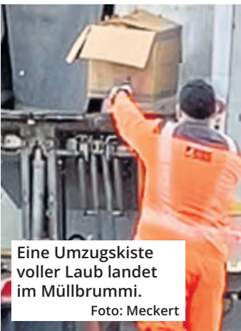
Eine Umzugskiste voller Laub landet im Müllbrummi.

Köln. Zum 100-jährigen Bestehen der Koelnmesse wird die Domstadt Gastgeber der globalen Konferenz der Messe-Branche sein. Der 91. UFI Global Congress wird vom 20. bis 23. November 2024 stattfinden. Die Koelnmesse ist eins der 20 Gründungsmitglieder der Global Association of the Exhibition Industry (UFI).