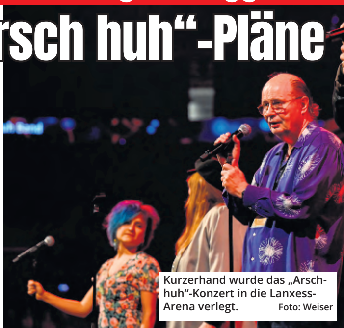
Kurzerhand wurde das „Arsch huh“-Konzert in die Lanxess-Arena verlegt.

Indes zeigte sich die AG Arsch huh äußerst zufrieden mit dem Verlauf der Jubiläumskundgebung, wie de-