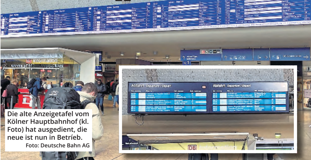
Die alte Anzeigetafel vom Kölner Hauptbahnhof (kl. Foto) hat ausgedient, die neue ist nun in Betrieb.