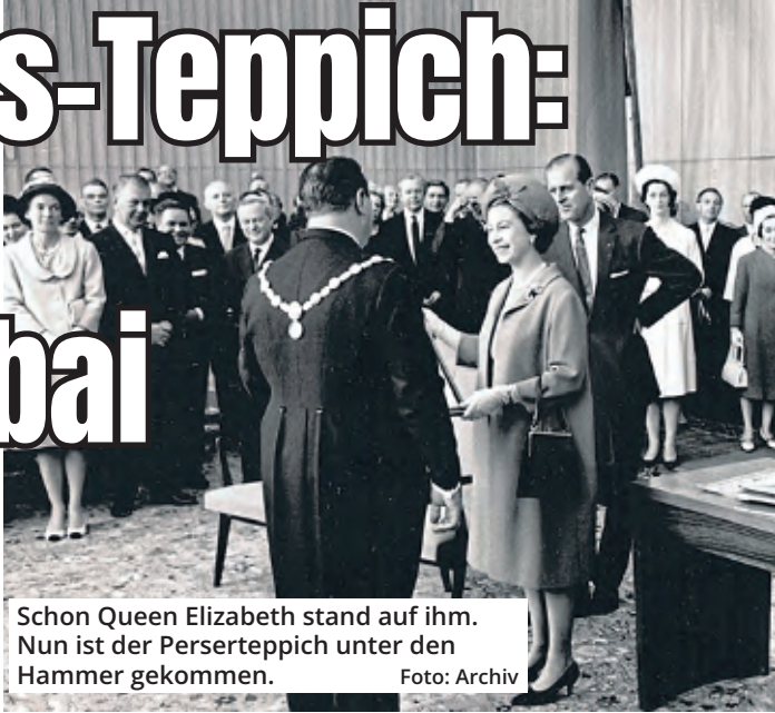
Schon Queen Elizabeth stand auf ihm. Nun ist der Perserteppich unter den Hammer gekommen.

Der Kleinste (44 Quadratmeter) kletterte von anfangs 7500 Euro am Ende auf 46 000 Euro. Zwei weitere Teppiche erzielten