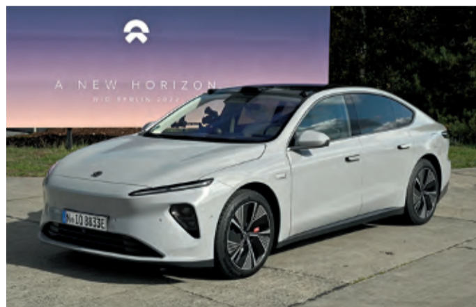
Der NIO ET7, die Premium-Limousine, ist jetzt zu haben

Köln - NIO, das globale Unternehmen für intelligente Elektroautos, ist in Deutschland mit seinen Produkten, den Geschäftsmodellen und Dienstleistungen gestartet. Die drei neuen Modelle NIO ET7, NIO ET5 und NIO EL7 werden zusammen mit innovativen Subscription-Modellen im Direktvertrieb erhältlich sein. Durch verschiedene Produkte und Dienstleistungen will NIO außerdem eine Community und einen Lebensstil für das „ultimate User-Erlebnis“ aufbauen. Der NIO ET7, die leistungsstarke Premium-Limousine, ist jetzt in Deutschland zu haben - sie wird bereits ab Mitte Oktober in Deutschland ausgeliefert. Außerdem bestätigt NIO, dass die Vorbestellungen für den NIO ET5, die mittelgroße Elektro-Limousine und den NIO EL7,