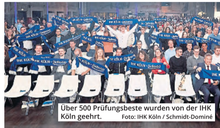
Über 500 Prüfungsbeste wurden von der IHK Köln geehrt.

Auch den Auszubildern in den Unternehmen und den Lehrkräften der Berufsschulen dankte die IHK-Präsidentin für ihre engagierte Arbeit mit den jungen Menschen. Ohne sie sei die hohe Qualität der dualen Berufsausbildung nicht möglich. Dank ging auch an die über 5000 Prüfer für ihren ehrenamtlichen Einsatz. Die Feier wurde via Livestream auf dem YouTube-Kanal der IHK Köln übertragen, rund 2500 Freunde und Familienangehörige, die nicht persönlich an der Feier teilnehmen konnten, schauten zu. Für 35 der 522 geehrten Top-Azubis geht es am 11. November weiter. Sie haben in ihren Beruf in ganz NRW den besten Abschluss gemacht.