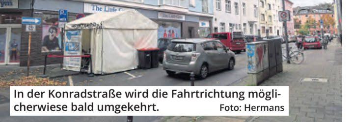
In der Konradstraße wird die Fahrtrichtung möglicherweise bald umgekehrt.

Sülz. Schleichverkehre nerven, gerade in engen und schmalen Straßen. Nach Ansicht der Fraktionen von Bündnis 90/Die Grünen, CDU, SPD und Die Linke liegt ein solcher Fall in der Konradstraße vor: Pkw-Fahrer nutzen die Straße als kürzeste Verbindung zwischen der Luxemburger und der Berrenrather Straße.