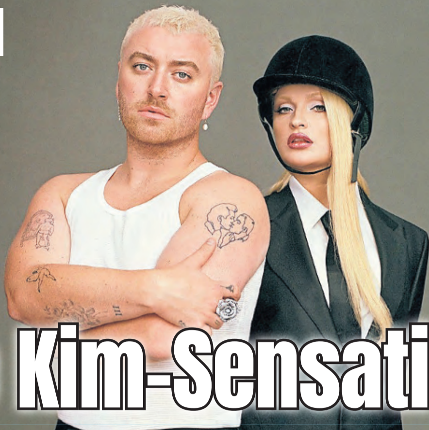
Sam Smith und Kim Petras.