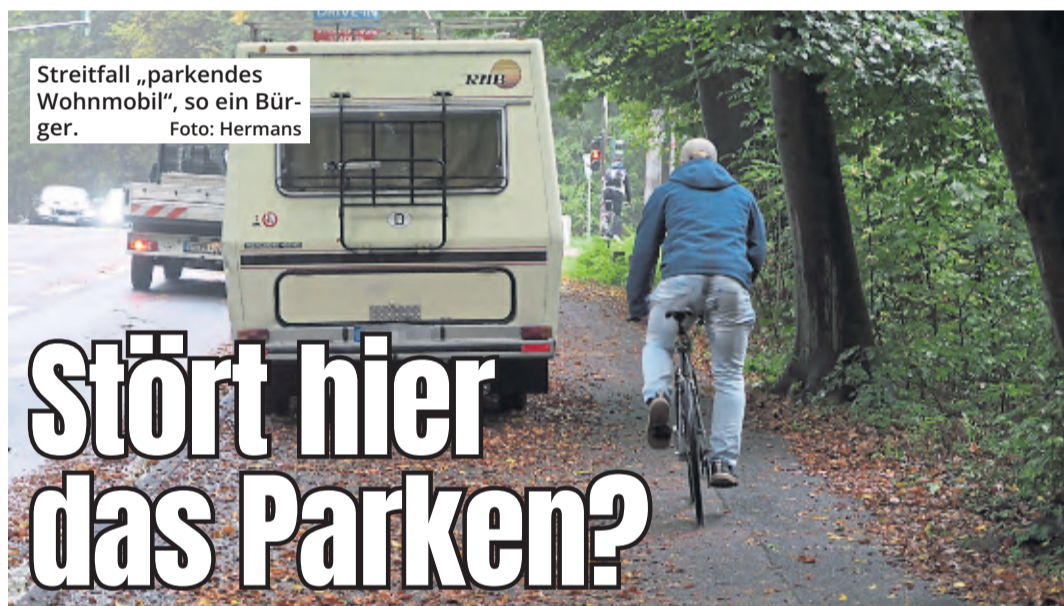
Streitfall „parkendes Wohnmobil“, so ein Bürger.

Proklamiert werden die Vier übrigens am 8. Januar 2023 im Rahmen einer kleinen „Sitzung“ in der Ildefons-Herwegen-Schule.