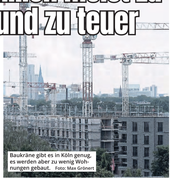
Baukräne gibt es in Köln genug, es werden aber zu wenig Wohnungen gebaut.

Der beliebteste Ort für den Wegzug aus Köln ist Bergisch Gladbach. Dorthin sind 2068 Menschen gezogen. Allerdings kamen auch 1137 Menschen