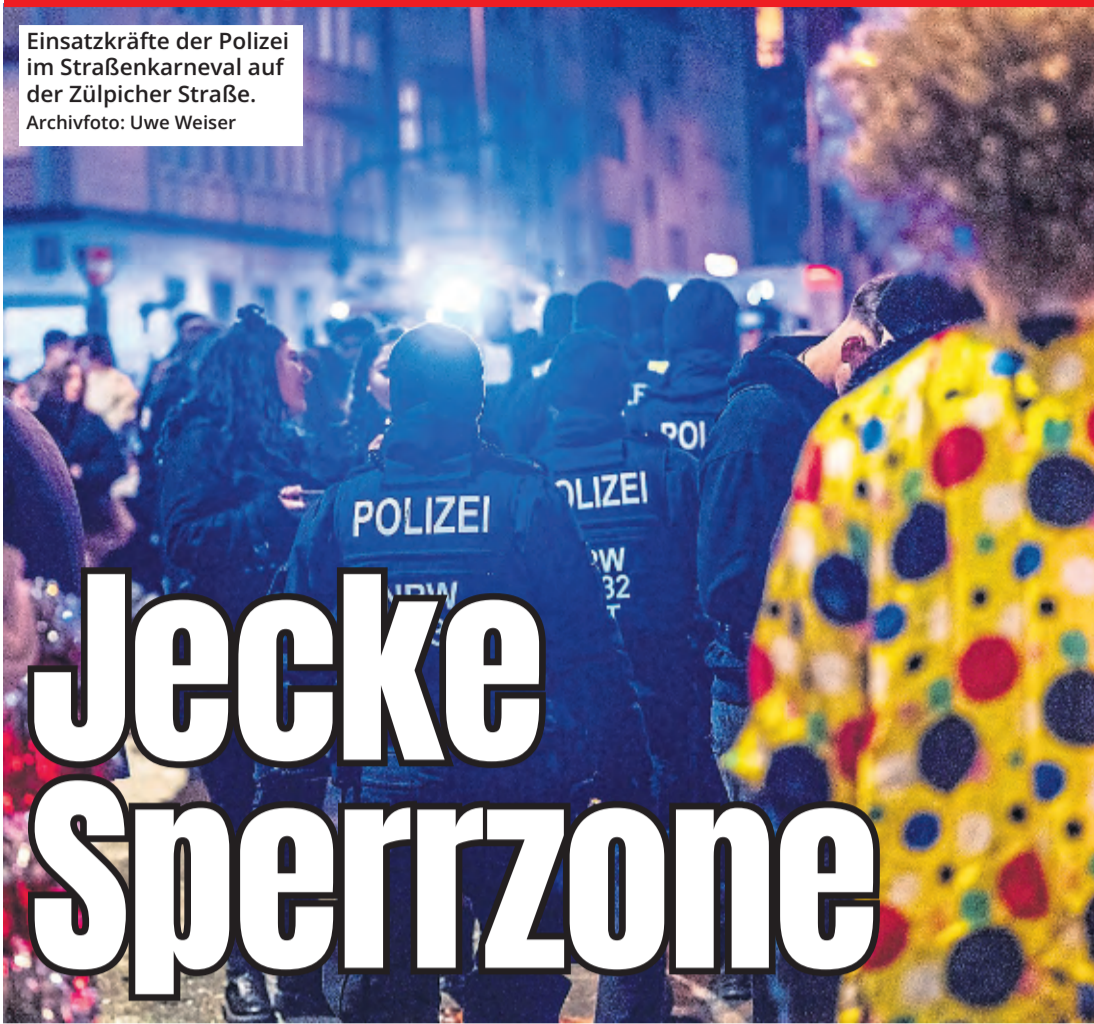
Einsatzkräfte der Polizei im Straßenkarneval auf der Zülpicher Straße.