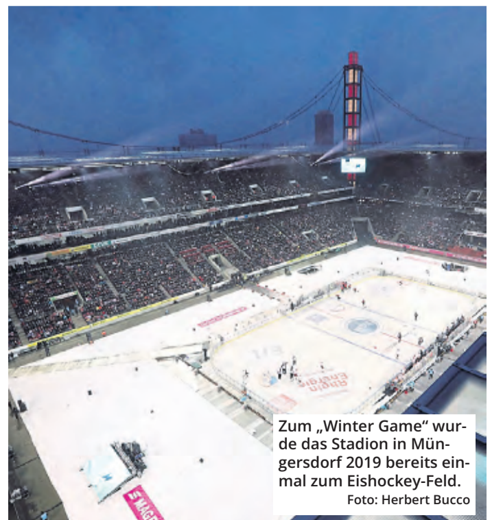
Zum „Winter Game“ wurde das Stadion in Müngersdorf 2019 bereits einmal zum Eishockey-Feld.

Wann, zu welchen Uhrzeiten und zu welchen Preisen das konkret möglich sein wird, steht aber noch nicht fest. Der KEC arbeitet an einem Terminplan, denn es soll noch weitere Freiluft-Aktivitäten geben, zum Beispiel für Schulklassen. Zudem sollen die Junioren des KEC eine Begegnung im Stadion austragen – genauso wie das Frauenteam der Kölner Haie.