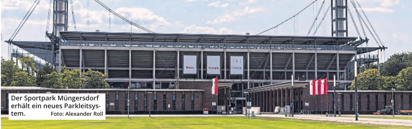
Der Sportpark Müngersdorf erhält ein neues Parkleitsystem.

Die Stadt plant die Erneuerung des dynamischen Parkleitsystems rund um den Sportpark Müngersdorf. Dafür hat die Verwaltung eine Vorlage erstellt, mit der sich Verkehrs- und Finanzausschuss befassen werden.