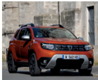
Dacia Duster, der Bestseller im Angebot