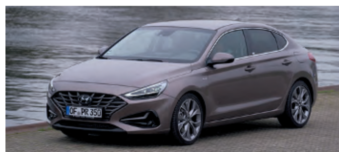
Der sportliche Hyundai i30 Fastback

das Navigationssystem in Echtzeit neue Informationen, etwa zu Staus und Umleitungen. Zum Hyundai Navigationssystem gehört außerdem Lifetime MapCare, eine regelmäßige Aktualisierung des Kartenmaterials bis zehn Jahre nach Produktionsende des Fahrzeugs. Zentraler Bestandteil der Bluelink-Telematikdiensten ist die Bluelink-App. Wer sie auf dem Smartphone installiert, kann seinen Hyundai aus der Ferne ver- und entriegeln, umfangreiche Statistik-Informationen über die Fahrten abrufen und die kommenden Einzahlungen des