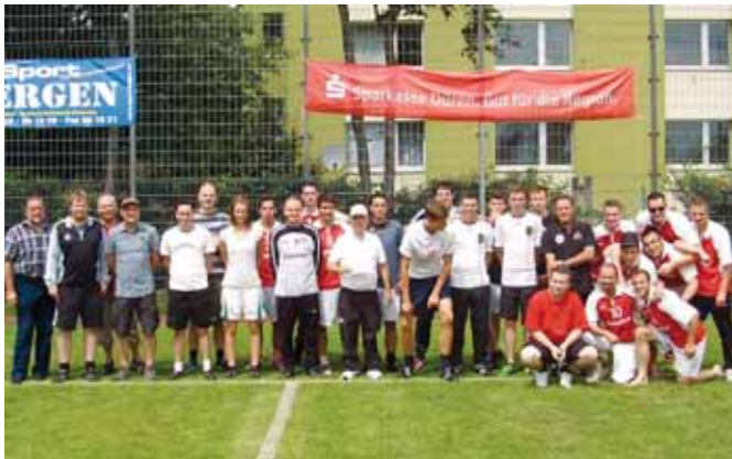
Die Sieger des 8m Schießens der Ortsvereine

Soweit zu den Spielen um den Gemeindepokal. Das Vereinsfest hatte aber auch noch andere interessante Veranstaltungen zu bieten. So fand am Sonntag, den 10.07., das traditionelle 8m-Schießen der Ortsvereine statt. Hier setzte sich überraschend bei ihrer ersten Teilnahme im Finale die Tennisabteilung des SV SW Huchem-Stammeln gegen die Maigesellschaft 1 durch. Auf dem Platz folgte die Freizeitmannschaft „Böse Buben“ des Vereins.