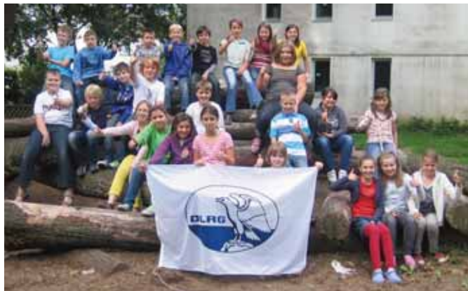
Die erfolgreichen Teilnehmer der KGS Hambach

Da die Kooperation mit der DLRG kostenfrei ist, bieten wir vom 9.-11. September 2011 eine Ausbildung zum Juniorassistenten an. Weiterhin unterstützt die Sparkasse die Anschaffung eines Kleinbusses, damit unser Anspruch, in spielerischer Form, frühzeitig unseren Jüngsten das Element Wasser näher zu bringen, an den Ausbildungsstandorten Hambach, Düren und Jülich möglich ist. Für weitere Sponsoren sind wir sehr dankbar.