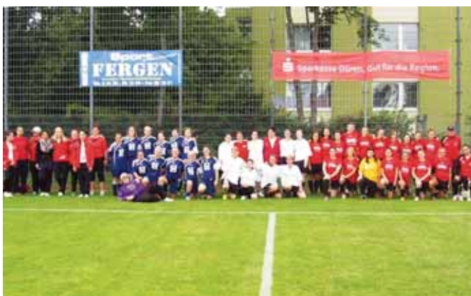
Die Teilnehmer des Damenturniers

Der Samstagnachmittag stand ganz im Zeichen des Frauenfußballs. Vier Mannschaften spielten hier um die Preisgelder. Am Ende siegten die Frauen des FC Rheinsüd Köln 2010 vor dem SV SW Huchem-Stammeln, Rot-Weiß Hütte und dem SV Kofferen.