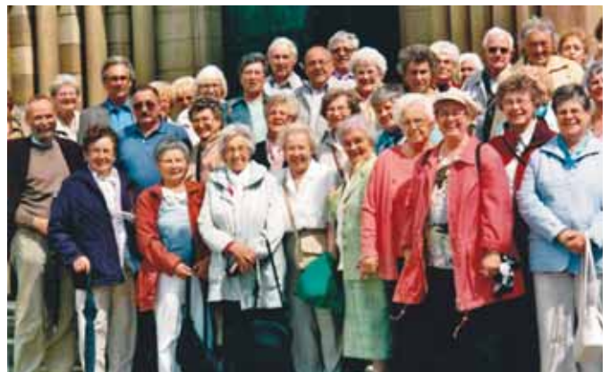
Die Pilgergruppe vor der Echternacher Basilika

Nach einem Spaziergang durch die historische Altstadt mit einem ausgiebigen Cafe-Besuch, traten die Teilnehmer wieder die Rückreise in die Heimat an.