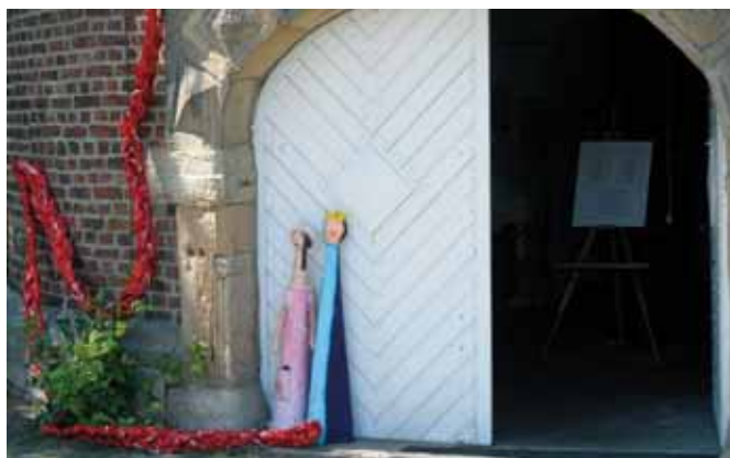
König und Königin bewachen den mehr als 10 Meter langen Zopf, den die SchülerInnen in Erinnerung an Rapunzel geflochten haben.