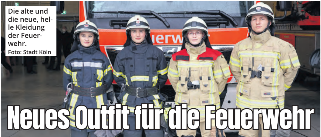
Die alte und die neue, helle Kleidung der Feuerwehr.

Von der umgesetzten Maßnahme profitiert auch der Fußverkehr. Die alten Parkstände zwischen Benjaminstraße und Grabengasse wurden auf den ehemaligen baulichen Radweg verlegt. Außerdem wurden dort neue Flächen zum Laden und Liefern eingerichtet. Die frei gewordenen Flächen kommen den Fußgängern zugute.