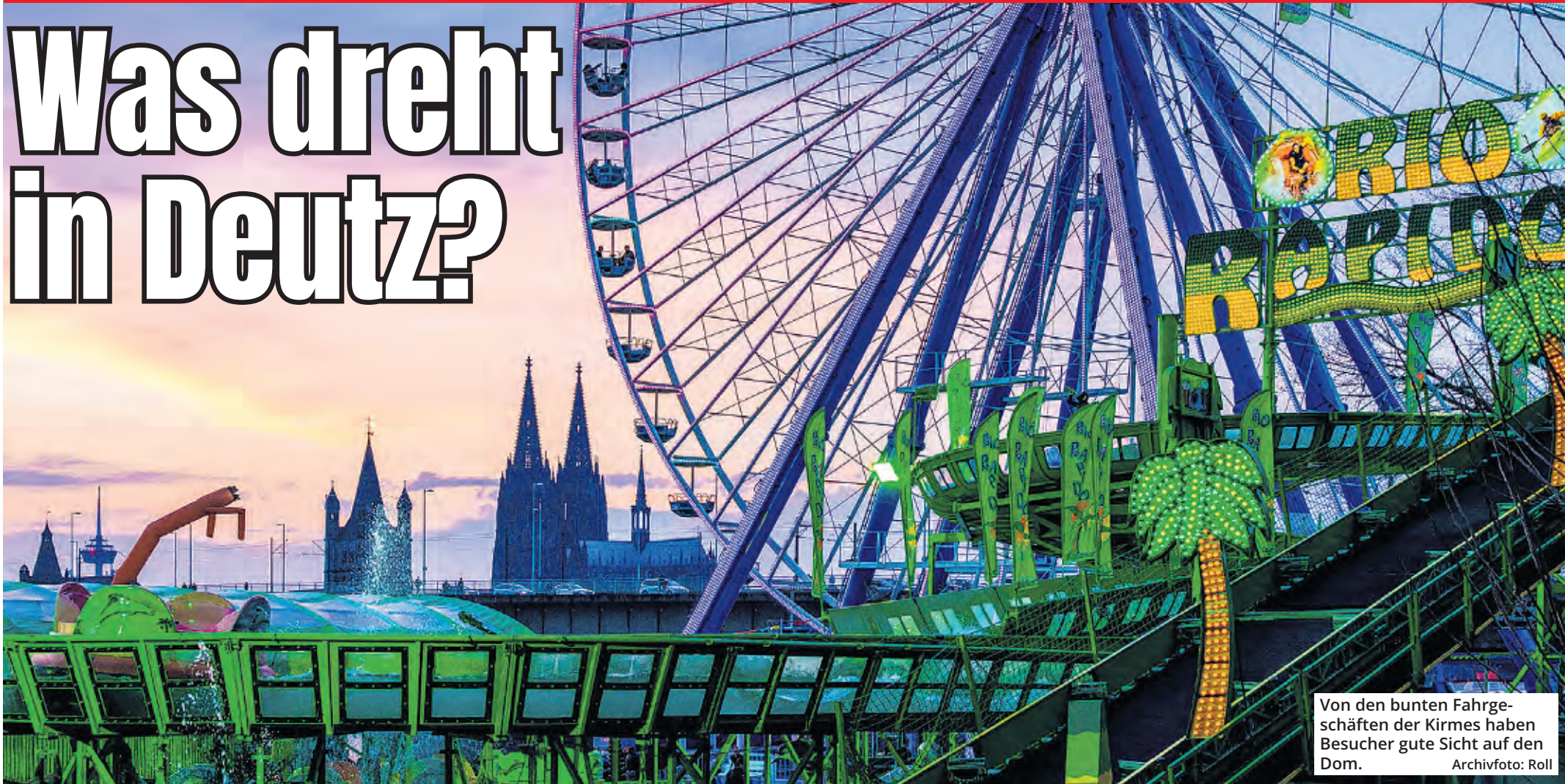
Von den bunten Fahrgeschäften der Kirmes haben Besucher gute Sicht auf den Dom.

Der goldene Oktober geht zu Ende mit Wochenend-Temperaturen von bis zu 24 Grad. Ideale Voraussetzungen also für einen Besuch auf der Herbstkirmes, die vom 28. Oktober bis zum 6. November am Deutzer Rheinufer steigt. Nur: Ist nach den Vorfällen im letzten Jahr für die Sicherheit gesorgt?