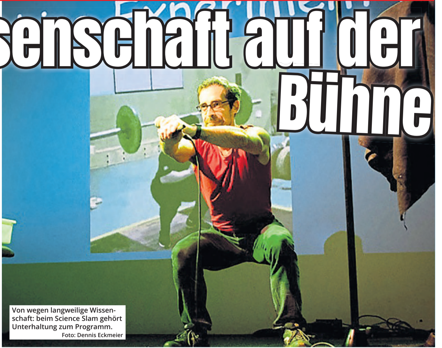
Von wegen langweilige Wissenschaft: beim Science Slam gehört Unterhaltung zum Programm.

Wer auch mal seine Forschung auf der Bühne präsentieren möchte, kann sich jederzeit bei den Organisatoren melden unter scienceslam.de