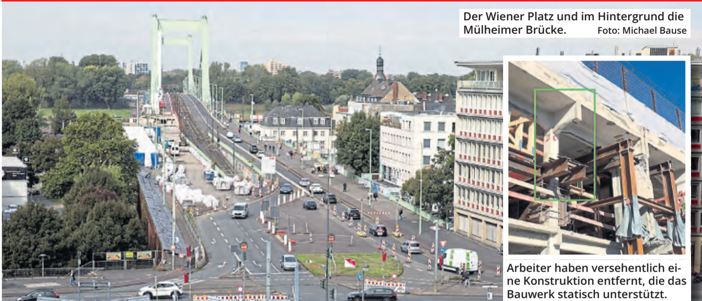
Der Wiener Platz und im Hintergrund die Mülheimer Brücke.

Arbeiter haben versehentlich eine Konstruktion entfernt, die das Bauwerk statisch unterstützt.