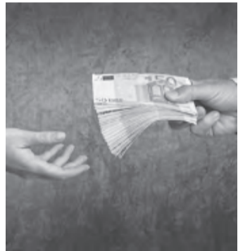
Es geht um viel Geld.

– alle eingezahlten Beiträge ohne Abzug von Maklerprovisionen und Verwaltungskosten zurück. Und nicht nur das: Die Versicherung muss Sie auch an dem mit Ihrem Geld erzielten Anlagegewinn beteiligen. So können Sie bis zu 150 % der eingezahlten Beiträge zurückholen!