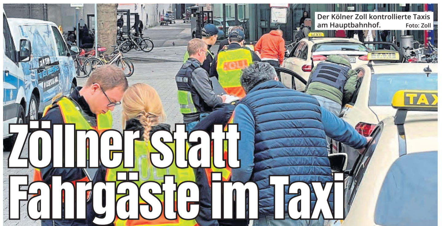
Der Kölner Zoll kontrollierte Taxis am Hauptbahnhof.

Nein, denkt Till Riekenbrauk: „Ich glaube nicht, dass das Verhältnis sehr viel schlechter werden kann.“ (red)