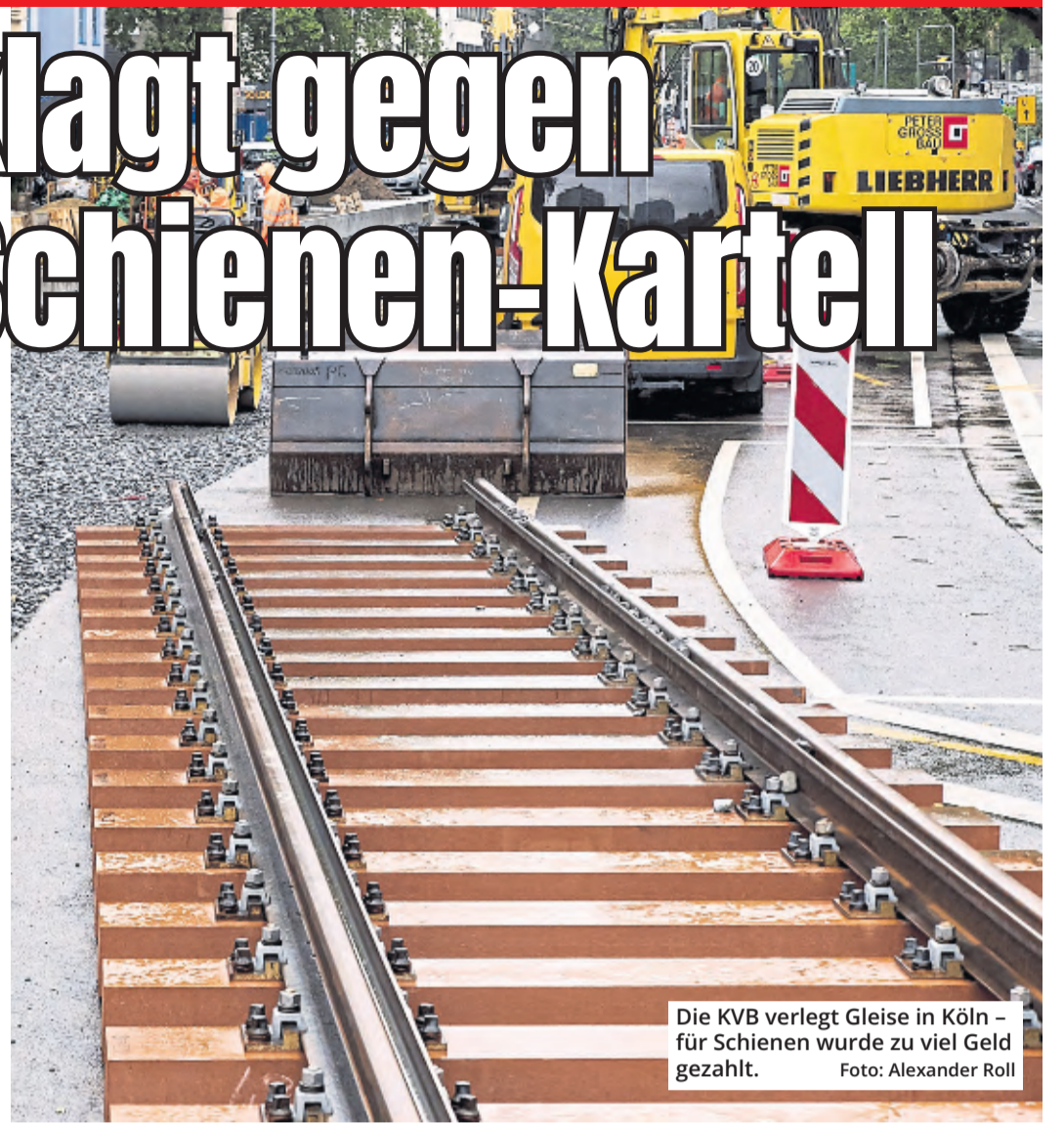
Die KVB verlegt Gleise in Köln – für Schienen wurde zu viel Geld gezahlt.

Köln. Bei dem Schienkartell sprachen sich Bahntechnik-Produzenten in den Jahren 2001 bis 2011 untereinander ab. Mitarbeiter entschieden unter der Hand, wer welche Ausschreibung gewinnen sollte. Nur zum Schein nahmen andere Kartellanten an Vergabeverfahren teil. Sie gaben übertriebene Angebote ab oder reichten Angebote bewusst zu spät ein – nur um den Eindruck zu erwecken, dass es Wettbewerb gebe. Das Kartellamt verhäng-