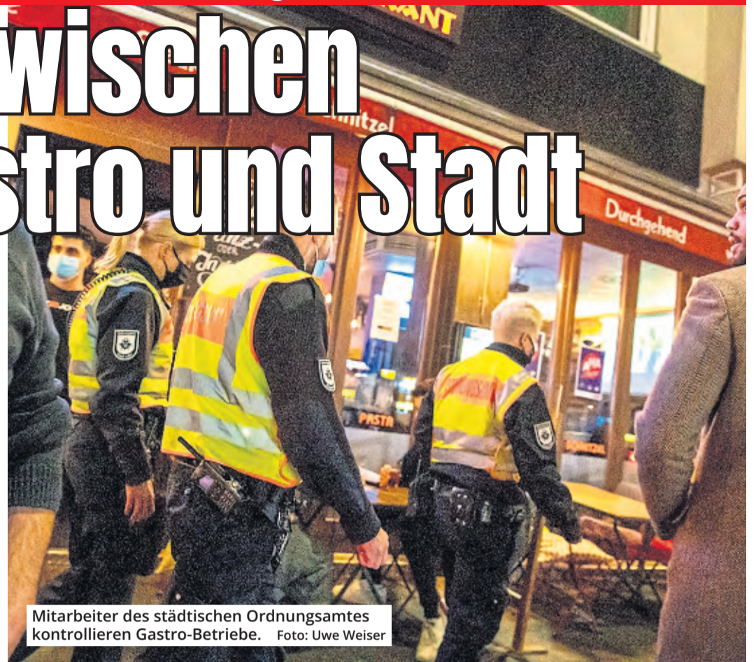
Mitarbeiter des städtischen Ordnungsamtes kontrollieren Gastro-Betriebe.

dem „Kölner Stadt-Anzeiger“ mit, die Vorwürfe „können in dieser Form nicht nachvollzogen werden“. Dies gelte etwa für das Thema Datenschutz. Der Begriff der Datenverarbeitung sei gesetzlich „sehr weit gefasst und umfasst nicht nur das Erheben, sondern auch das Offenlegen von personenbezogenen Daten gegenüber Dritten.“