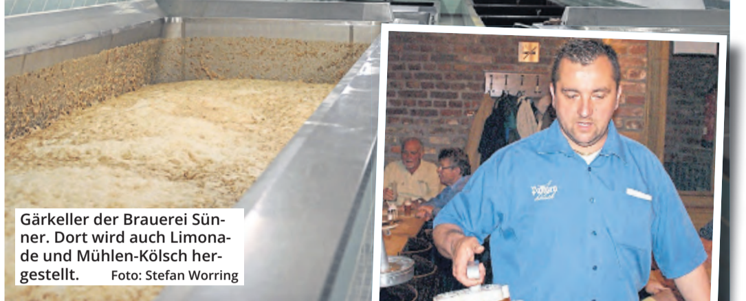
Gärkeller der Brauerei Sünner. Dort wird auch Limonade und Mühlen-Kölsch hergestellt.

Den Kölner Brauereien droht ein Lieferengpass. Einigen geht die Kohlensäure aus.