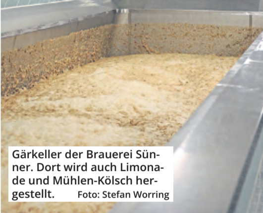
Gärkeller der Brauerei Sünner. Dort wird auch Limonade und Mühlen-Kölsch hergestellt.