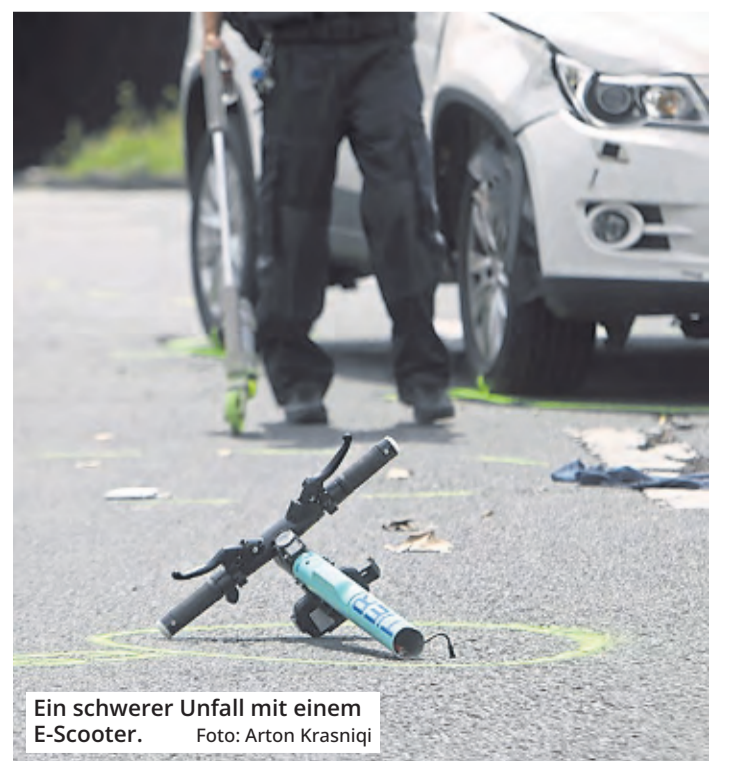
Ein schwerer Unfall mit einem E-Scooter.

Neben der schmerzhaften Erfahrung ist Alkohol auf dem Roller auch ein teures Vergnügen. Wer mit 0,5 bis 1,09 Promille fährt und keine alkoholbedingte Auffälligkeit zeigt, bekommt einen Bußgeldbescheid – in der Regel 500 Euro sowie einen Monat Fahrverbot und zwei Punkte in Flensburg. Wer mit mindestens 1,1 Promille unterwegs ist, begeht eine Straftat und ist den Führerschein los. Für E-Scooter-Fahrer bis einschließlich 20 Jahre gilt eine Null-Promille-Grenze.