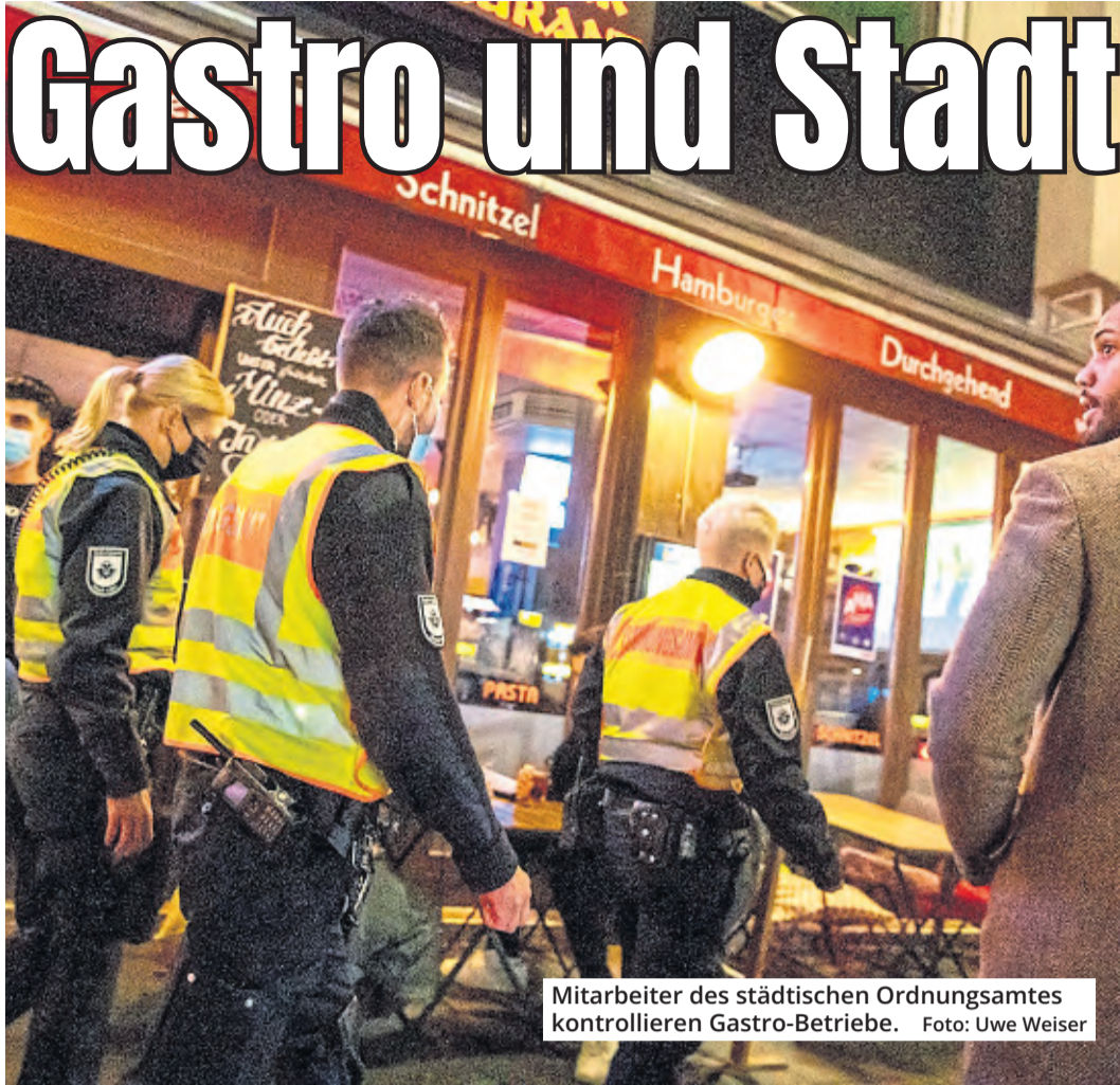
Mitarbeiter des städtischen Ordnungsamtes kontrollieren Gastro-Betriebe.

Nein, denkt Till Riekenbrauk: „Ich glaube nicht, dass das Verhältnis sehr viel schlechter werden kann.“ (red)