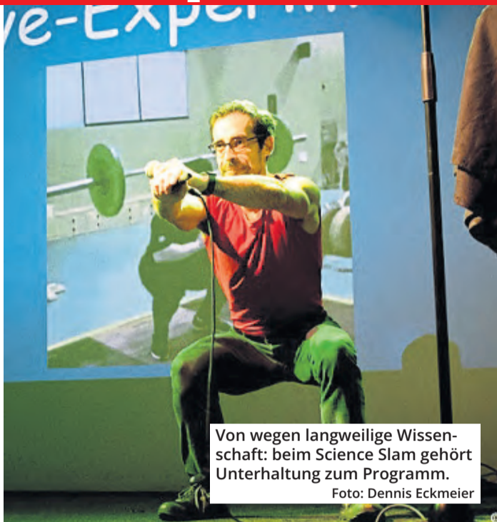
Von wegen langweilige Wissenschaft: beim Science Slam gehört Unterhaltung zum Programm.

Wer auch mal seine Forschung auf der Bühne präsentieren möchte, kann sich jederzeit bei den Organisatoren melden unter scienceslam.de