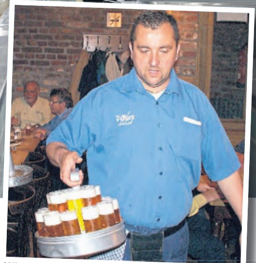
Wie lange sind die Kränze noch so voll?