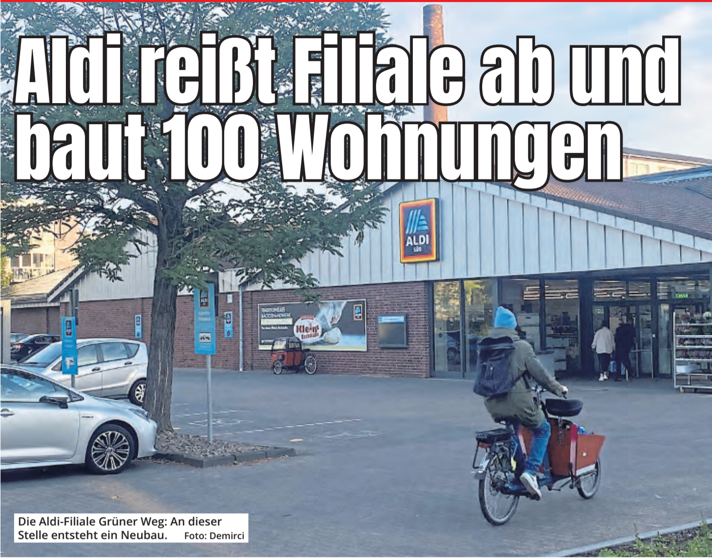
Die Aldi-Filiale Grünener Weg: An dieser Stelle entsteht ein Neubau.

Mitten in Ehrenfeld, im näheren Umkreis des Helios-Turms, sorgt ein Bauprojekt für Wirbel: Der Aldi-Süd-Konzern reißt seine Filiale „Grünener Weg“ ab – auf dem Baugrund soll ein mehrgeschossiger Wohn- und Geschäftskomplex hochgezogen werden.