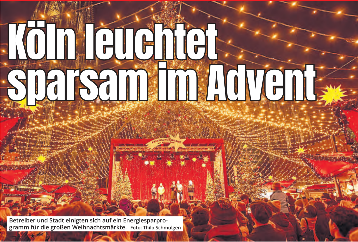
Betreiber und Stadt einigten sich auf ein Energiesparprogramm für die großen Weihnachtsmärkte.

Es leuchtet weihnachtlich am Ende des Energiespar-Tunnels. Trotz aller Notwendigkeiten, weiter Energie einzusparen, werden die fünf großen Weihnachtsmärkte in der Domstadt während der Adventszeit stimmungsvoll beleuchtet sein.