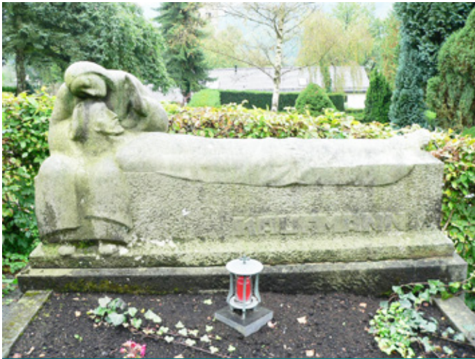
Das Familiengrab der Kaufmanns auf dem Morsbacher Friedhof wurde von dem Bildhauer Hans Meier gestaltet.

1882 geboren, folgte seinem Vater als Arzt in Morsbach. Auch er engagierte sich politisch, war ab 1920 Vorsitzender der Zentrumspartei, Mitglied des Gemeinderates und des Kreistages in Waldbröl sowie seit 1929 erster Beigeordneter in Morsbach. Er starb 1940.