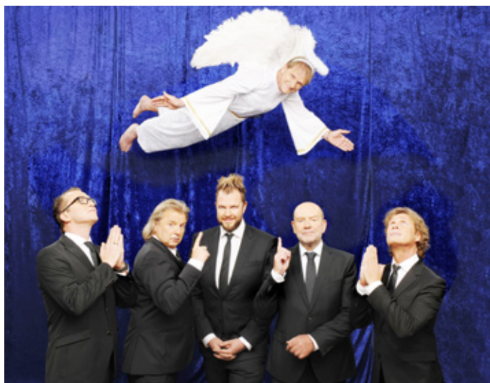
Die kölsche Kultband Paveier kommt am 8. Dezember 2021 auf Einladung des Heimatvereins in die Morsbacher Kulturstätte.

Der Heimatverein Morsbach e.V. kann im Jahr 2021 auf sein 125-jähriges Bestehen zurückblicken. Zu diesem runden Geburtstag macht sich der Verein selber, aber auch den Morsbachern sowie Interessierten aus den Nachbargemeinden ein besonderes Geschenk: Die bekannte kölsche Band Paveier kommt nach Morsbach. Am 8. Dezember 2021 bringen die Paveier weihnachtliche Stimmung mit. Zum ersten Mal gastieren die Paveier mit der Konzertreihe „Kölsche Weihnacht – Paveier und Gäste“ auch in der Kulturstätte Morsbach. Dort präsentiert die Band alte und neue Lieder in kölscher Sprache, in denen das schönste Fest des Jahres besungen wird, mal heiter und mit einem gehörigen Augenzwinkern, mal zu Herzen gehend und besinnlich.