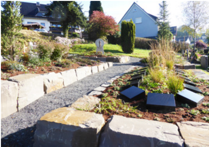
Die neu angelegten Grabfelder im oberen Teil des Morsbacher Friedhofs können ab sofort belegt werden.

Die katholische Kirchengemeinde Morsbach bietet als Träger des Friedhofes neue Grabfelder mit unterschiedlichen und individuellen Gestaltungsmöglichkeiten für Urnen an. Da die Bestattungskultur seit den letzten Jahren einem ständigen Wandel unterliegt, ist die Kirchengemeinde dem immer wieder gefolgt. So wurden Urnengrabfelder als Wahlgräber mit der Möglichkeit der individuellen gärtnerischen Herrichtung und Denkmalgestaltung in Form und Material angelegt. Zugrunde liegen die jeweiligen Rahmenbedingungen, die für so ein Feld vorgesehen sind. Die Nachfrage an neuen Flächen mit dieser Grabform ist stetig gestiegen und wird gerne weiterhin bereitgestellt.