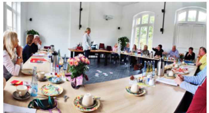
Die oberbergischen Lotsen und Lotsinnen der Ehrenamtsinitiative Weitblick trafen sich zum Austausch im Kulturbahnhof Morsbach: Foto: R. Kersjes