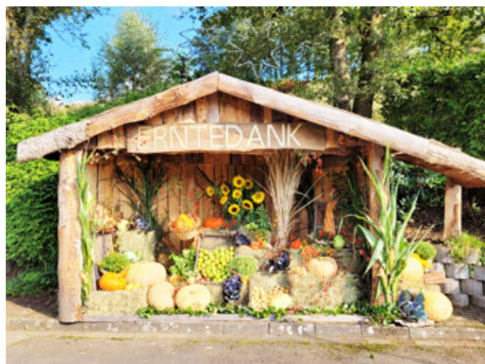
In Seifen wurde in diesem Jahr das Erntedankfest „einmal anders“ gefeiert. Neben Selbstgemachtem wurde die „Krippe“ dekoriert.

In Seifen wurde Ende September ein Erntedankfest gefeiert. Viele Einwohner haben sich an der Organisation des Festes beteiligt. Selbstgemachte Suppen und Liköre, frisches Obst und Gemüse wurden mitgebracht. Die Dekoration der „Krippe“ wurde durch einen in Morsbach bekannten Floristen durchgeführt. Beim anschließenden Erntedankfest fand ein reger Austausch über das vergangene Erntejahr statt. Alle Beteiligten waren froh, dass man nach einer coronabedingt langen „Leidenszeit“ endlich wieder zusammen feiern konnte. Das Sommerfest-Team Seifen freut sich darauf, dass bereits im November die nächste Aktion starten wird. Dann wird die „Paffesiefener Krippe“ wieder auf die anstehende Adventszeit vorbereitet.