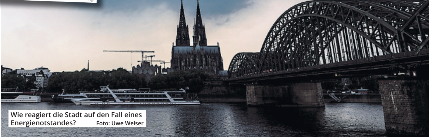
Wie reagiert die Stadt auf den Fall eines Energienotstandes?

Blackout 72 Stunden lang zumindest in einer Art Notbetrieb am Laufen zu halten, ist eine Herausforderung, sind sich Experten einig. Aber man müsse vorbereitet sein, auch