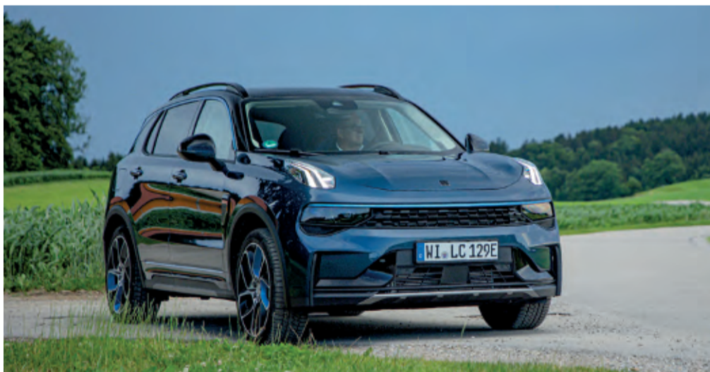
Erste Ausfahrt mit dem Lynk & Co 01, der technisch auf dem Volvo XC40 basiert