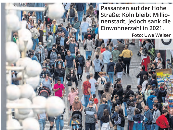
Passanten auf der Hohe Straße: Köln bleibt Millionenstadt, jedoch sank die Einwohnerzahl in 2021.

Ende 2021 lebten insgesamt 1073097 Menschen in der Stadt Köln. Ihren bisherige Höhepunkt erreichte die Einwohnerzahl Ende 2019, als 1087863 Kölner gezählt wurden. (alk.)