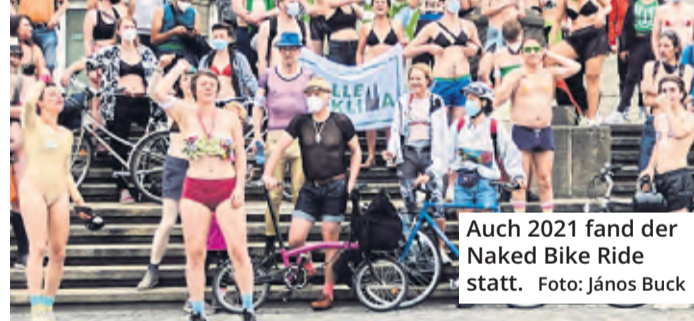
Auch 2021 fand der Naked Bike Ride statt.

Der Naked Bike Ride will in diesem Jahr ein Zeichen für sicheren Radverkehr setzen. Mit viel guter Laune sollen auch die Themen Klimaschutz, Si-