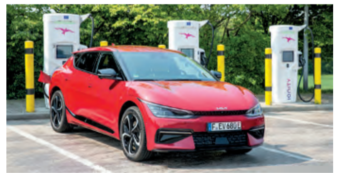
In 20 Minuten Strom für 300 km laden

Köln – Der Kia EV6, Europas „Car of the Year 2022“, hat einmal mehr seine Position im Segment der E-Autos unterstrichen. In der dritten Auflage des „P3 Charging Index“, mit dem die reale Ladegeschwindigkeit aktueller Stromer ermittelt wird, hat der Kia EV6 nicht nur die gesamte Konkurrenz hinter sich gelassen. Der getestete EV6 mit 77,4-kWh-Batterie und Heckantrieb hat darüber hinaus als erstes Fahrzeug in dem Index den Idealwert von 1,0 überboten. Dieser Wert entspricht der Fähigkeit eines Elektroautos, innerhalb von 20 Minuten Strom für 300 Kilometer reale Reichweite zu laden. Der EV6 lud Energie für 309 Kilometer und erzielte damit den neuen Rekordwert. Der „P3 Charging Index“ wird von der unabhängigen internationalen Unternehmensberatung P3 Group erstellt und wurde 2019 erstmals veröffentlicht, um Nutzern von Elektroautos einen aussagekräftigen, alltagsorientierten Vergleichswert