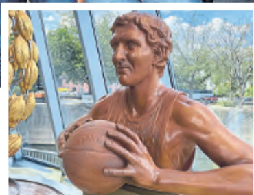
Dirk Nowitzki im Schokoladenmuseum.

Danke, Köln, für diese EM-Vorrunde der Superlative, inklusive Happy End. Das deutsche Nationalteam zeigte bei der EuroBasket 2022 Klasse-Leistungen und machte, lautstark unterstützt von den Fans auf den Tribünen der Lanxess-Arena, frühzeitig den Einzug in die Finalrunde klar. Da machte auch der Dämpfer gegen Titelverteidiger Slowenien nichts aus.