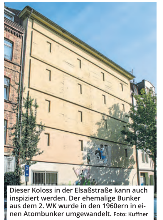
Dieser Koloss in der Elsaßstraße kann auch inspiziert werden. Der ehemalige Bunker aus dem 2. WK wurde in den 1960ern in einen Atombunker umgewandelt.