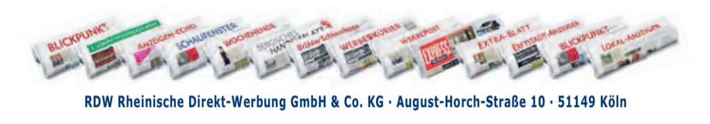
RDW Rheinische Direkt-Werbung GmbH & Co. KG · August-Horch-Straße 10 · 51149 Köln