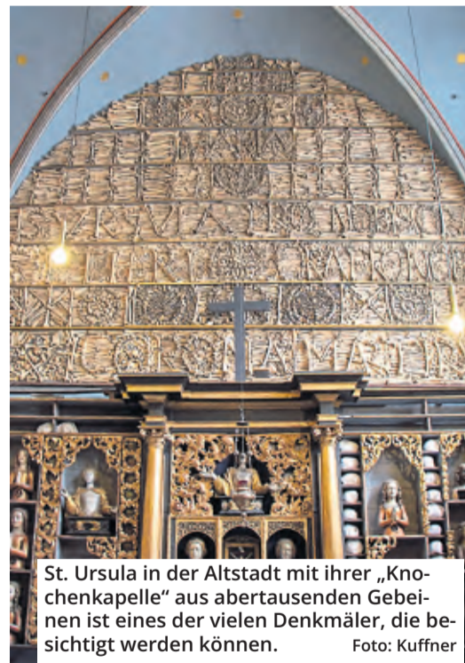
St. Ursula in der Altstadt mit ihrer „Knochenkapelle“ aus abertausenden Gebeinen ist eines der vielen Denkmäler, die besichtigt werden können.

Die meisten Veranstaltungen am 10. und 11. September sind ohne Voranmeldung zugänglich. Es genügt, einfach zum ausgewiesenen Treffpunkt zu erscheinen. Alle Infos zu allen Veranstaltungen in Köln gibt es unter offenesdenkmal.de